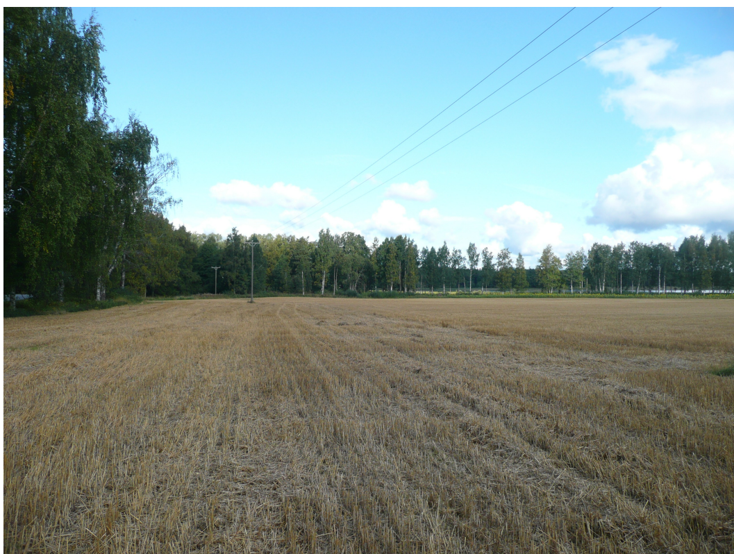
Kuva 3. Inventointialuetta Saaren pellolla. Kuva kaakosta.