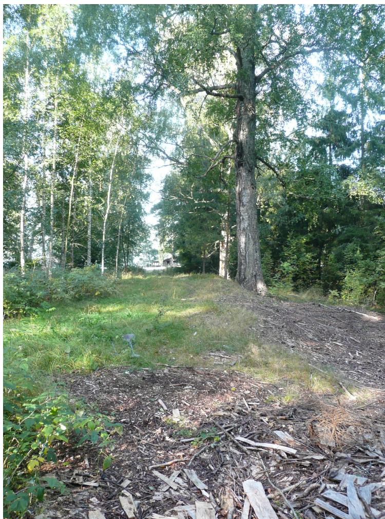
Kuva 1. Portaantieltä Venesillan leirintäalueen sisääntulotien kohdalta Kuivajärven rantaan johtava tie. Kuva koillisesta.

Kohdealueen kaakkoisosaan peltoalueen ja tien reunaan osui kapea korkeammalla sijaitseva vyöhyke, mistä oli mahdollista löytää merkkejä esihistoriallisesta toiminnasta. Historiallisten karttojen mukaan 1700-luvun tie on kulkenut aivan tämän alueen tuntumassa. Pelto oli puinnin jäljiltä. Alueelle kaivettiin muutamia koekuoppia, joissa todettiin 20-35 cm vahvan peltokerroksen alla puhdas vaalea hiesu. Metsään, peltoalueen reunaan tehdyssä koekuopassa esiintyi pintakerroksen alla ruskea sekoittunut hiekkakerros.