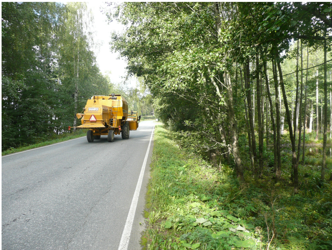
Kuva 2. Suunniteltu siltarummun kohta leikkuupuimurin kohdalla. Oikealla näkyvissä Kuivajärveen johtava uoma. Kuva idästä.