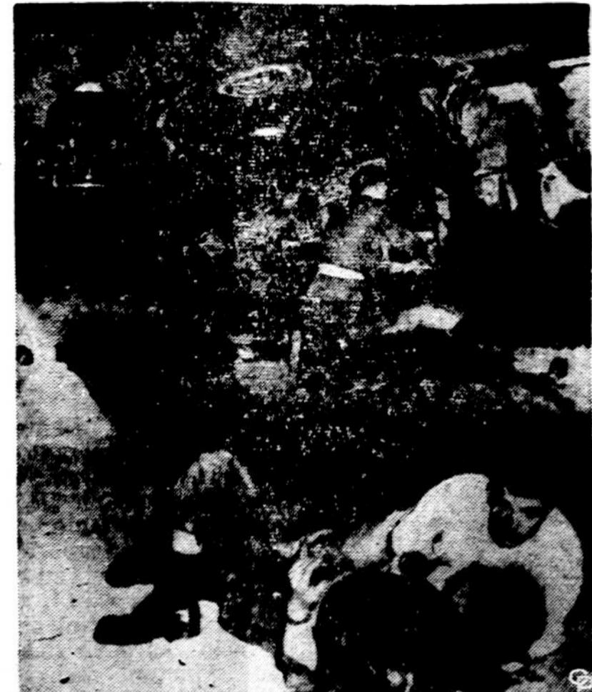
Trys kareiviai guli sužeisti automobilio nelaimėje prie Fayetteville, N. C., kur jų automobilis apsivertė ant kelio. Karo policininkas vieną sužeistą kareivį bando ištraukti iš aplamdyto automobiliaus. Vienas, baltais marškiniais kareivis, kiek mažiau sužeistas, stengiasi padėti savo pritręntam draugui.