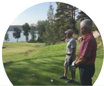
Liikkeellä luonnostaan – senioreiden toimintakausi s. 14-15