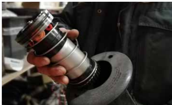
Kaikki sadettajat huolletaan oman henkilöstön toimesta.