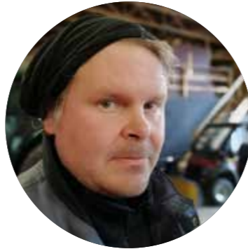
Ora joukkoinen pitää Lakesiden kentät kunnossa.

Tuon ensimmäisen kenttämestarikurssin suorittaneet sijoittuvat tällä hetkellä eri kentille ympäri Suomen. Porukka pitää yhä tiiviisti yhtä ja tottakai kuulumisiakin vaihdetaan, mutta tärkein asia on ammatillinen intressi aina parempaan kentänhoitoon. Porukan kesken vaihdetaan kokemuksia ja tietoja uusista tuotteista ja toimintatavoista ja niiden soveltuvuudesta. Yhdessä käydään myös pelaamassa golfia muutamana kerran vuodessa, jolloin päästään kasvatusten vaihtamaan ajatuksia ja arvioimaan myös muiden kenttien kuntoa.