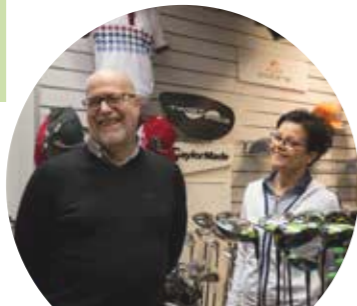
Golf Balata palvelee s. 22-23