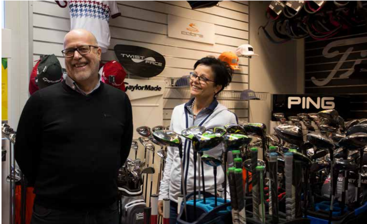
Golf Balatassa työnteko on hauskaa aamusta iltaan joka päivä koko kauden.