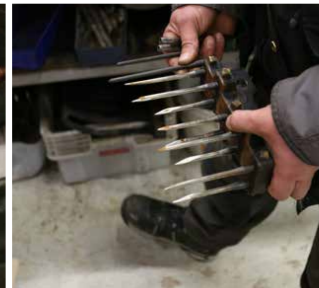
Pikkukampa, jolla on jo ilmastoitu 18 viheriötä.