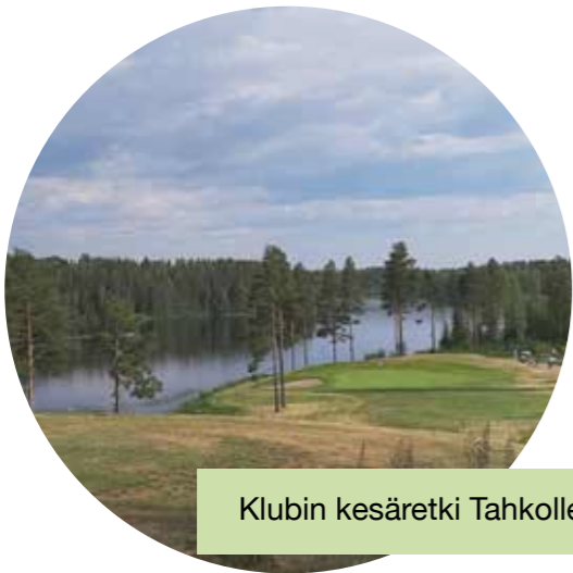
Klubin kesäretki Tahkolle s. 9