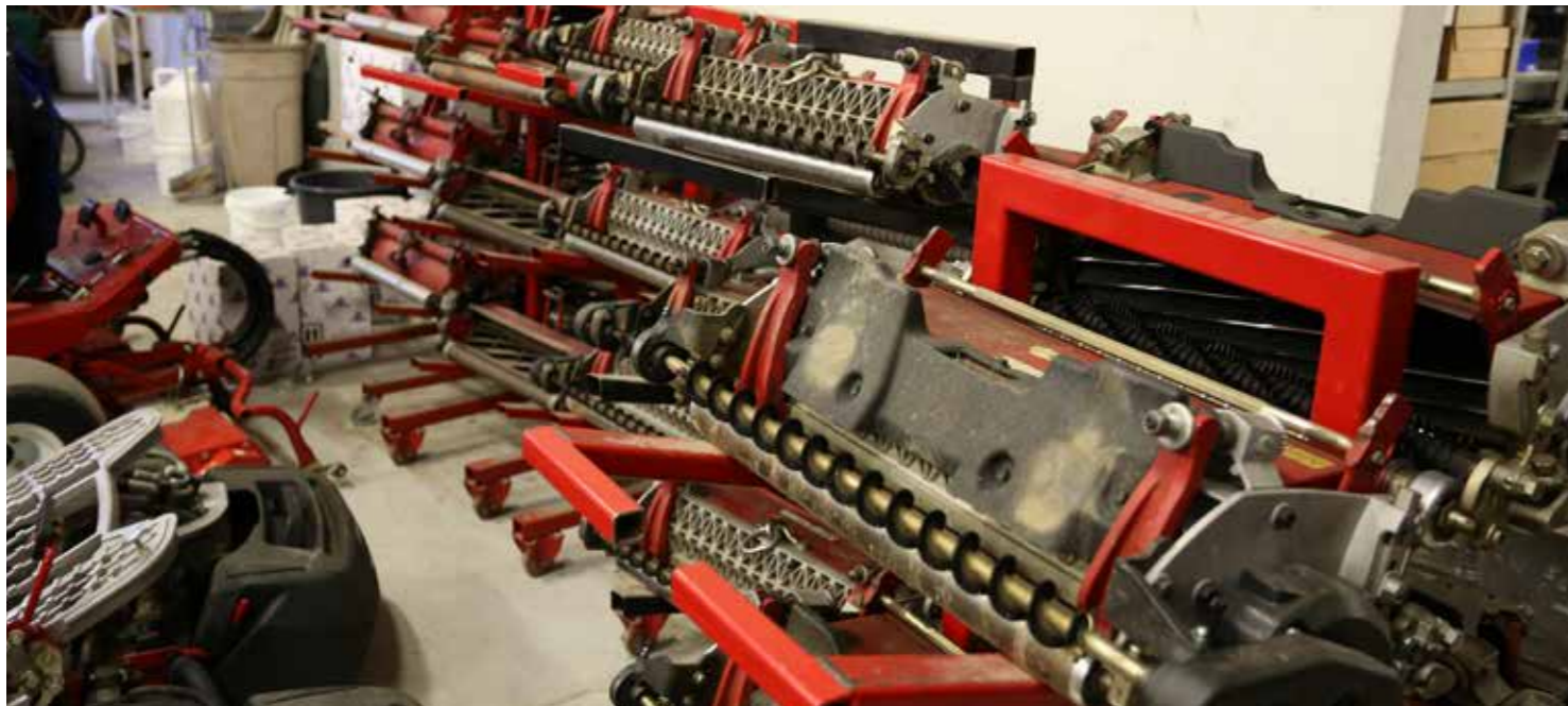
Viheriöleikkureiden vaihdettavissa olevia teräyksiöt - valmiina hommiin!

Talvella sitten tehdään isommat konehuollot ja tarvittavat korjaukset seuraavaa kautta varten. Kaikkiaan konekantaan kuuluu seitsemän viheriöleikkuria, kaksi leikkuria lyöntipaikoille, neljä väyläleikkuria, yksi semiraffikone, kaksi raffileikkuria sekä bunkkerikone. Lisäksi konekanta täydentävät kaksi monitoimiajoneuvoa ja kolme traktoria lisälaitteineen. Tämän lisäksi myös pallonkeruuseen ja kentällä liikkumiseen on omaa kalustoa. Kaikki leikkureiden teräyksiköt teroitetaan kuntoon uutta kautta varten. Yhden teräyksiön teroitus kestää kahdesta tunnista kahdeksaan tuntiin terästä ja sen kunnosta riippuen. Maksimissaan yhdellä terällä voidaan sitten leikata jopa 100 hehtaarin ala. Kesän aikana jokaisella kentänhoitajalla on oma vastuualueensa ja nimikkokoneensa ja jokainen pitää huolta omasta koneestaan tehden muun muassa öljynvaihdot itse. Öljyt vaihdetaan 100 tunnin ajon jälkeen. Kentänhoitokoneet ovat todella kalliita, mutta hyvällä huollolla ja huolenpidolla koneiden käyttöikä saadaan pitkäksi. Meillä käytössä on yli 20 vuotta vanhoja ja edelleen täysin käyttökelpoisia laitteita!