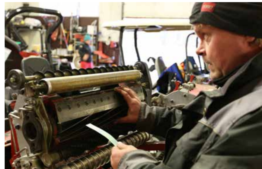
Teräyksiköiden kunto tarkistetaan päivittäin testaamalla, kuinka hyvin ohut paperi leikkaantuu.