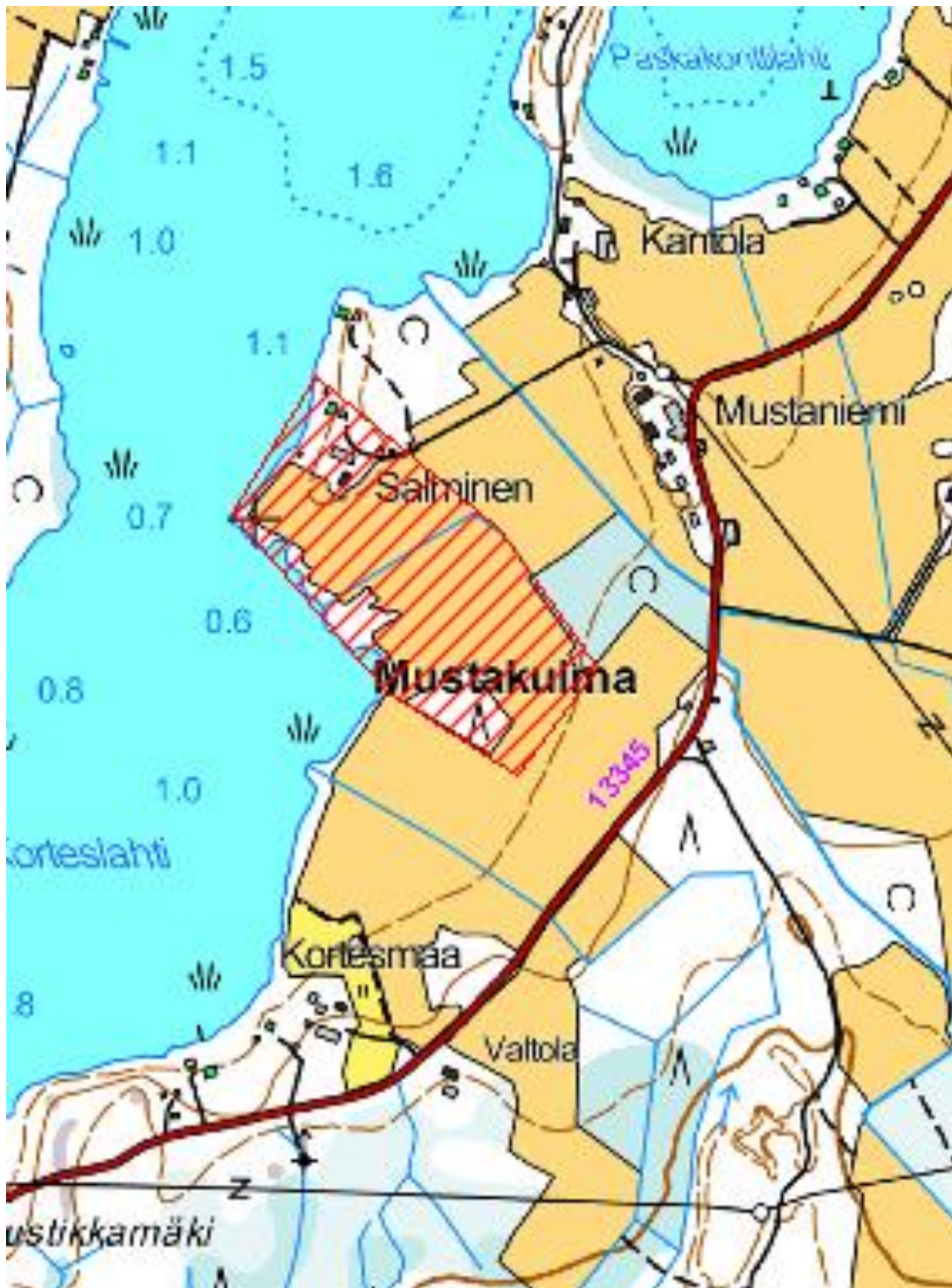
Kartta 2. Kihniön Niemen inventointialue. Alue merkitty punaisella vinoviivakuviolla karttaan. Pohjakartta © Maanmittauslaitos 2015. Lisäykset karttaan: Eva Gustavsson