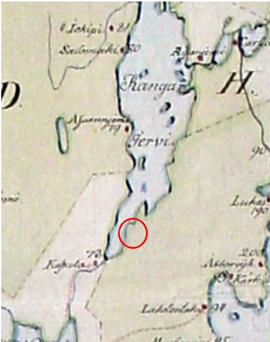
Kartta 3. Pitäjänkartta vuodelta 1806. Inventointialue jää punaisen ympyrän sisään. Lisäykset karttaan: Eva Gustavsson