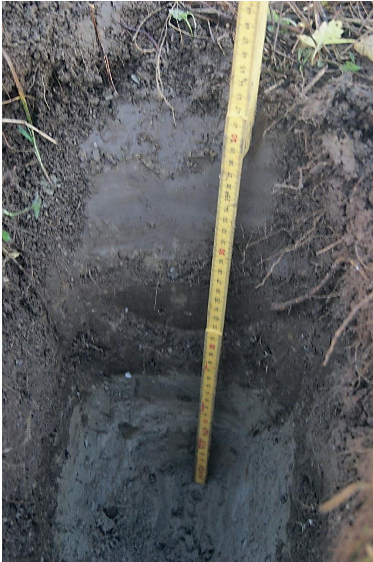
Kuva 4. Koekuoppa 3.