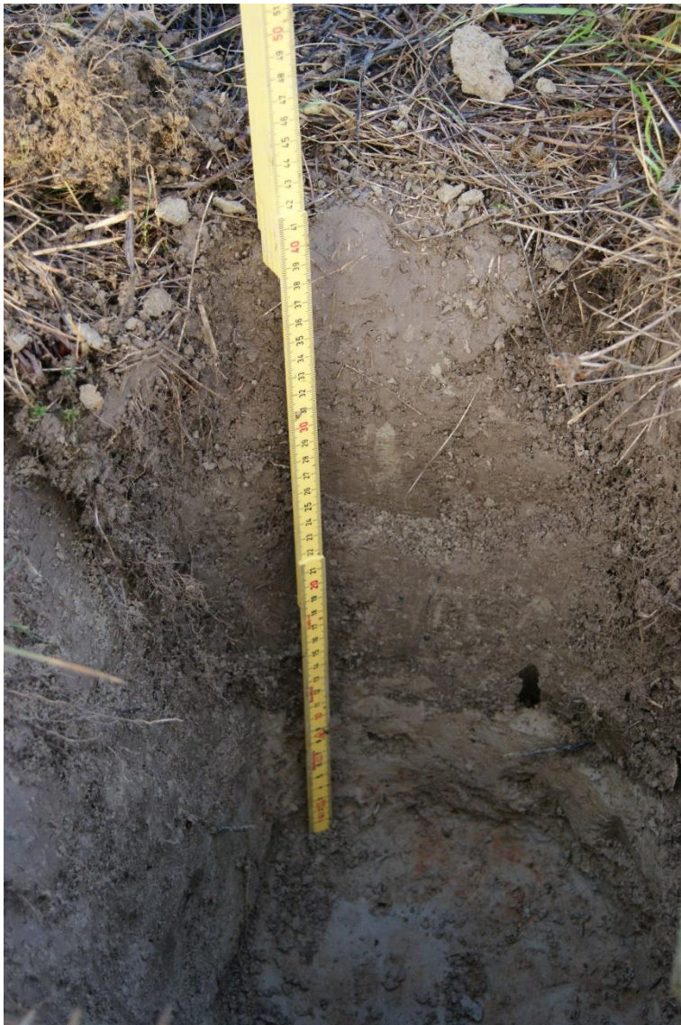
Kuva 3. Koekuoppa 2. Pohjalla vaaleassa hiesussa on jälleen oransseja läikkiä.

Löydöt/Havainnot: Vaaleassa hiesussa hiukan hiilen palasia.