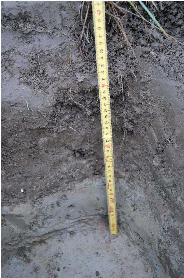
Kuva 2. Koekuoppa 1. Vaaleassa hiesussa näkyy oransseja läikkiä.

Löydöt/Havainnot: Vaaleassa hiesussa hiilen palasia