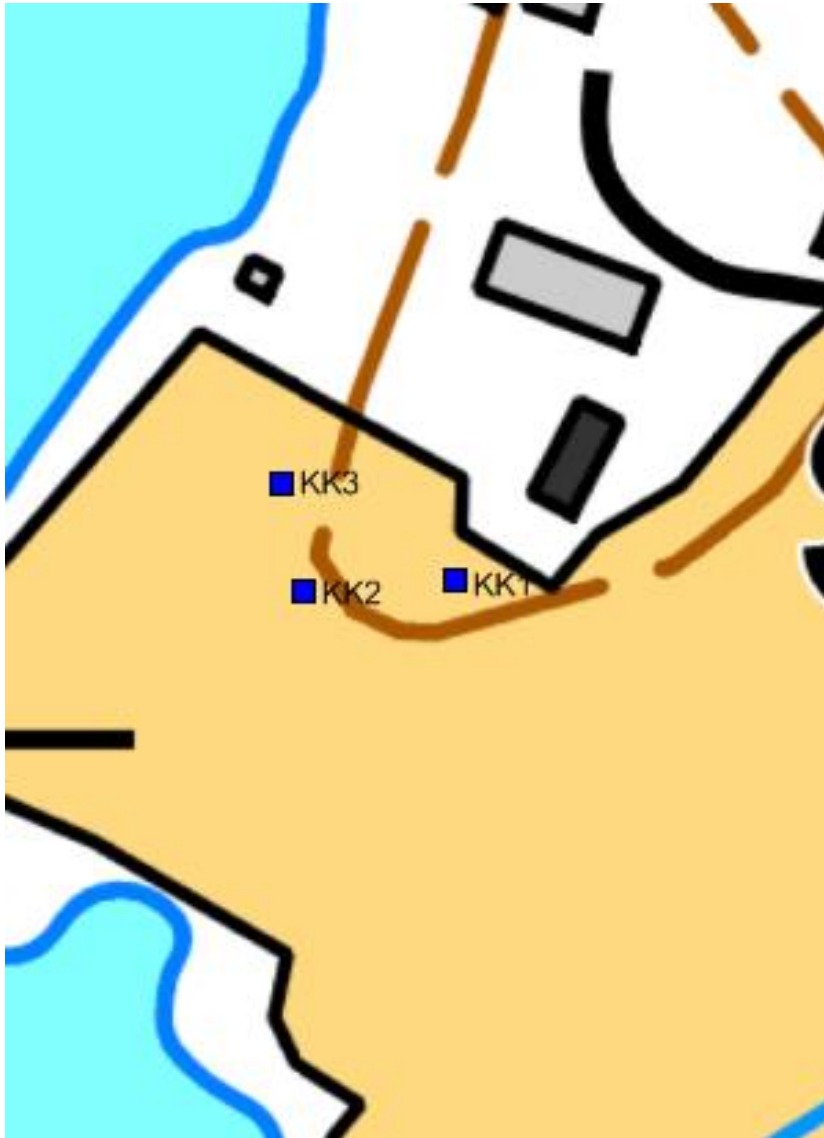
Kartta 4. Koekuopat merkittynä sinisellä neliöllä. Pohjakartta © Maanmittauslaitos 2015. Lisäykset karttaan: Eva Gustavsson