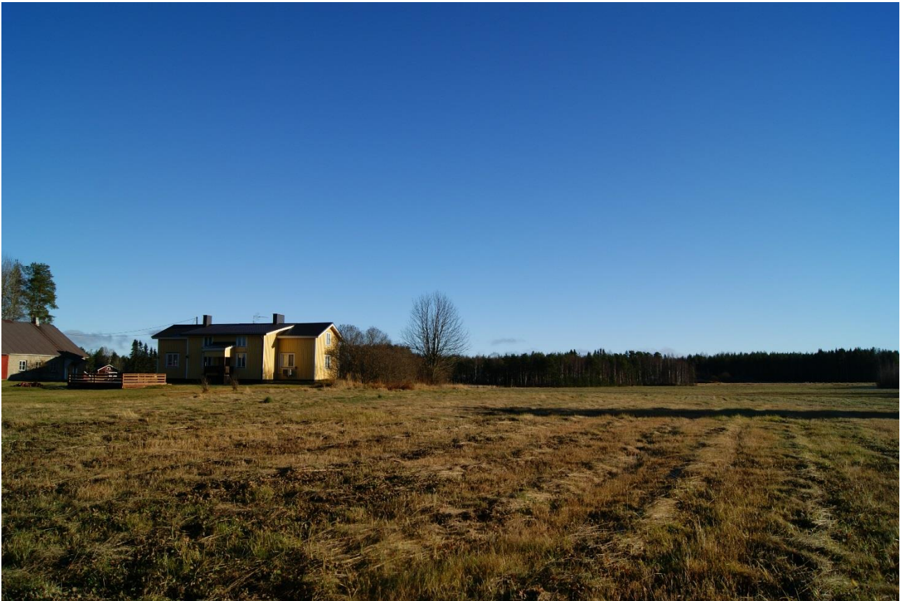
Kuva 1. Inventointi-aluetta kuvattuna länsilounaasta. Tehdyt koekuopat sijoittuvat etualalla olevan loivaan rinteeseen.

Jälkityövaiheessa kartat piirrettiin puhtaiksi käyttäen MapInfo Gis -paikkatieto-ohjelmaa. Valokuvat tallennettiin Pirkanmaan maakuntamuseon Siiri-tietokantaan.