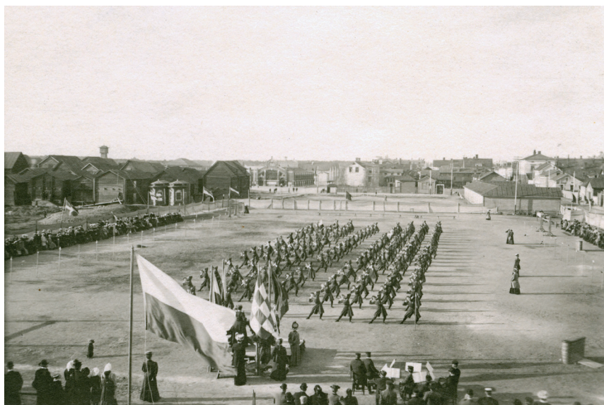
Bild 2. Fältuppvisning vid gymnastikfesten i Uleåborg 1909. Nere till höger ser man hur hornorkestern beskådar uppvisningen.

Bruket av fosterländska marscher, sjungandet av fosterländska sånger, men också landskapssånger, visar att även de kvinnliga gymnasterna gymnastiserade för fosterlandet: även kvinnornas välmående och fysiska hälsa var viktigt för den finländska samhällsutvecklingen. Här kan man dra en parallell till hur arbetarrörelsens körer, speciellt damkörerna, genom att sjunga fosterländska sånger och traditionell manskörsrepertoar underströk att arbetarrörelsen arbetade för hela fosterlandets väl samt att "kultur, konst, politik, historia och Finlands framtid också tillhörde kvinnorna". 48