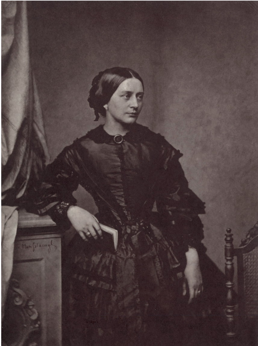
Kuva 1. Clara Schumann vuonna 1857.