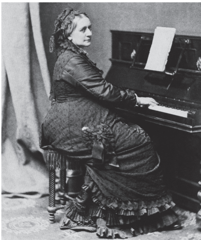
Kuva 4. Clara Schumann vuonna 1878.

maan sitä vastaan oikein hyvin”. 24 Vaikka Clara Schumann editoi teosta vielä myöhemminkin lukuisia kertoja, teosta ei julkaistu Schumannin elinaikana vaan se sai ensipainoksensa vasta sata vuotta säveltäjän kuoleman jälkeen, vuonna 1996. Teoksen muoto on melko konservatiivinen verrattuna hänen aikaisempiin sävellyksiinsä, mutta sisältää mielenkiintoisia romanttisia harmoniakulkuja erityisesti sen C-osassa. 25