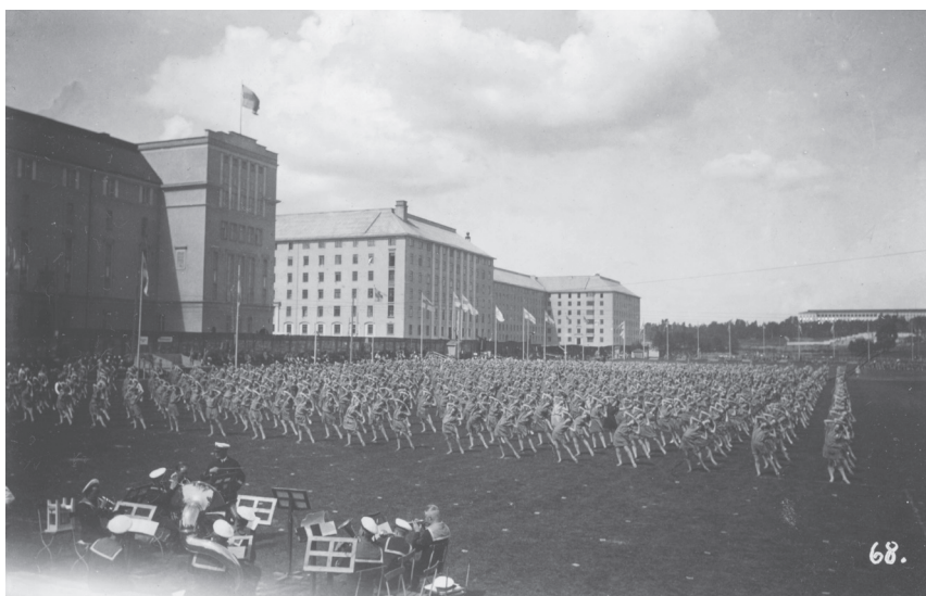
Bild 5. Gymnastikuppvisning vid SNLL:s internationella gymnastikfest i Helsingfors 1929.