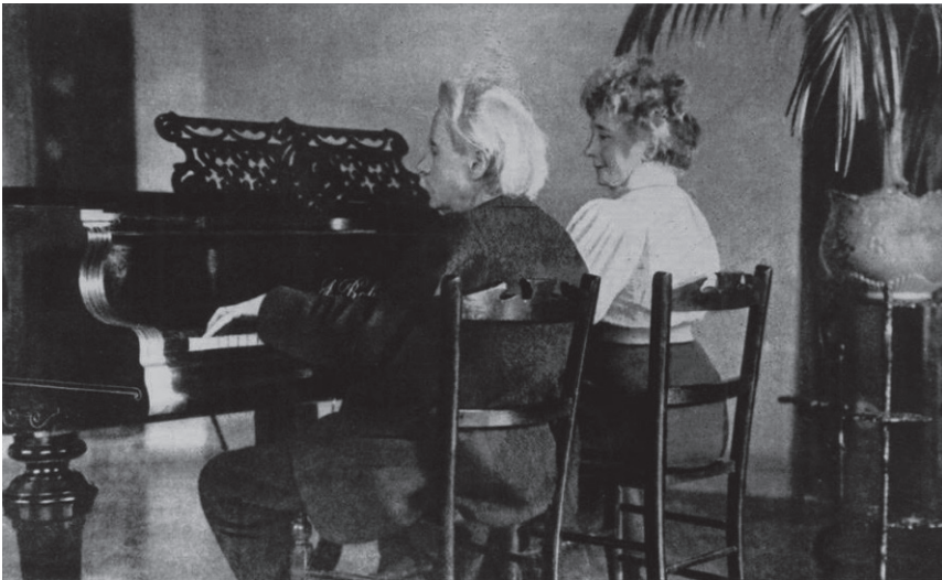
Kuva 2. Edvard Grieg ja Nina Hagerup Grieg pianon ääressä vuonna 1906. Kuvaaja tuntematon. Lähde: Palmer 2019.

Nelikätinen pianomusiikki edustaa genrenä mielenkiintoista hybridiä taide- ja käyttömusiikin ( Gebrauchsmusik ) välillä. Yhtäältä se on tunnettu sovituksistaan (orkesteri-, vokaali- ja kamarimusiikki) sekä pedagogisesti käyttökelpoisista, teknisesti helpohkoista teoksistaan, toisaalta monet säveltäjät ovat kirjoittaneet taiteellisesti kunnianhimoista ja pianoteknisesti innovatiivista musiikkia juuri tälle kokoonpanolle. Nelikätisen pianomusiikin kulta-aikana voidaan pitää 1800-lukua. Porvariston nousun myötä myös pianolla oli paikkansa varakkaiden perheiden olohuoneissa, ja markkinat amatööritasoiselle nelikätiselle musiikille olivat valtavat. Nelikätinen pianomusiikki oli näin ollen yksi keskeisimpiä yksityiskodeissa tapahtuvan yhteismusisoinnin muotoja aina 1900-luvun ensimmäiselle vuosikymmenelle asti. 12