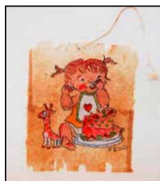
Pikku-Annin synttäreitä ei saa unohtaa