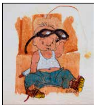
Pikku-Kalle saa aurin-koa