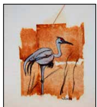
Siellä on kurki kasvi- maalla