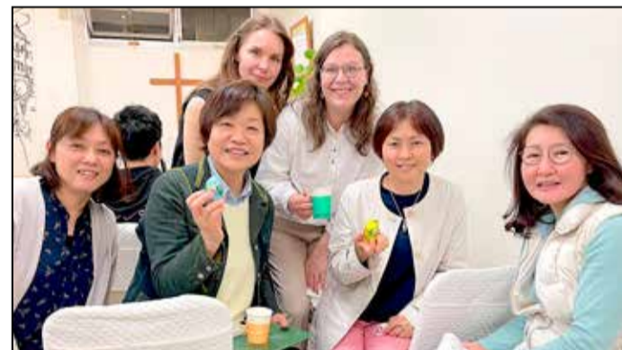
Seurakunnan tilaisuuteen osallistui joukko suomen kielen kurssilaisia. Suomen kielestä ovat kiinnostuneita erityisesti eri alojen opettajat.

laiset ovat tavanneet mukavia suomalaisia.