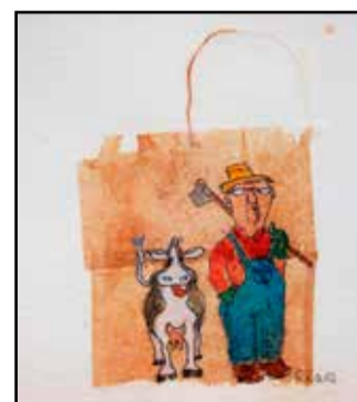
Naapuri tulee ruohoja hakemaan