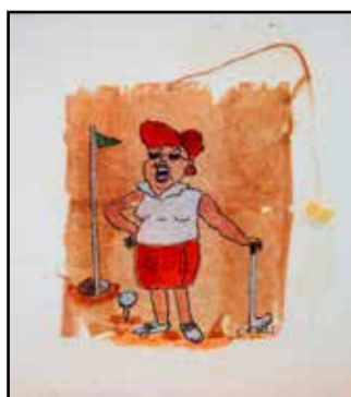
Nyt ei ehdi golfaamaan