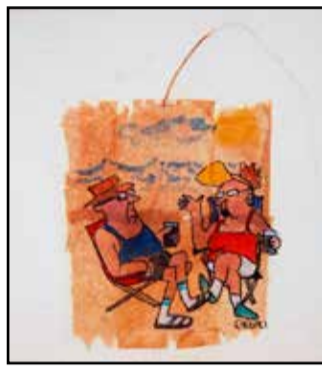
Sitten ehkä ehditään huilata