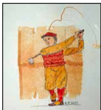
Nyt ei ehdi golfaamaan

Kuvatekstit: Jussi Paarvala