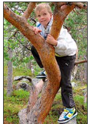
Rasmus luonani Hjemmelufin luontopolulla Altassa.