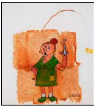
Pitää hakea viides piikki