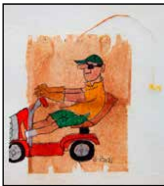
Ruohot on taas ajamatta