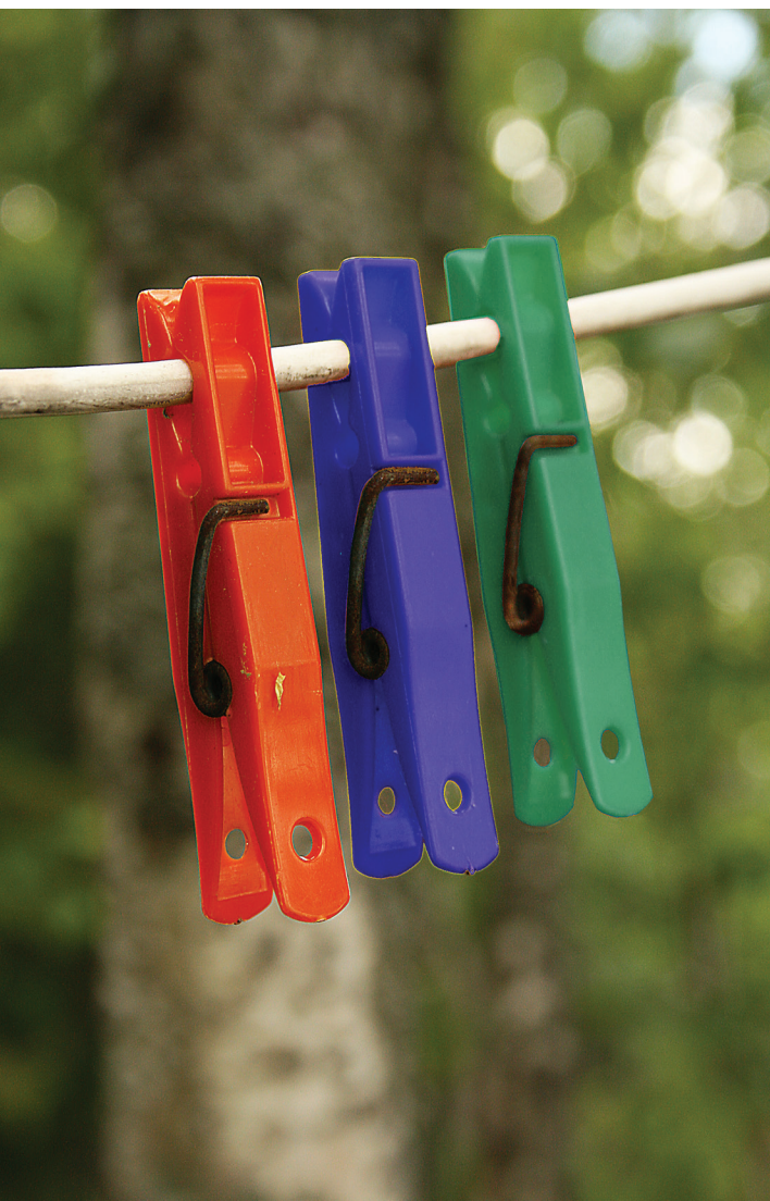
Uppslagets bilder: ELVI – NTM-centralens kommunikationsservice