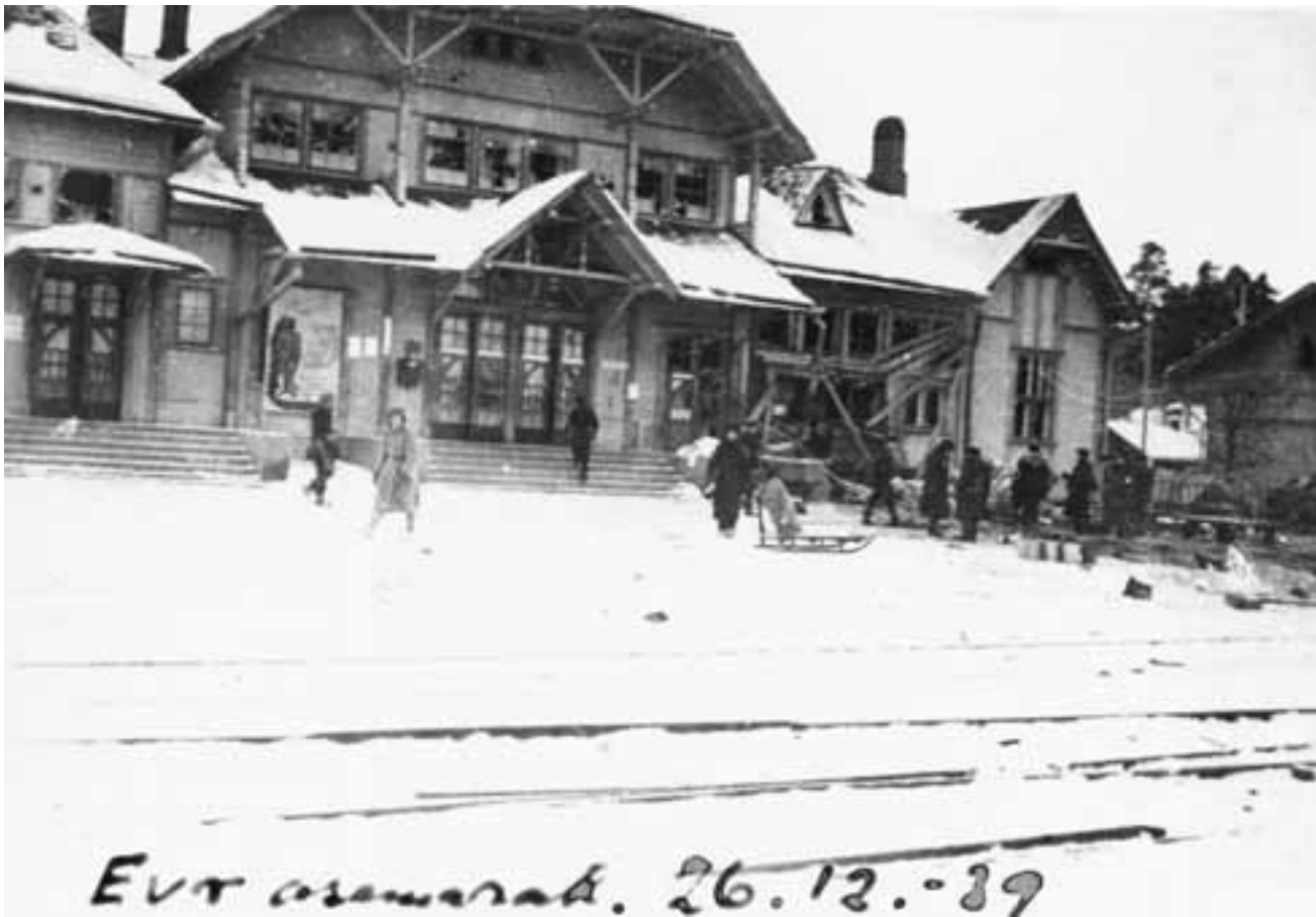
Elisenvaaran asemarakennus ratapihan puolelta 26.12.1939.