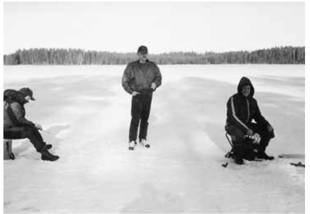
Kolme kalakurkea enemmän tai vähemmän pilkkimäisissä puuhissa.

Ilmoittautumiset ja kopio passista (ellei ole toimitettu aikaisemmin) viimeistään 5.3. mennessä Martille tai Sainille, puh. (02) 763 1442 tai 040-770 9853. Heiltä saa myös muita matkaa koskevia tietoja. Hymyilläään, kun tavataan, tavatessa halataan, halatessa salataan kaikki, mitä halutaan.