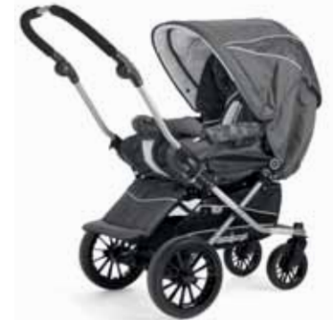
25408 Grey Leaves