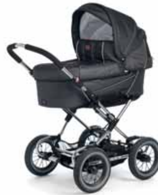
12403 Denim Black