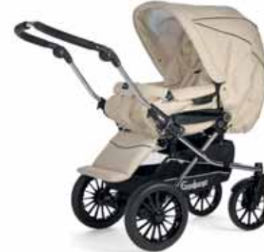
27417 Vanilla Leatherette