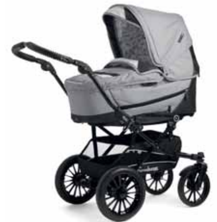
City Koppa Supreme Super Nitro rungolla