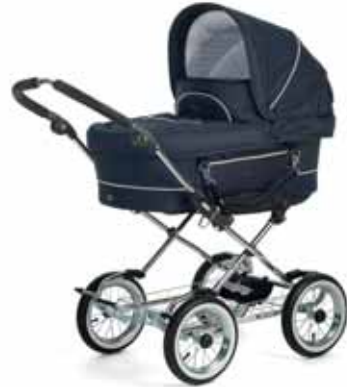
Mondial 11401 Navy

Mondial Duo Combissa on kaikki, mitä tarvitaan syntymästä kolmen vuoden ikään. Vaunun kopan saa helposti vaihdettua rataistuimeen kun lapsi kasvaa. Valitse 8 eri rungon välillä.