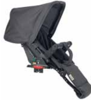
38424 Dark Grey