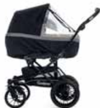
81400 Sadesuoja Exclusive nylon City Koppa Supreme/Viking/Super Viking