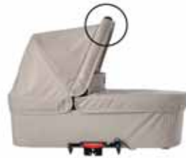
Kopassa kätevä kantokahva

Super Viking on luultavasti maailman vahvin lastenvaunu - se kestää jopa 40 kg!