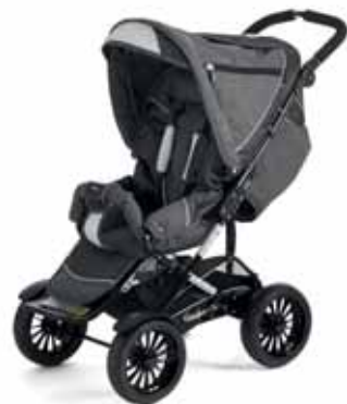
37424 Dark Grey