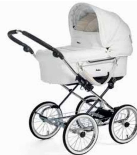
Mondial 17496 De Luxe Chrome/Leatherette