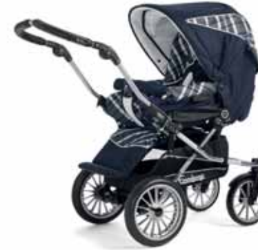
27412 Capri Navy