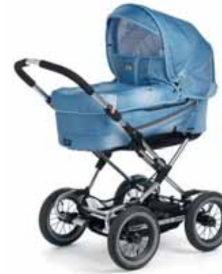
12404 Denim Blue