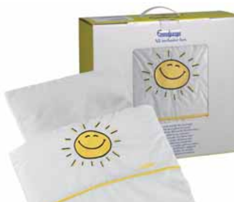
64458 Happy Sunshine