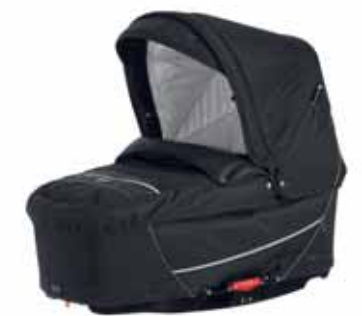
26413 Black Graffiti