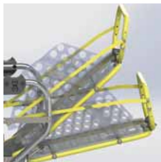
Safe Frame-päänsuojus istuinosassa