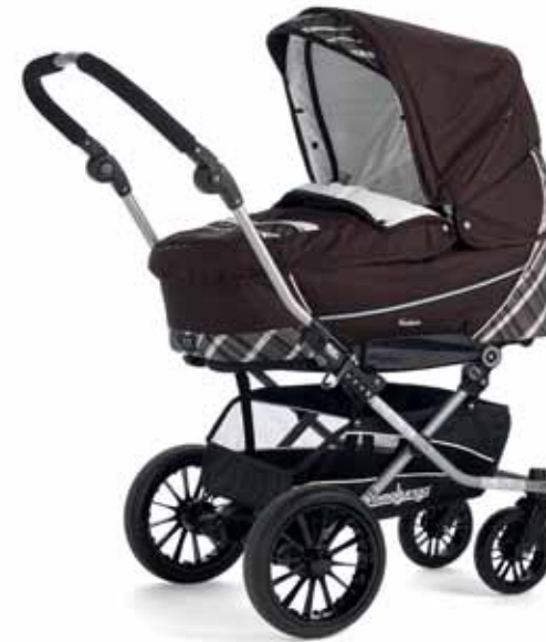
Nitro Capri Brown 26411 Nitro City Koppa Supremella