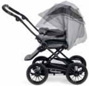
Eteen vedettävä kuomu