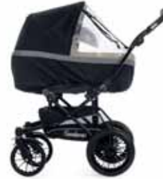
Lisävarusteet: Sadesuoja Exclusive