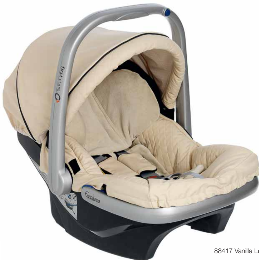
88417 Vanilla Leatherette

Vauvasi ensimmäinen matka on oletettavasti matka kotiin synnytyssairaalaan. Sen jälkeen seuraa monta matkaa pienokaiselle, jolloin hänen täytyy saada matkustaa turvallisesti. Emmaljunga on usean vuoden ajan kehittänyt FirstClass 0+base , turvaistuinta, joka on valmistettu vastamaan korkeimpia vaatimuksia niin turvallisuuden, materiaali- ja valintojen, mukavuuden, ergonomian, käyttömukavuuden kuin suunnittelunkin osalta. Istuin on täysin omaa luokkaansa. Jos et ajomatkan jälkeen halua herättää lasta voit nostaa turvaistuimen autosta ja kiinnittää sen useimpien Emmaljunga runkojen päälle (Travel system adapterin avulla) ja jatkaa matkaasi kävelen.