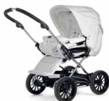
21416 White Leatherette