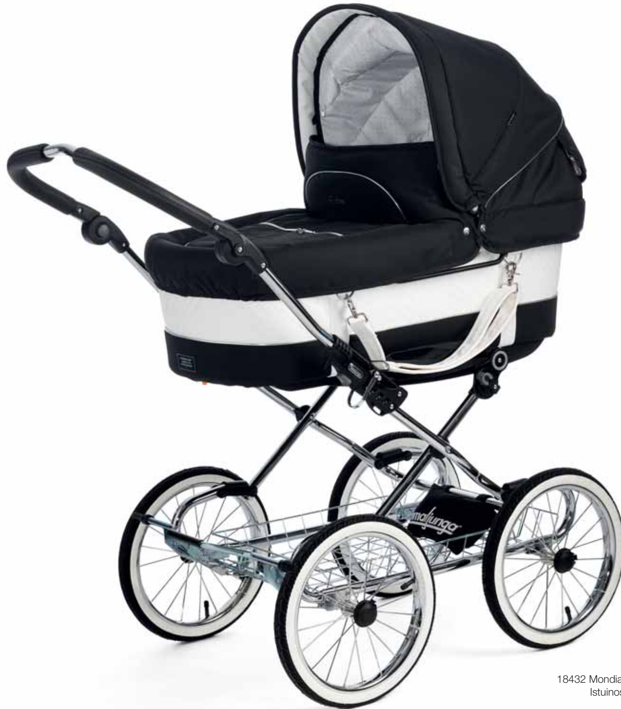
18432 Mondial de Luxe London Istuinosa sisältö