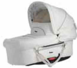
Tilava ja ylellinen koppa