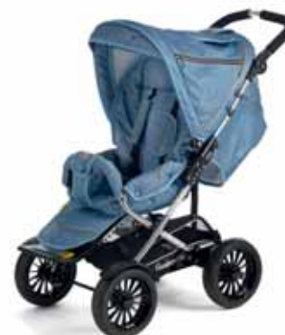
37404 Denim Blue