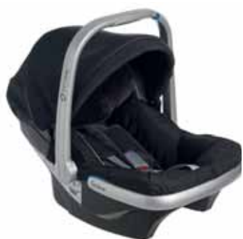
88402 All Black

Turvaistuin voidaan kiinnittää myös jalustan kanssa. Katso lisätietoa www.emmalunga.se