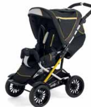
37429 Black Yellow