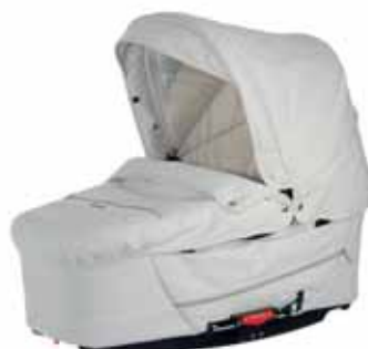
26416 White Leatherette