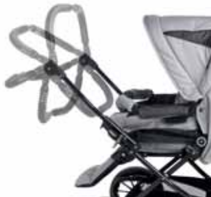
Säädettävä työntöaisa Classic, Duo S, de Luxe Runko

Automaattinen lisäosan lukitusmekanismi, joka helpottaa lisäosan sekä Travel Systemin kiinnitystä ja irrotusta rungosta