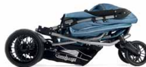
Scooter S kasaan taitettuna