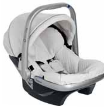
88416 White Leatherette