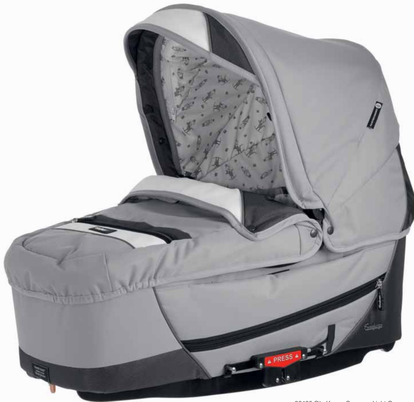
26425 City Koppa Supreme Light Grey