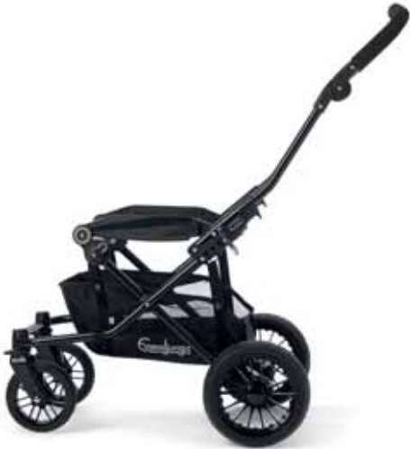
Viking Runko 33400 Black