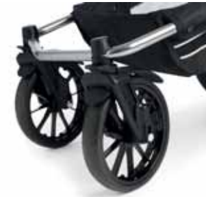
Kääntyvät etupyörät Super Nitro