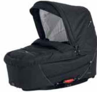
26402 All Black