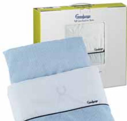
64450 Navy Pinstripes