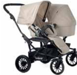
Istuinosa + Vaunukoppa