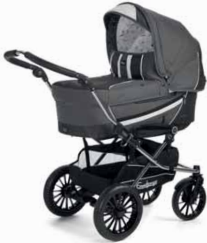
Edge 17480 Duo S Chrome/Leatherette