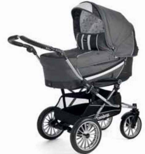
Edge 17483 Duo S Cryptonite