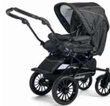
27403 Denim Black