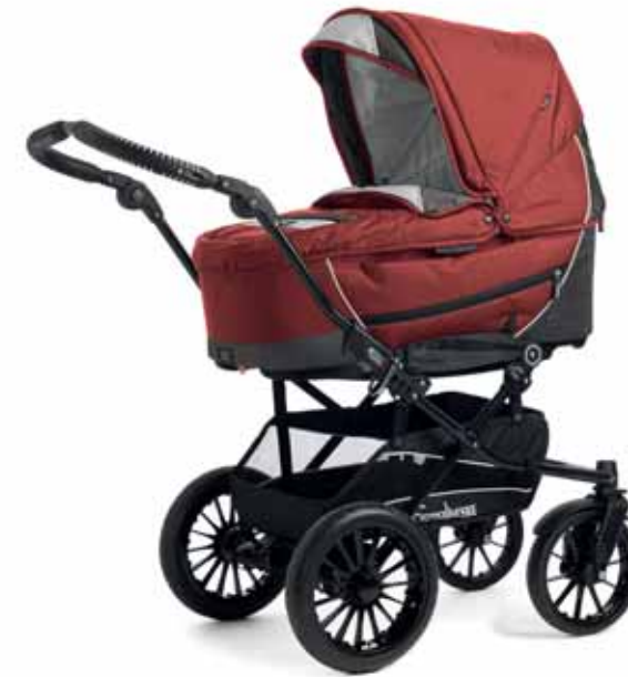
Super Nitro Terracotta 26420 City Koppa Supremella