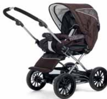
21407 Brown Flowers