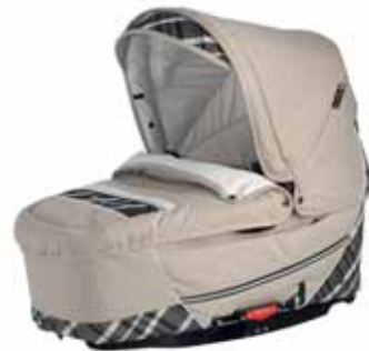
26410 Capri Creme