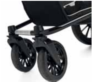
Kääntyvät etupyörät Nitro