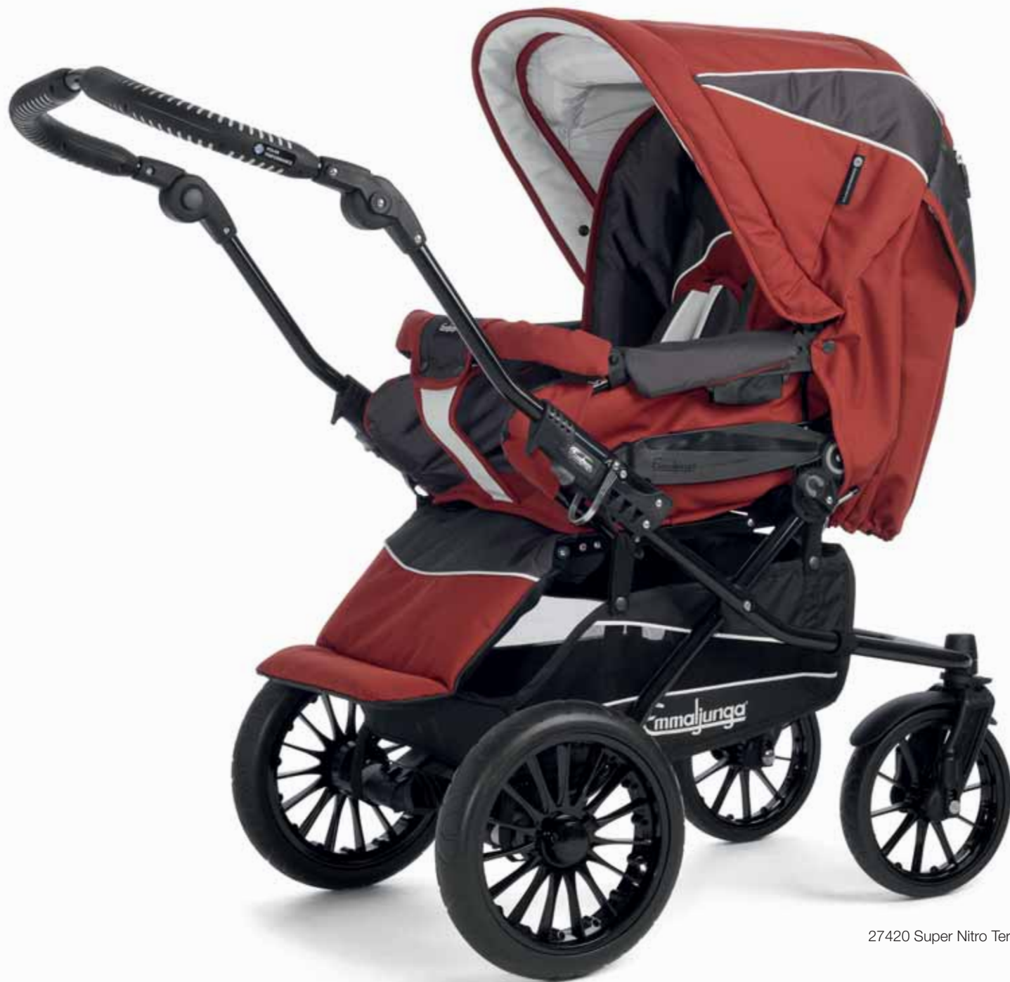
27420 Super Nitro Terracotta