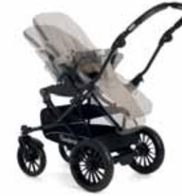
Selkänöjä sääty makuuasentoon