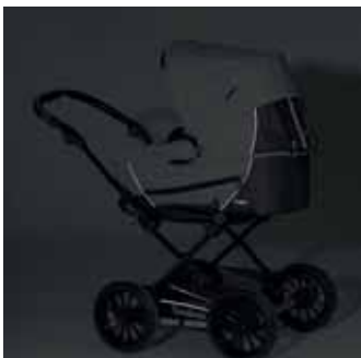
Vaunun kankaissa heijastimet turvalliseen liikkumiseen hämärässä ja pimeässä