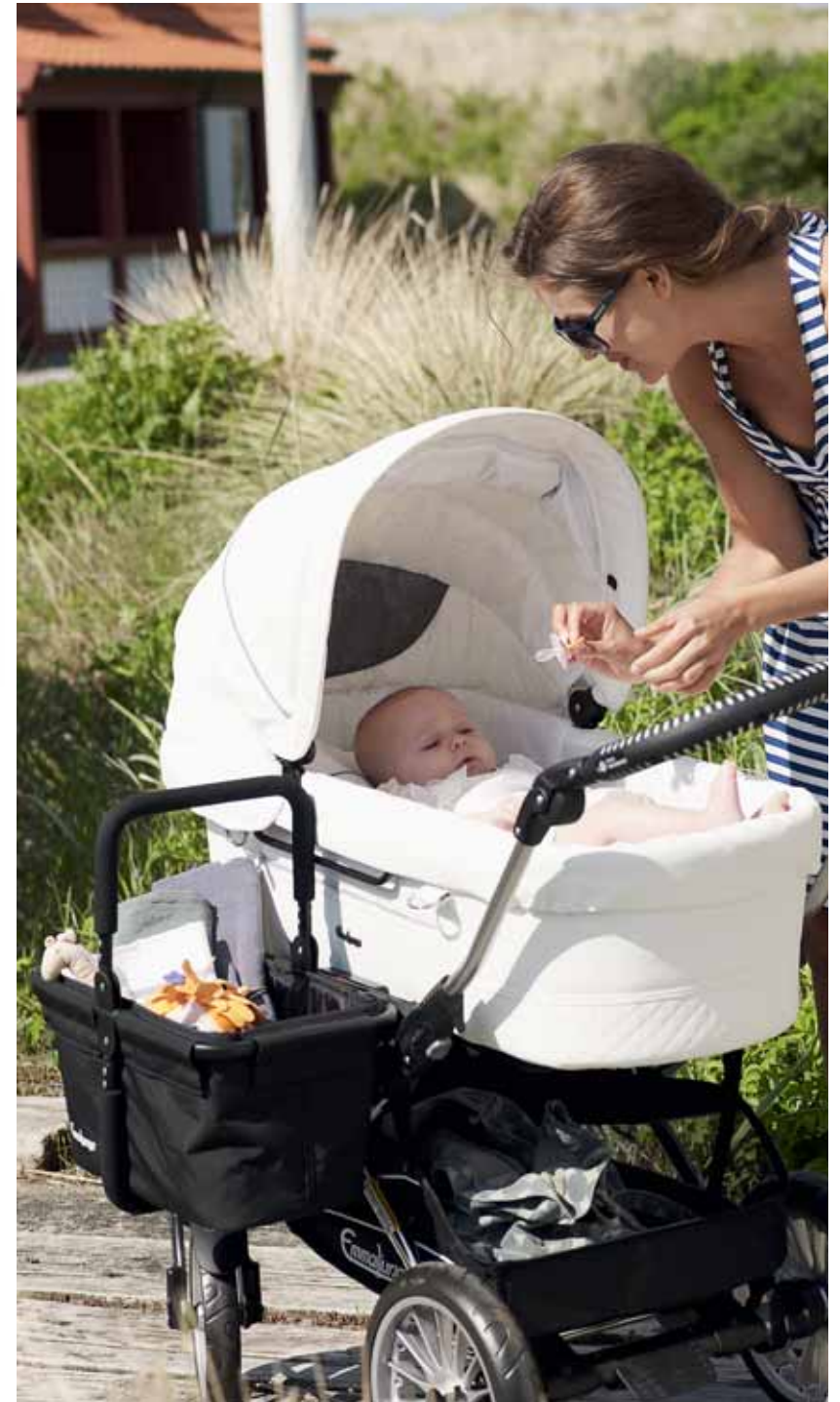
Mondial Duo Combi + Sidebag

Sisältää kaiken tarvitsemasi ihastuttavaan petaukseen: Pehmeä täkki (80x80 cm) Pehmeä tyyny (35x40 cm) Tyynyliina (35x40 cm) Pussilakana brodeerauksilla (80x80) Lakana (105x60 cm)