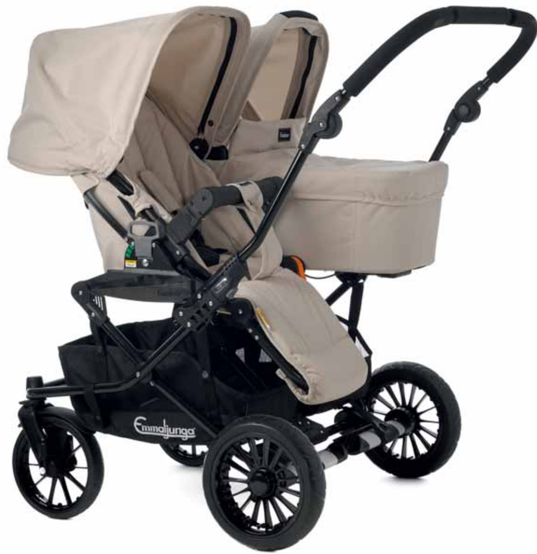
29427 Viking istuinosa Khaki | 34427 Viking kori Khaki | 31400 Double Viking runko Black