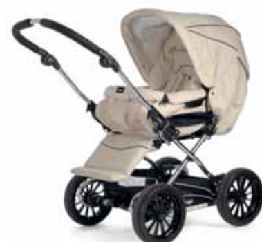
21417 Vanilla Leatherette