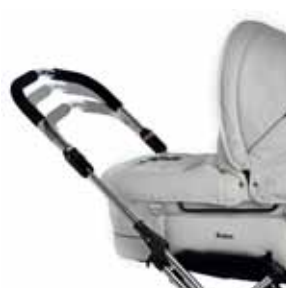
Teleskooppisäätö Sport Runko