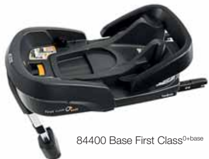
84400 Base First Class 0+base