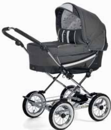
Edge 17490 Classic Chrome/Leatherette