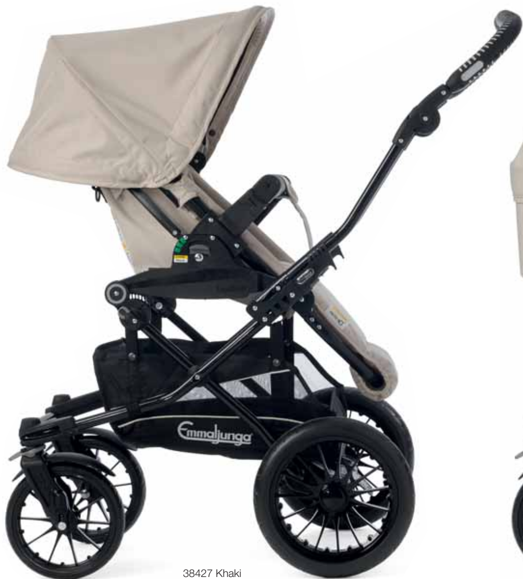
38427 Khaki Super Viking istuinosa