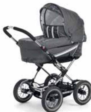
12408 Grey Leaves