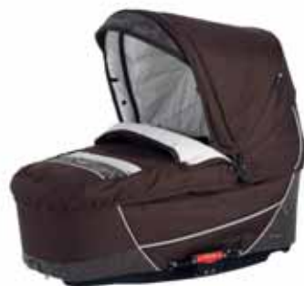
26407 Brown Flowers