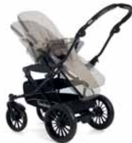
Sportsvognsdel med justerbar sitte-/liggeposisjon