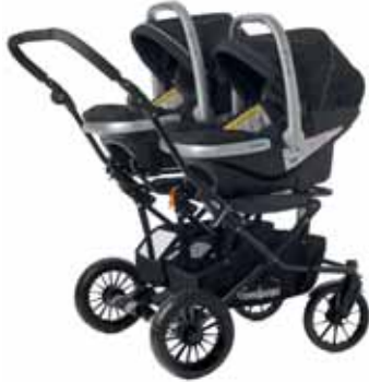
79400 Double Viking turvaistuinadapteri First Class 0+BASE turvaistuinadapteri toiselle kaukalolle