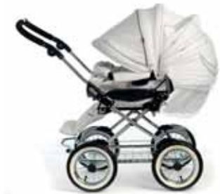
Eteen vedettävä kuomu suojaa auringolta ja tuulelta