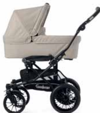
SUPER VIKING 42