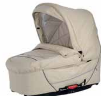
26417 Vanilla Leatherette