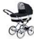
Mondial de Luxe