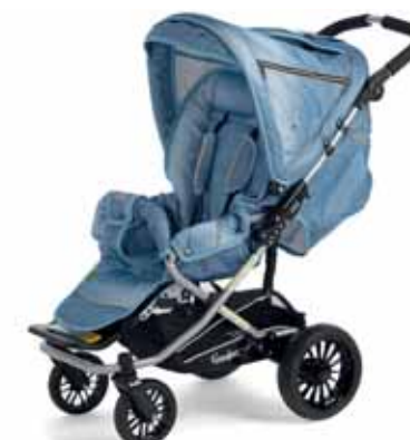
SCOOTER S | SCOOTER 2.0 54

Kiitokset: Lexington/Copenhagen, Kaufmann/Copenhagen Ruths Hotel/Skagen Tuotanto: Graphoteket AB, www.graphoteket.se Kuvat: Sven Persson, www.swelo.se Linda Suhr, www.suhrproduction.com Paino: Color Print, Denmark