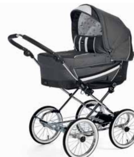
Edge 17496 De Luxe Chrome/Leatherette