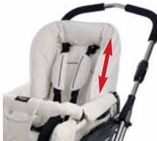
Stretch-komfort 5-pistevaljaat, joiden korkeus on säädettävissä