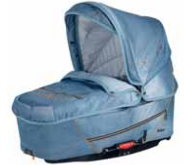
26404 Denim Blue