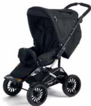
37402 All Black