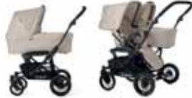
Viking / Double Viking