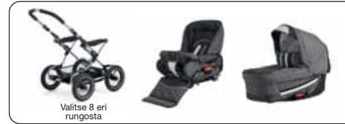
Valitse 8 eri rungosta