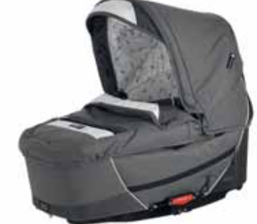
26424 Dark Grey