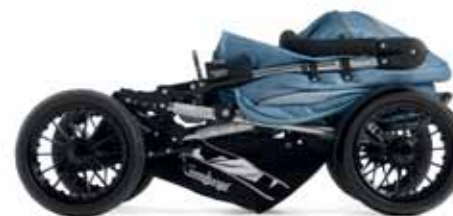
Scooter 2.0 kasaan taitettuna