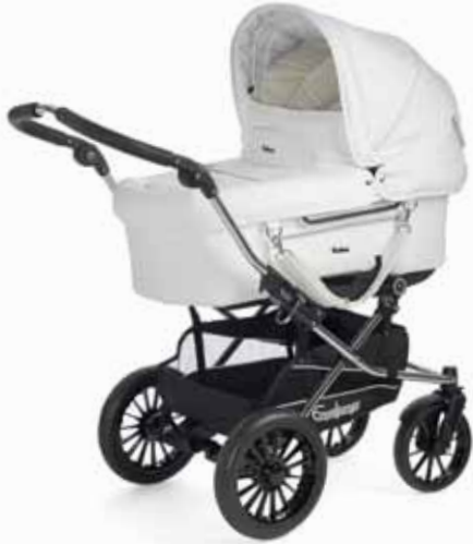
Mondial 17480 Duo S Chrome/Leatherette