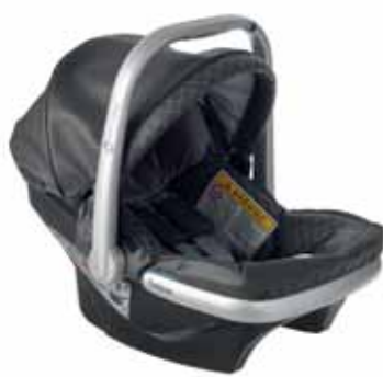
88415 Anthrazit Leatherette