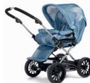
21404 Denim Blue