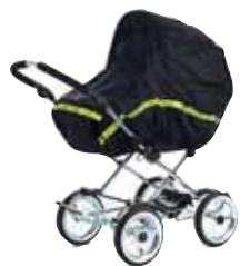
85400 Sadesuoja nylon

UV-suoja 50+. Kätevä aurinkoisia päiviä varten. Päivänvarjon kiinnitys runkoon ja sen poistaminen käy helposti. Päivänvarjomme ovat tavallisesti kaksivärisiä ja yhteensopivia vaunusi kanssa. Päivänvarjot iloisissa Viking-väreissä (Black, White Leatherette, Apple, Red, Blue, Light Grey, Khaki, Yellow, Pink) ovat kuitenkin yksivärisiä ja sopivat kaikkiin vaunuihin. Katso kaikki päivänvarjot osoitteessa www.emmaljunga.se