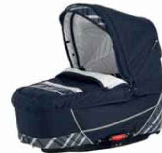
26412 Capri Navy