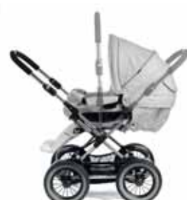
Käännettävä työntöaisa Sport Runko