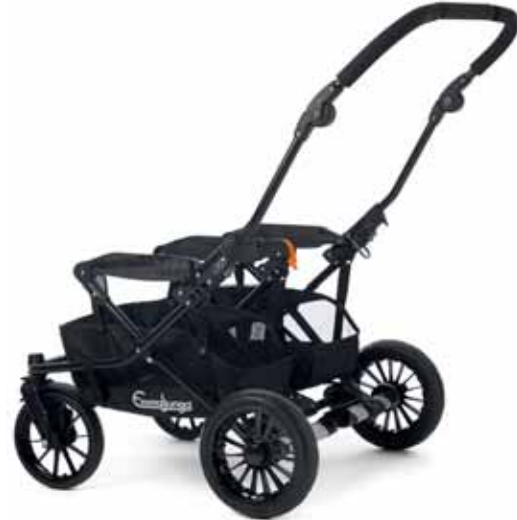
Double Viking Runko 31400 Black