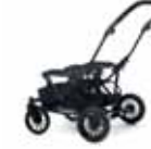
Double Viking runko kaksosille/sisaruksille