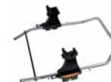
86400 Carseat Adapter Maxi Cosi Pebble/CabrioFix