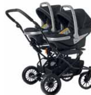
2 x First Class 0+BASE