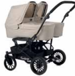
2 x Vaunukoppa

Mikäli haluat lisätä vaunuusi hieman väriä, voit täydentää sitä värikkäillä kuomun kangasosilla. Miksei vaikka eriväriset kuomut niin että kummallakin lapsella on oma värinsä? Jos taas tarvitset lisää säilytystilaa, voit ostaa lisävarusteena kannettavan ostoskorin jonka voi kiinnittää kätevästi yhdellä kädenliikkeellä vaunun runkoon.