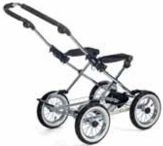
8 eri runkovaihtoehtoa