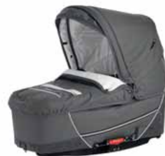
26408 Grey Leaves