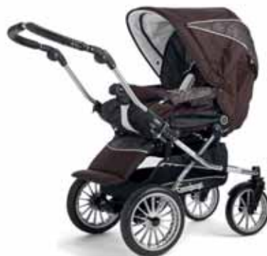
27407 Brown Flowers