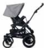
50425 Light Grey