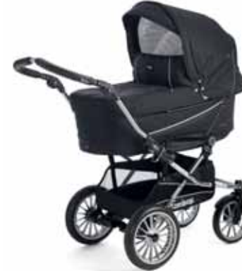
12413 Black Graffiti