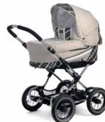
12410 Capri Creme