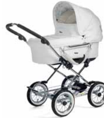
Mondial 11416 White Leatherette