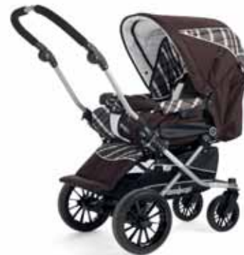
25411 Capri Brown