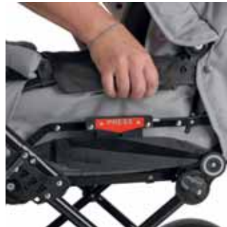
Easy FixTM Automaattinen lisäosan lukitusmekanismi, joka helpottaa lisäosan sekä Travel Systemin kiinnitystä ja irrotusta rungosta