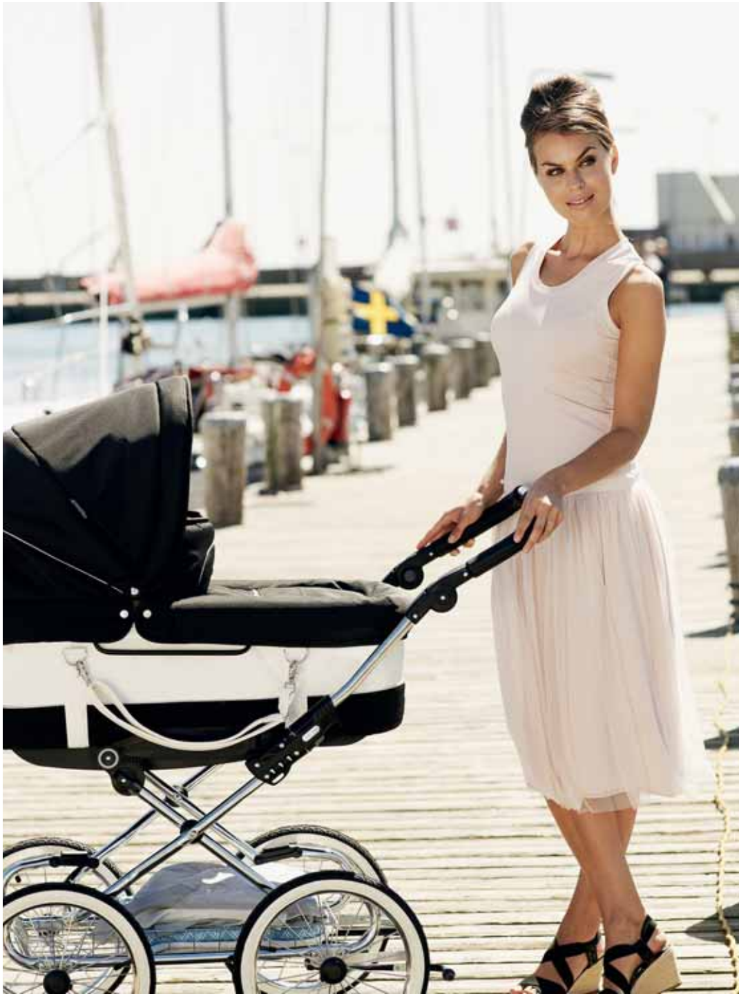
Mondial de Luxe London