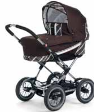
12411 Capri Brown