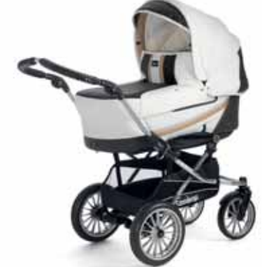
12414 Nougat Leatherette