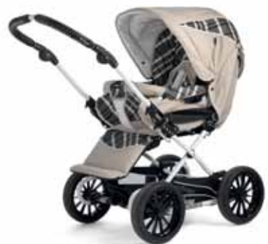
21410 Capri Creme