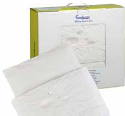
64453 White Dots