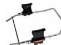
87400 Carseat Adapter Britax Baby Safe plus SHR

Travel System -adapterin avulla voit kiinnittää First Class 0+BASE -turvaistui- men Emmaljunga-vaunuusi. Adapterin voi asentaa vaunun rungolle kahteen eri asentoon joista toinen jättää istuimen kaltevampaan asentoon ja toinen enemmän istuvaan asentoon.