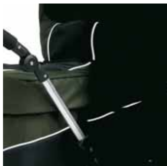
Heijastavat terenauhat parantavat turvallisuutta hämärässä ja pimeässä (ei Mondial de Luxe)