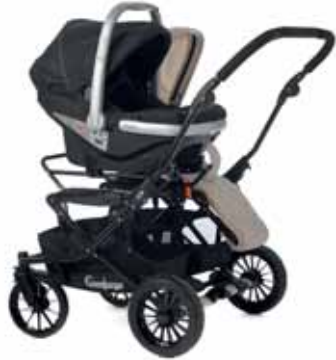
78400 Viking Carseat Adapter First Class 0+BASE