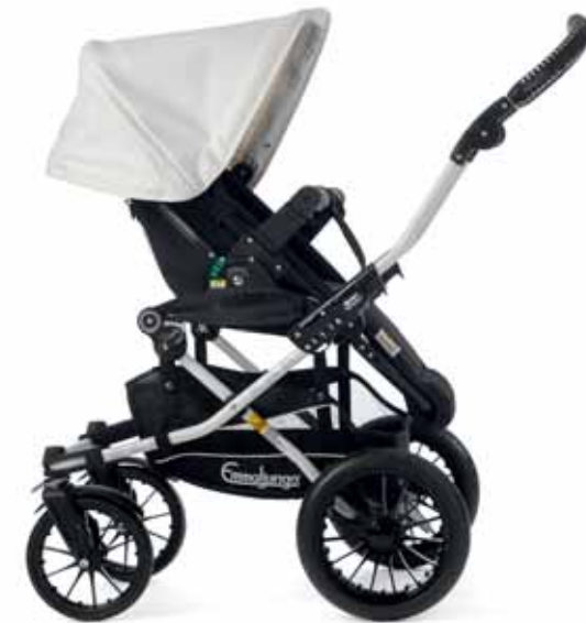
38402 Super Viking istuinosa Black 50416 White Leatherette Kuomun kangasosa