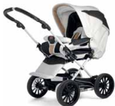
21414 Nougat Leatherette