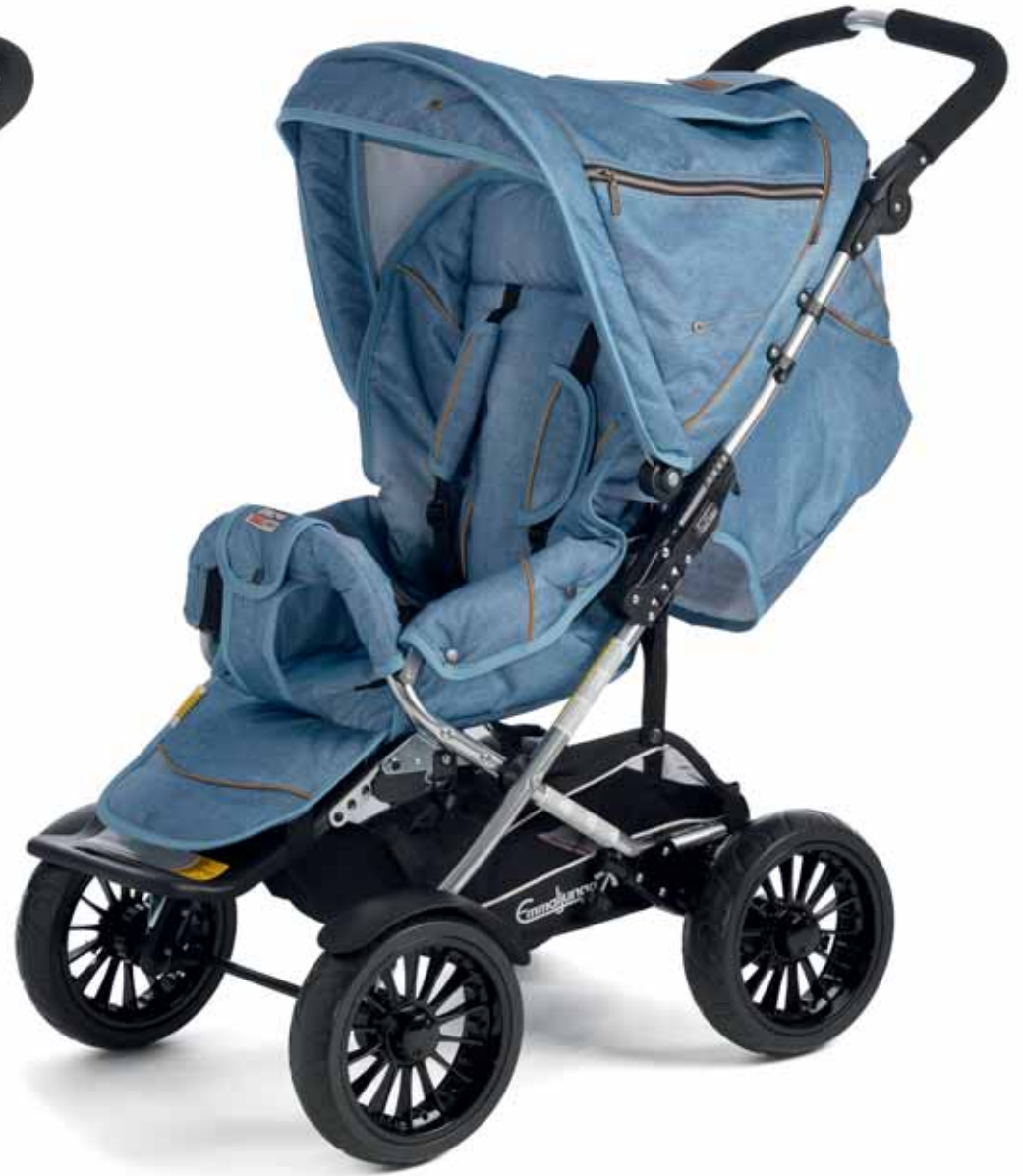
37404 Scooter 2.0 Denim Blue