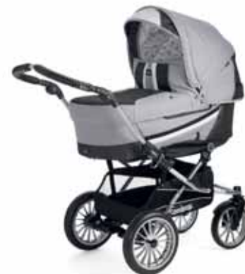
12425 Light Grey