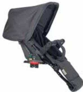
29424 Dark Grey