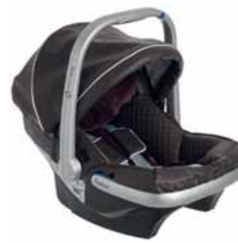
88418 Espresso Leatherette