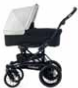
54416 White Leatherette