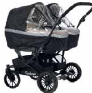
Lisävarusteet: Sadesuoja Exclusive