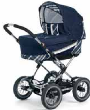
12412 Capri Navy