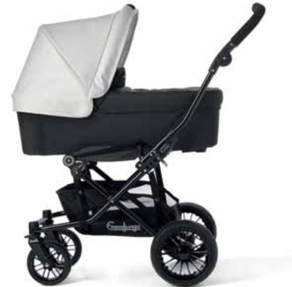
34402 Viking Koppa Black 54416 White Leatherette kuomun kangasosa