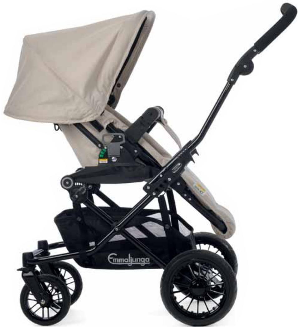
29427 Viking istuinosa Khaki | 33400 Runko Viking Black