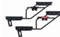
75400 Go Double Adapterit joiden avulla Super Viking soveltuu myös sisaruksille