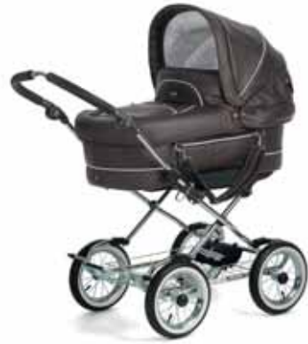
Mondial 11418 Espresso Leatherette