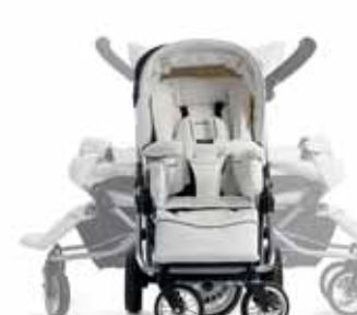
Kääntyvät etupyörät Duo S Runko