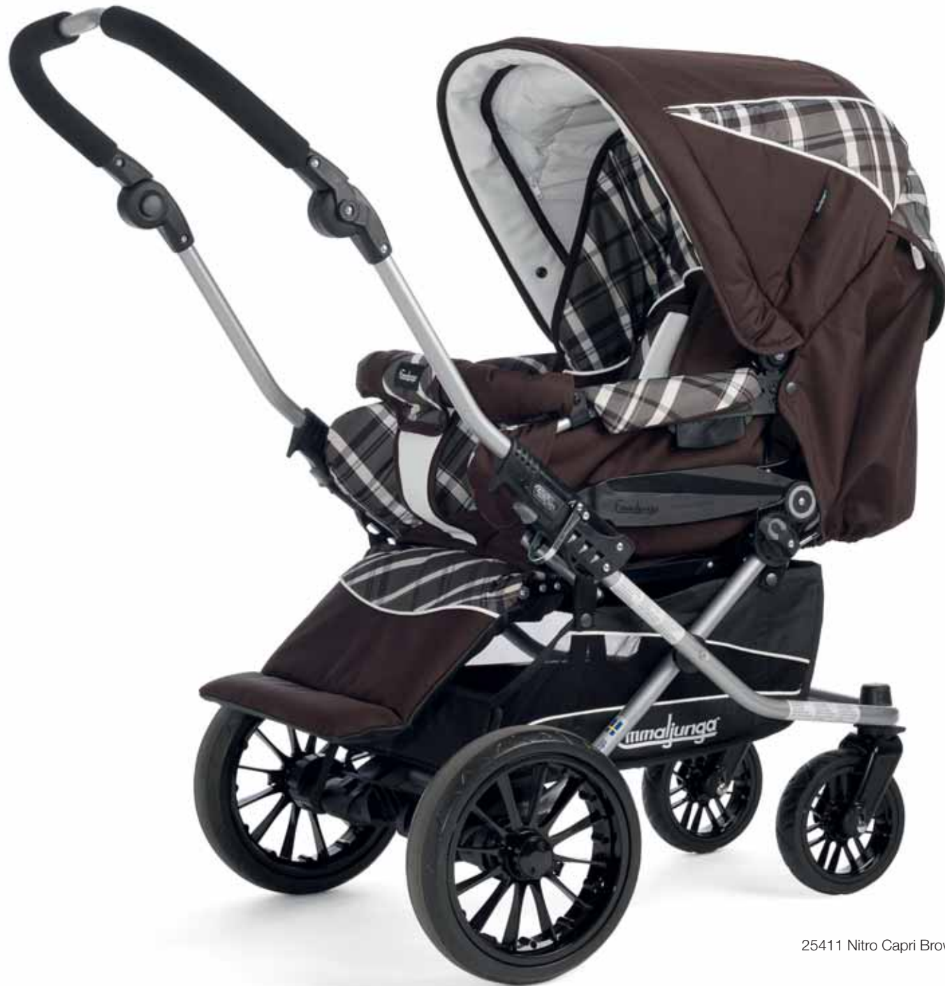
25411 Nitro Capri Brown