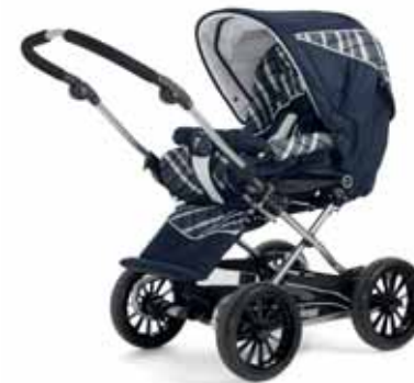
21412 Capri Navy