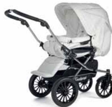
27416 White Leatherette