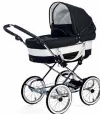
Mondial de Luxe 18432 London

Kuvissa vaunut eri runkovaihtoehtojen kanssa. Voit valita haluamasi rungon.