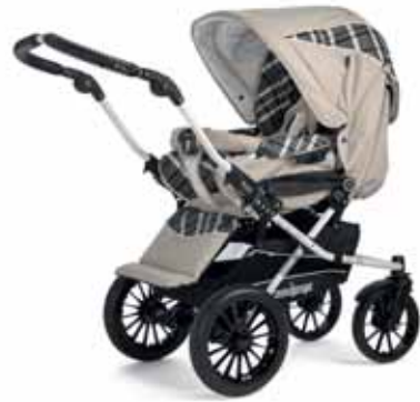
27410 Capri Creme