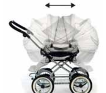
Käännettävä istuinosia lapsen kulku- suunnan vaihtamiseksi.