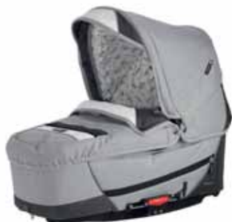
26425 Light Grey