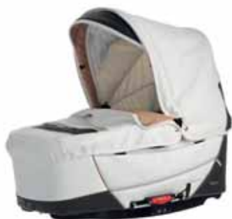
26414 Nougat Leatherette