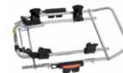
82400 Carseat Adapter Emmaljunga First Class 0+BASE