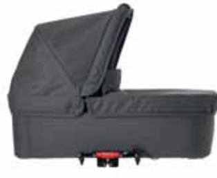
24424 Dark Grey