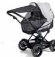
Integroitu hyttysverkko & Ulosvedettävä aurinkosuoja