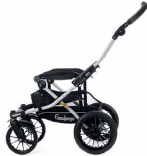
Super Viking Runko 13400 White