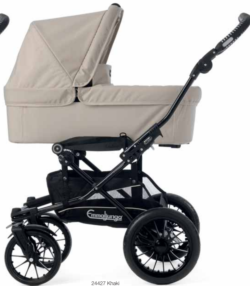
24427 Khaki Super Viking koppa