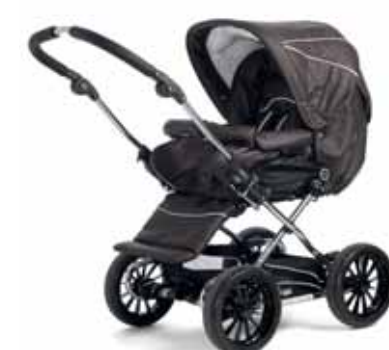
21418 Espresso Leatherette