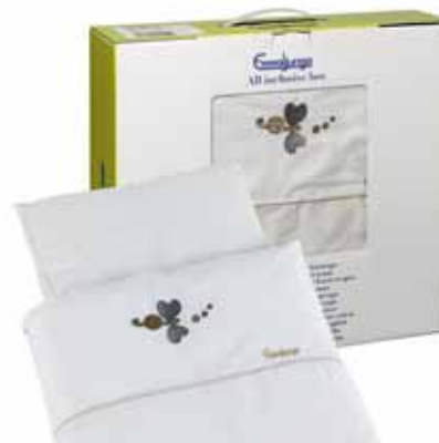
64454 Beige Dots