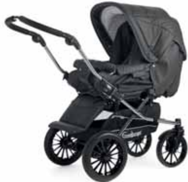
27415 Anthrazit Leatherette