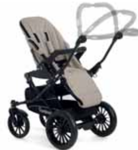
Säädettävä työntöaisa jonka voi myös taittaa alas