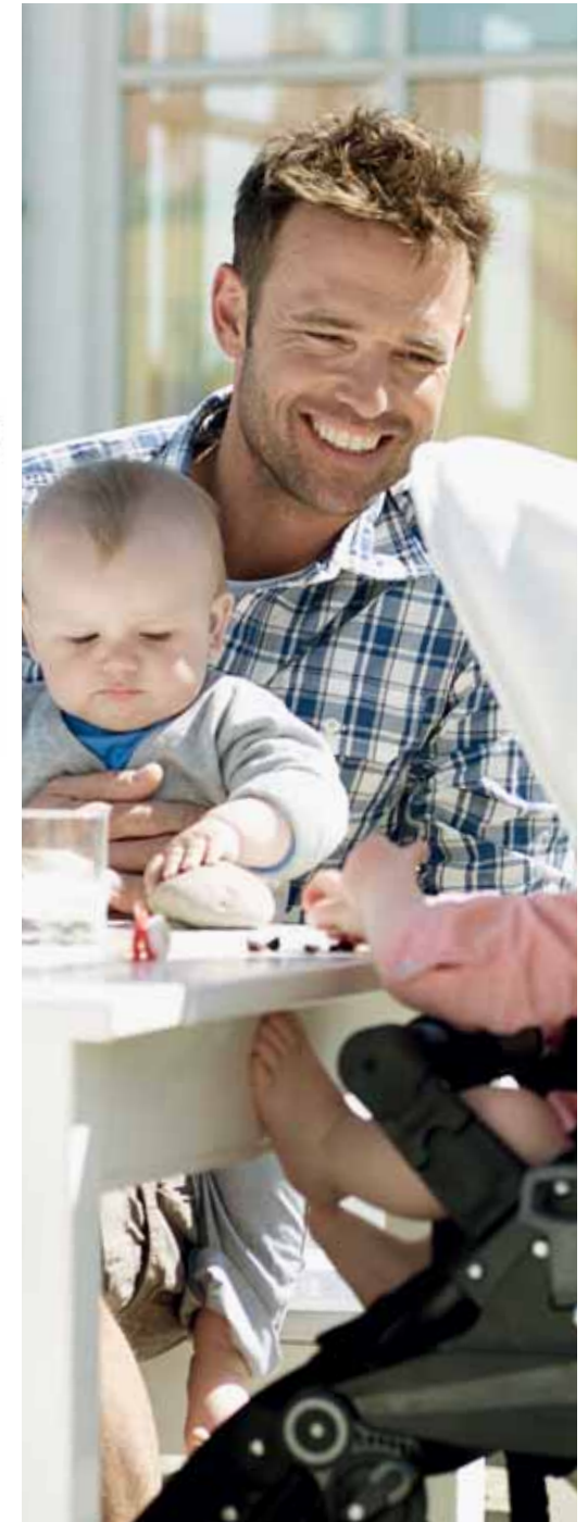
Oikealla korkeudella pöytään nähden - tuoli kulkee aina mukana.