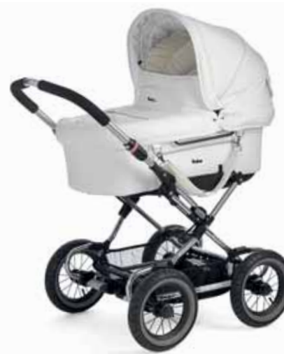
Mondial 17492 Sport Cryptonite