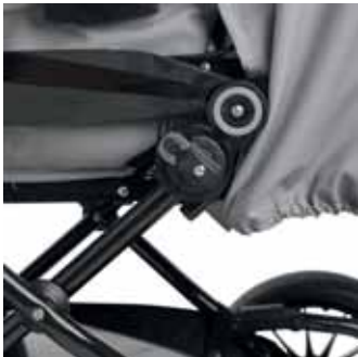
E.A.S.TTM säädettävä jousitus/kallistus