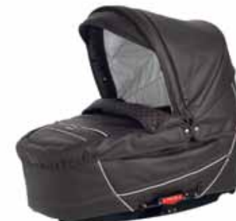
26418 Espresso Leatherette