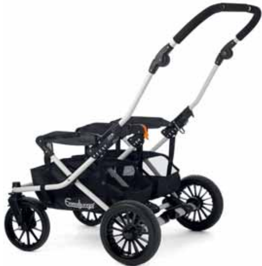
Double Viking Runko 30400 White