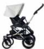
50416 White Leatherette