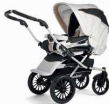
27414 Nougat Leatherette