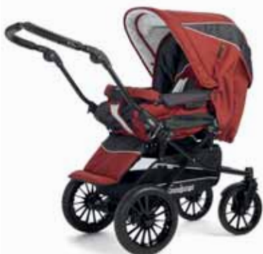
SUPER NITRO 32