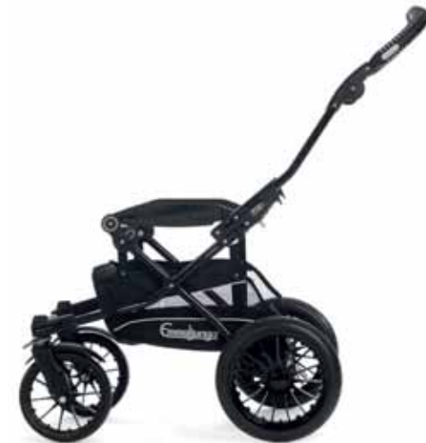
Super Viking Runko 14400 Black