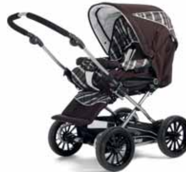
21411 Capri Brown