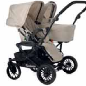
Sittdel + Vaunukoppa