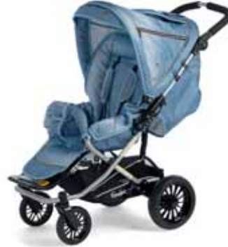
35404 Denim Blue