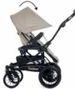
Eteen vedettävä kuomu (aurinkosuoja)