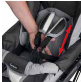
5-piste Stretch comfort valjaat