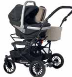
First Class 0+BASE + korg