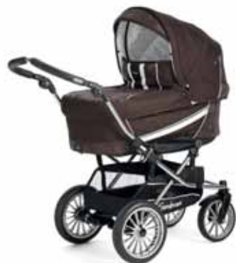
12407 Brown Flowers