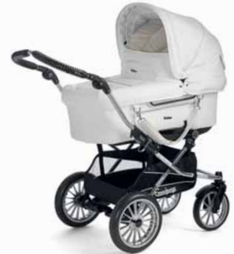
Mondial 17483 Duo S Cryptonite