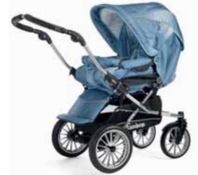
27404 Denim Blue