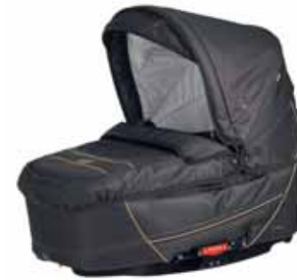
26403 Denim Black