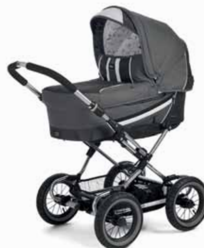
Edge 17492 Sport Cryptonite