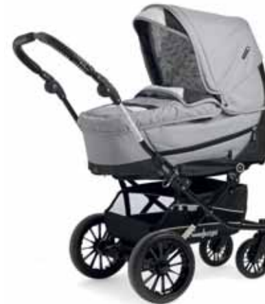
City Koppa Supreme Nitro rungolla