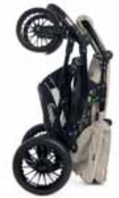
Pystyasento kasattuna, mahtuu 60 cm syvään kaappiin