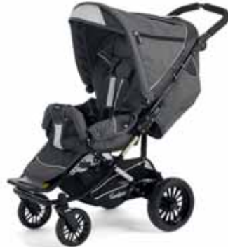
35424 Dark Grey