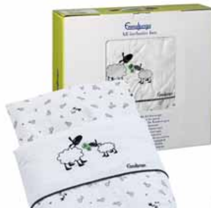
64451 Happy Sheep