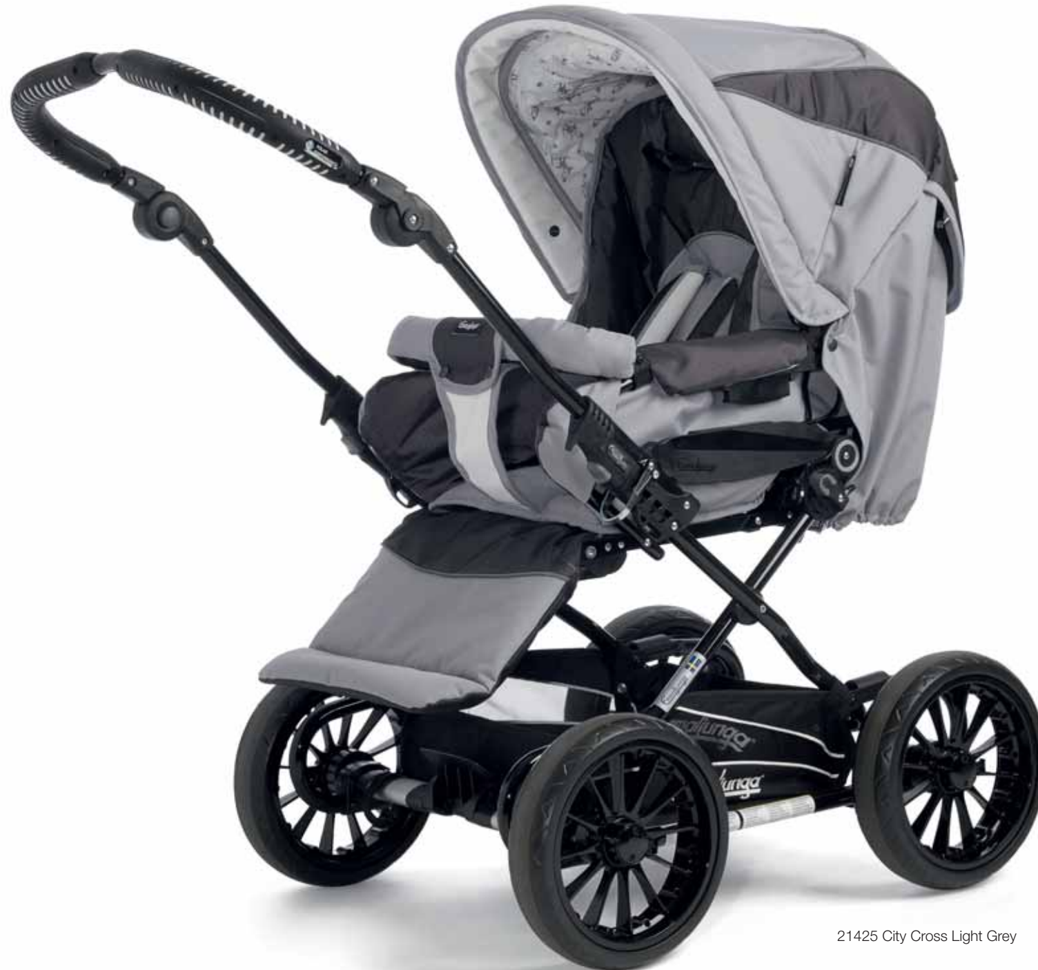
21425 City Cross Light Grey