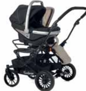
First Class 0+BASE + Istuinosa