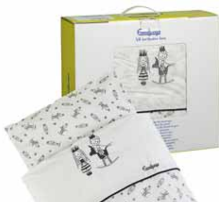
64456 Prince & Princess