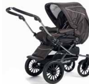
27418 Espresso Leatherette