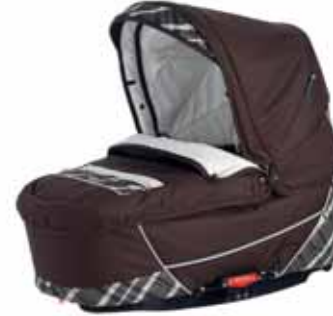
26411 Capri Brown