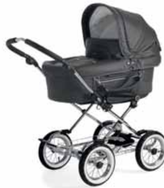
Mondial 11415 Anthrazit Leatherette