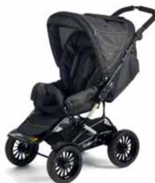
37403 Denim Black