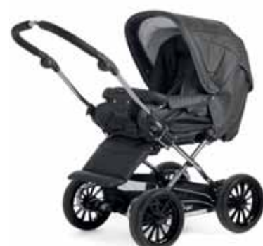
21415 Anthrazit Leatherette