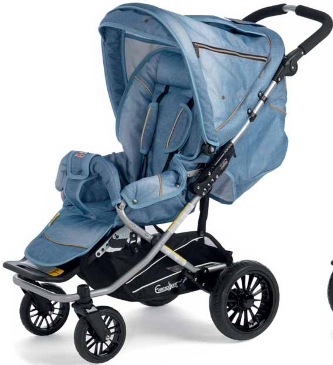
35404 Scooter S Denim Blue