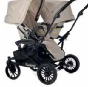
2 x Istuinosa