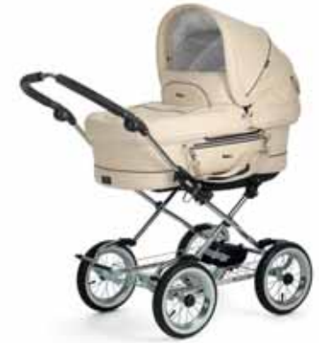
Mondial 11417 Vanilla Leatherette