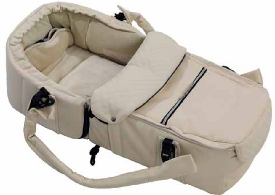
63417 Quadrolift Vanilla Leatherette