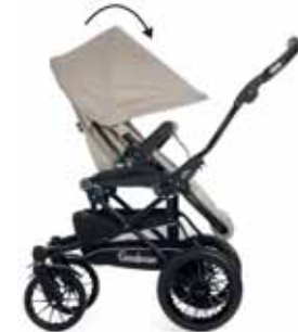
Eteen vedettävä kuomu (aurinkosuoja)