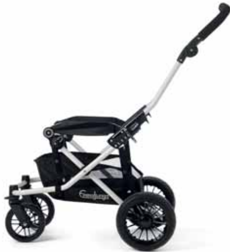
Viking Runko 32400 White