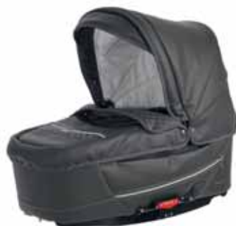
26415 Anthrazit Leatherette