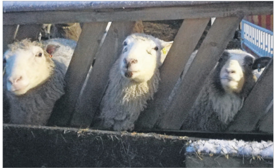
Mulikassa on uteliaita lampaita.