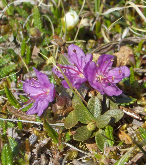
Lapinalppiruusu kukkii, kuvattu Saanalla 2013

Lapinalppiruusu ( Rhododendron lapponicum ) on harvinainen Suomessa, sillä on vain pari kasvupaikkaa Käsivarren Lapissa, Utsjoelta laji lienee kadonnut. Aivan pohjoisimmassa Käsivarressa sitä tavataan kolmella tunturilla joista Saanalla se on helpoiten löydettävissä. Mallan luonnonpuistossa sitä pitäisi myös kasvaa, mutta kulkeminen on sallittu ainoastaan polkureitillä kolmen valtakunnan rajalle, ja tuon polun varressa sitä ei kasva.