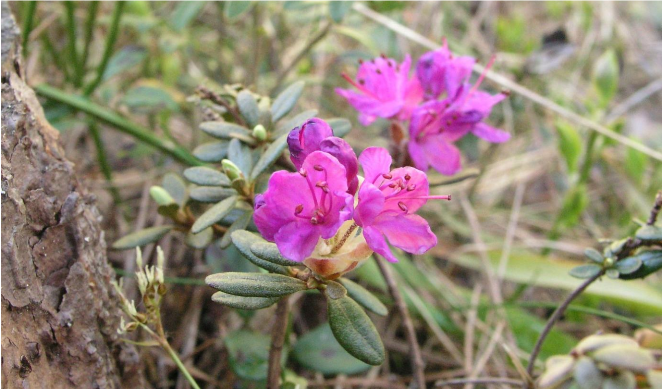
R. lapponicum New Foundland