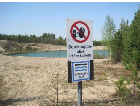
Kuva 42. Ristiriistaista maankäyttöä soranotto- ja pohjavesivaranto

Syrjäharju on pääosin ollut soranottoalueena, vaikka sijaitsee tärkeällä I luokan pohjavesialueella . Sorakuoppa on maisemavaurio ja sen keskellä on ilmeisesti pohjaveteen asti ulottuva lampi. Lammen rannoilta löytyi pesivä rantasipi.