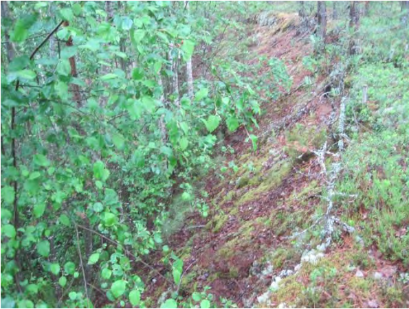
Kuva 103. Kärmevuoren pensaikkaa kasvava sorakuoppa