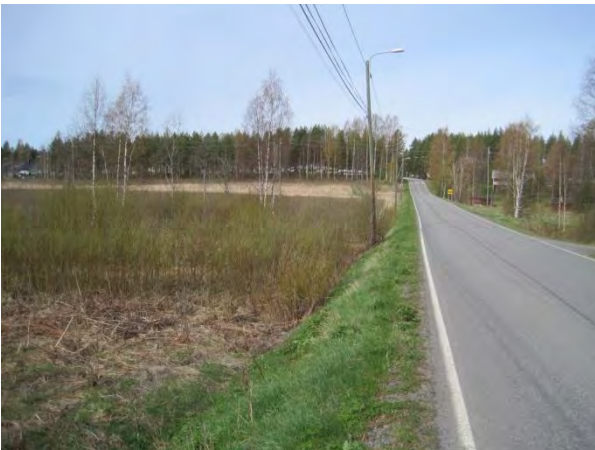
Kuva 47. Paikkalankangas ja Varikontie kirkonkylän suuntaan

Paikkalankankaan pellot ovat osin viljelyssä ja osin kesantona. Paikoin pellon oja on kaivettu ja metsikköjen reunoilla näkyi maa-aineskasoja. Pellolla oli pariskunta kurkia Grus grus 15.5.2014. Karvalin ja Koivulehdon välinen metsä on reheväkasvuista ja useampi puulajista. Sieltä löytyy niin vanhempaa kuusikkoa, nuorta haapaa, koivikkoa, harmaalepikkoa kuin istutettua mäntyäkin. Osa metsistä on entisiä peltoja, joissa pensaskasvillisuutena on paikoin runsas vadelma. Metsien aluskasvillisuus on vaihtelevaa ja rehevää: kataja, ahomansikka, metsäimarre, metsäkorte, käenkaali, nokkonen Urtica dioica , metsäälvejuuri, sudenmarja, oravanmarja, puna-ailakki Silene dioica , herukka, vadelma ja heinistä mainittakoon yleinen metsäkastikka.