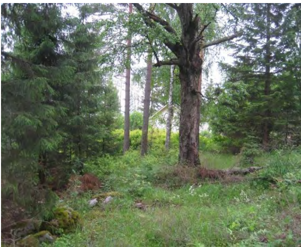
Kuva 69. Liito-oravan vakituinen levähdys- ellei peräti pesimäpuu

Ahokkaan ympäristössä on liito-oravareviiri (liito5) . Joutolantien perinnetilan (Kotikumpu?) kasvaa pihassa komeita kuusia ja pökölöityvä koivu, jonka juurelta löytyi liito-oravan papanoita vielä heinäkuun alussa (2.7.2014)(Kuva 69.). Ympäriä oli kaadettu isoja puita. Papanoita oli sen verran runsaasti, että se viittaa pesintään koivupökölössä. Tien toisella puolella sekametsäsaarekkeessa papanoita löytyi lähinnä suurten kuusien juurelta myös aivan talojen tonttien nurkilta. Asuintalojen pihaja ei tutkittu. Tämän metsäsaarekkeen kasvillisuuteen kuuluvat arvokkaimpina näsiä Daphne mezereum ja kevätlinnunherne.