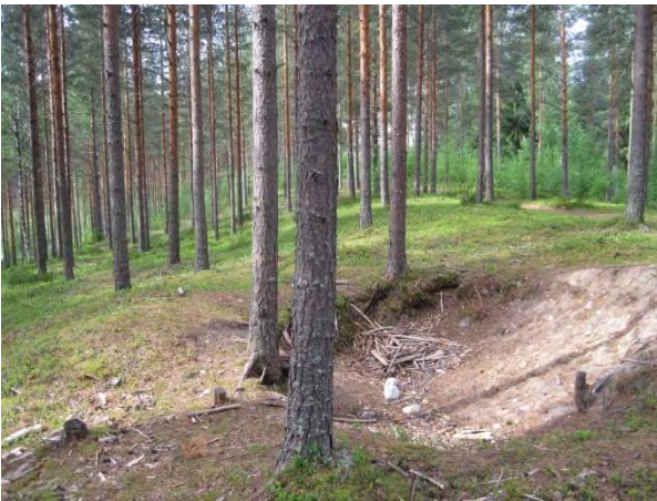
Kuva 43. Kuluneisuutta Syrjäharjulla

Toivakan kirkko ja hautausmaa sijaitsevat Syrjäharjun ehjän osan päällä. Samaisella harjukannaksella on koulu, terveystalo, kunnantalo ja lähes koko Toivakan kirkonkylän keskustaajama. Kirkon länsi- ja itäpuolella rinteet ovat puolukka-mustikkatyypin männikköä, jossa on havaittavissa kulkemisesta johtuvaa kulumista. Pihojen vaikutus lajistossa näkyy rehevöitymisellä ja vieraslajeina. Tienpientareilla ja pihojen laidoilla on pienialaisia niittyjä ja ketoja, joissa kasvaa muun muassa kataja, niittynätkelmä Lathyrus pratensis , kielo, puna-ailakki Silene dioica , hietakastikka Calamagrostis epigejos ja yleisiä heiniä. Polkujen varsissa kasvaa komealupiinia Lupinus polyphyllus , vadelmaa ja maitohorsmaa. Syrjäharjun soranottoalueen eteläpuolista männikköä on myös harvennettu.