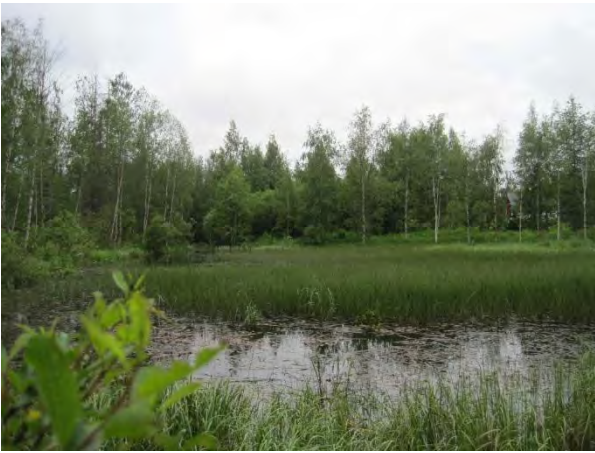
Kuva 87. Kakaravaaran asuntoalueen lampi

Vanhan pappilan puro laskee asuntoalueen keskellä olevaan pieneen lampeen, josta puro jatkaa matkaansa Malviharjun kautta Pohjoonlahteen . Lampi näyttää tulvivan aika ajoin. Tästä on merkinä kuolleita kuusia. Lammen rannalla kasvaa rahkasammalta ja rehevää kasvillisuutta: korpi-imarre, kiiltopaju, vehka, ratamosarpio, mesiangervo, suo-orvokki, metsäruusu, niittyleinikki, rantamatara, korpikaisla, pitkäpääsara, pullosara ja valkopiirtoheinä Rhynchospora alba . Vedessä kasvaa saroja, järvikorte ja vesikuusi Hippuris vulgaris . Kesäkuun lopussa lammella uiskenteli telkkä kahden poikasen kanssa.