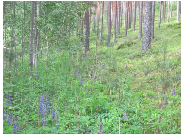
Kuva 44. Vieraslaji komealupiini valloittamassa kirkonmäen rinteitä

Kirkkola-tilan ympärillä on laaja jo varttunut istutuskoivikko, jossa keskellä isohko ulkorakennus. Kasvillisuus on rehevää ja osin vielä niittykasvillisuutta muun muassa heiniä, vadelmaa, maitohorsmaa, voikukkaa, päivänkakkaraa, poimulehtiä, metsäkurjenpolviä ja herukkaa. Koivikossa tavattiin muun muassa sirittäjä-poikue.