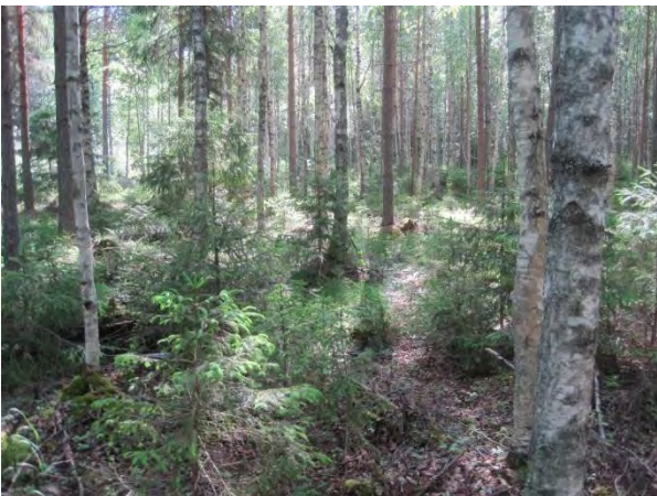
Kuva 24. Pikkusieppometsä