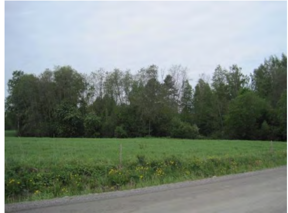
Kuva 17. Mustalammen puron varsi ja Saarisen rantalepikkoa