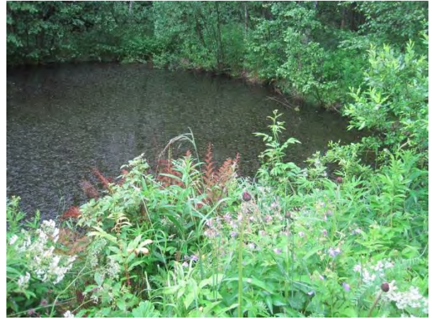
Kuva 54. Isonäkinsammallammikko

Kouvolanojan, Koivulehdon ja Karvalin seudun metsissä ei havaittu merkkejä liito-oravasta toukokuussa 2014. Aivan pihapiirejä ei tutkittu.