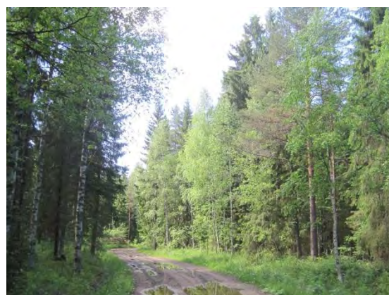
Kuva 31. Myllykankaantien varren metsää