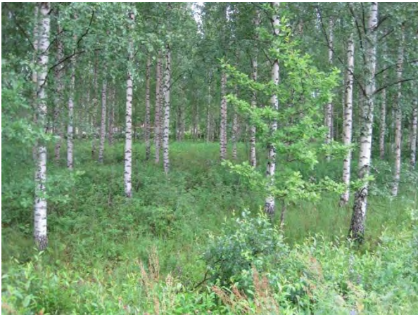
Kuva 85. Pölkin koivikkoa

Metsänhoitoyhdistyksen talon ympärillä on isoja kuusia ja lehtomaista metsän pohjaa. Kuusten juurella oli liito-oravan papanoita 2.7.2014 (osa liito5 ). Reviiri on yhteydessä Ahokkaan liito-oravaesiintymään.