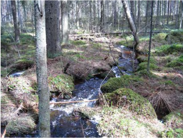
Kuva 51. Kouvolanoja

Etelämpänä yläjuoksulla Paloisientien varressa Kouvolanoja virtaa vanhemman kuusikon sisällä koskimaisesti (paras osa jää tästä kaavasta ulos) ja välillä tiheään taimikon sisällä sekä ennen peltoja myös uuden hakkuun laidassa. Tällä osin kasvillisuudesta mainittakoon Kouvolanojan varresta lehtomaisuuden ilmentäjä kotkasiipi Matteuccia struthiopteris .