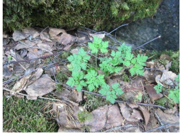
Kuva 126. Haisukurjenpolvi

Uutelassa löytyy kivikkoinen kallionaluslehto ja muutoinkin ”Baijerin laakson” metsärinteet ovat kivikkoisuudestaan lehtomaisia ja muistuttavat paljon Päijänteen rantoja. Kallionaluslehdosta löytyy paikallisesti edustavia kasveja : kivikkoalvejuuri Dryopteris filix-mas , isoalvejuuri Dryopteris expansa , lehtokuusama, lehto-orvokki, lehtomatara Galium trifolium , mustakonnanmarja Actaea spicata ja lehtopalsami Impatiens noli-tangere . (luo1)