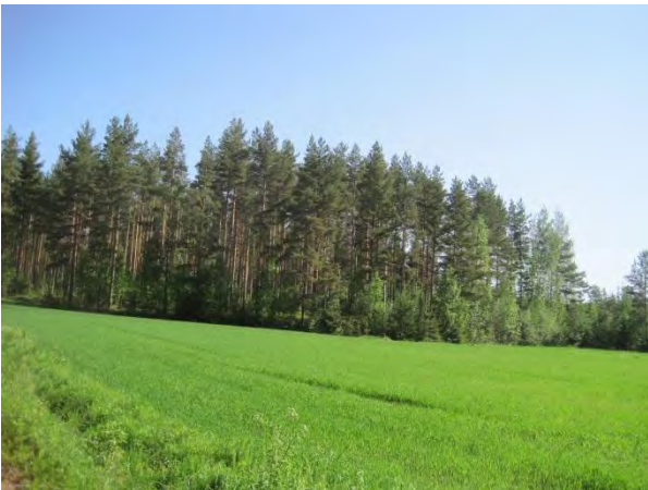
Kuva 79. Leppävedenrannan pelto ja männikkömaisemaa