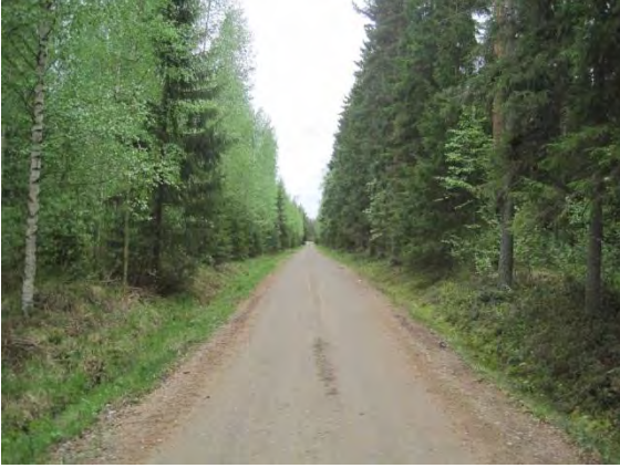
Kuva 6. Pirttiläntie