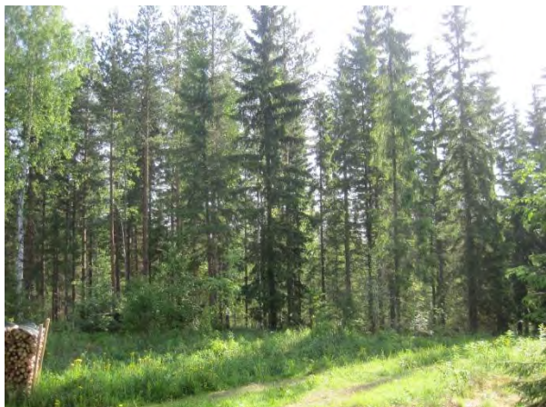
Kuva76. Raivionmäen itälaidan metsää