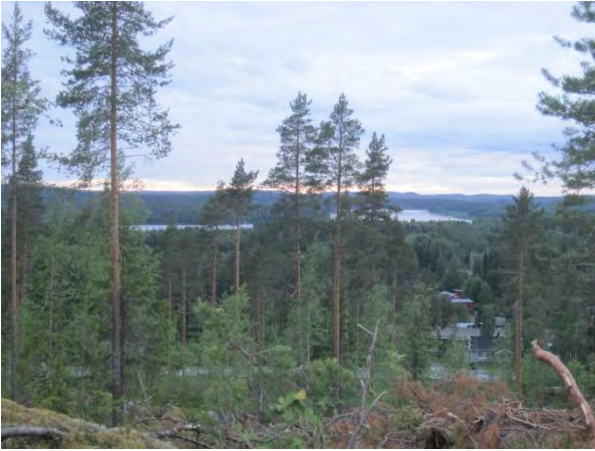
Kuva 99. Uusi hakkuu avaa Kiikarvuorelta näkymät Leppävedenrantaan.

Hakkuusta johtuen linnusto vuorella oli vähäinen: käpytikka, metsäkirvinen ja keltasirkku.