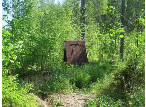
Kuva 82. Sikoviidan lähdekoppi