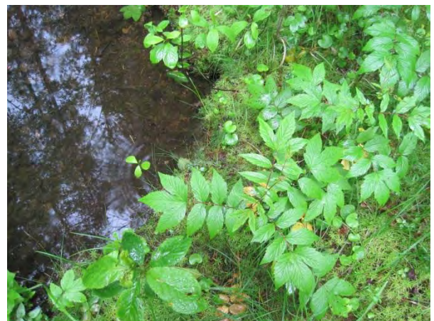
Kuva 102. Kärmevuoren lähde