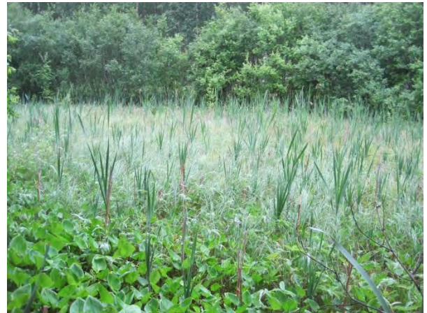
Kuva 86. Pölkin umpeenkasvanut lampi