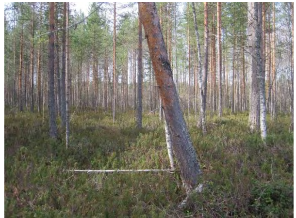
Kuva 48. Paikkalankankaan räme peltoalueen keskellä