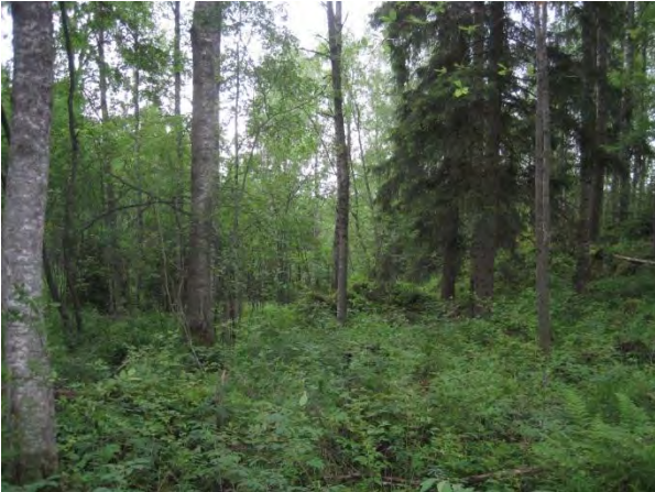
Kuva 127. Kivikkoista kallionaluslehtoa

Uutelassa löytyy kivikkoinen kallionaluslehto ja muutoinkin ”Baijerin laakson” metsärinteet ovat kivikkoisuudestaan lehtomaisia ja muistuttavat paljon Päijänteen rantoja. Kallionaluslehdosta löytyy paikallisesti edustavia kasveja : kivikkoalvejuuri Dryopteris filix-mas , isoalvejuuri Dryopteris expansa , lehtokuusama, lehto-orvokki, lehtomatara Galium trifolium , mustakonnanmarja Actaea spicata ja lehtopalsami Impatiens noli-tangere . (luo1)