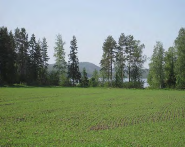
Kuva 77. Leppävedenrantaa