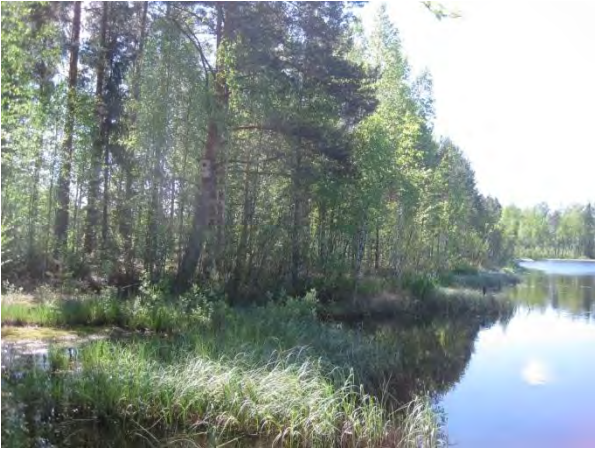
Kuva 13. Mustalammen itäranta etelään päin