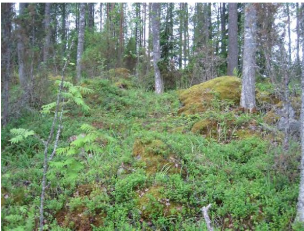
Kuva 119. Paasivuoren rinteitä Syrjälän seutuvilla

Paasivuoren etelärinteellä Niinistönahon ja Syrjälän tilojen ja peltojen välissä Paasivuori on louhikkoista metsää, joka kasvillisuudeltaan ja lähimaisemaltaan muistuttaa Päijänteen jyrkkiä ja louhikkoisia rantoja. Paasivuoren itärinteessä on kolme taloa, muun muassa Kaartee ja itälaidan Pohjoonlahden rantaan on rakennettu mökkejä. Sieltä löytyy rauhoitettu hiidenkirnu. Mökkien ja maantien välissä on pieni pelto, lehtipuustoa ja yksi kalliokumparekin. Niinistönahon ja Syrjälän metsissä kasvillisuudesta löytyy lehtokasveja: kevätlinnunherne, sudenmarja ja valkolehdokki . Alueella on aiemmin tavattu liito-oravaa , josta merkkejä löytyi myös kesän 2014 käynnillä (1.7.), vaikkakin eri kohdista kuusten ja haapojen juurelta ( liito13 ).