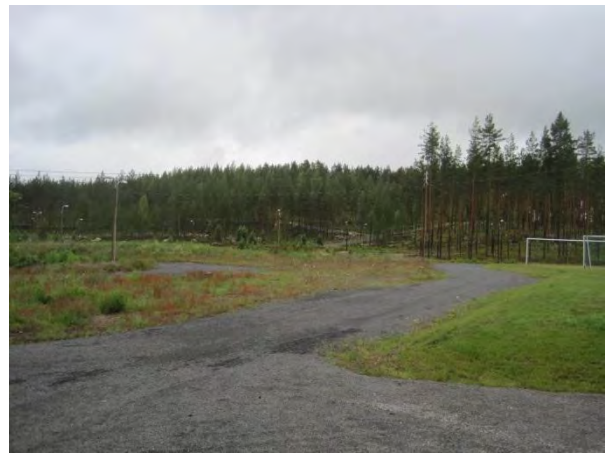
Kuva 98. Toivakan urheilupuisto ja taustalla Paikkalanvuori

Paikkalanvuoren ja Kiikarvuoren välissä kulkee monimuotoisuuden kannalta merkittävä nimetön puro Sankarisuolta (tämän kaavan ulkopuolella) Vanhan pappilan pohjoispuolitse Kakaravaaran läpi. Puro laskee Pohjoonlahteen. Puroa on kutsuttu tässä työssä Vanhan pappilan puroksi (luo1). Puro kulkee paikoin syvässä uomassa ja paikoin louhikossa. Vuorten välinen osuus puron varressa on enimmäkseen rehevää kuusikkoa, josta löytyy runsaita sanikkaiskasvustoja, haapaa ja hieman tervaleppää.