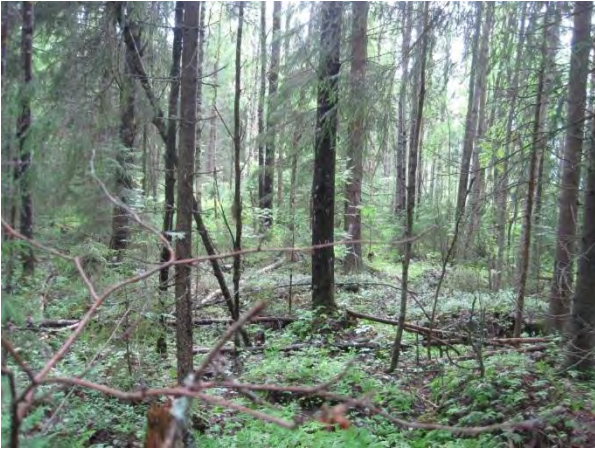
Kuva 22. Hamperinjoen itäpuolista metsää, kuusta