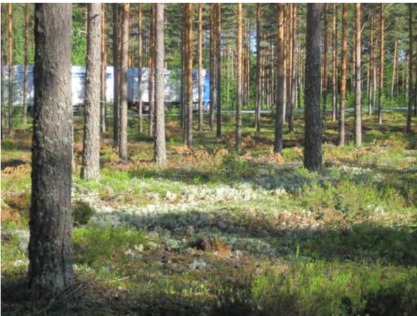
Kuva 8. Havulankangas ja rekka, Toivakan päätie (Huikontie maantie 618)

Soranottoalueen pohjoisosassa on pieni törmäpääsky-yhdyskunta (arviolta vain 5 paria, arvioitu havaittujen lintujen, ei kolojen perusteella) (Kartta: tö1). Törmäpääskykolonia tulisi ottaa huomioon tulevaa käyttöä ja maisemointia suunniteltaessa. Törmäpääsky Riparia riparia kuuluu nykyään uhanalaisluokituksen vaarantuneisiin (VU) lajeihin. Soramontuilla muita pesivinä havaittuja lajeja olivat yleiset kalalokki Larus canus , keltasirkku ja västäräkki Motacilla alba .