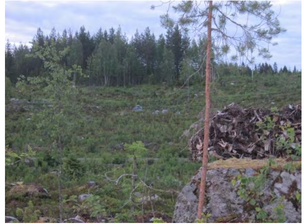
Kuva 100. Kiikarvuoren laajaa avointa taimikkoa

Kiikarvuoren lounaispuolella sijaitsee yhteiseen metsä- ja maisema-alueeseen kuuluva Kärmevuori , joka on pääosin puolukka- ja mustikkatyypin louhikkoista mäntykangasta. Pohjoispuolella on yksi asuintila ja metsittynyt soramonttu ja lähde. Avovetisen lähteen (metsälain kohde, luo1) ympärillä on pieni neva ja kapealti isovarpurämettä, jossa kasvaa harvakseltaan muun muassa mesiangervoa, kurjenjalkaa ja maariankämmeekkää Dactylorhiza maculata (kymmenkunta yksilöä). Lähteen ympärillä kasvaa varttunutta metsää, josta yhden kuusen juurelta löytyi liito-oravan papanoita ( liito10 ).