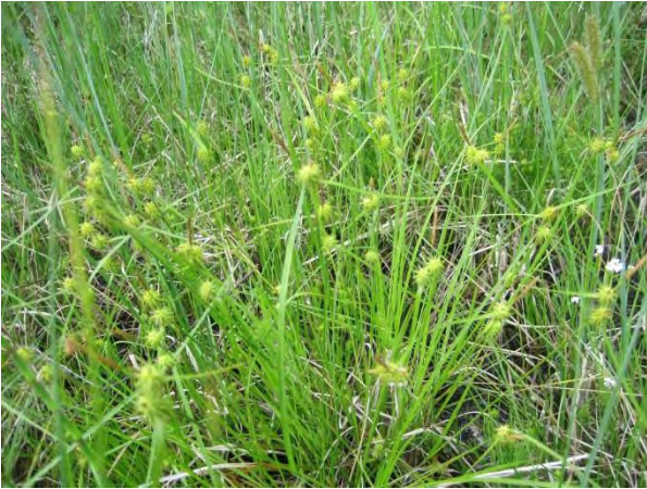
Kuva 61. Keltasara: ei uhanalainen, mutta havaintona huomionarvoinen