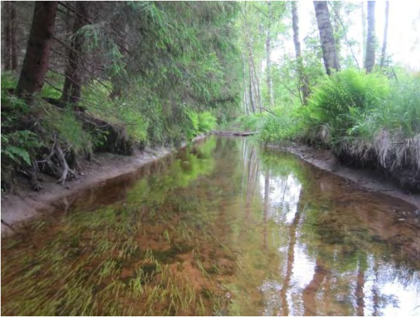
Kuva 32. Kominojan suorinta uomaa