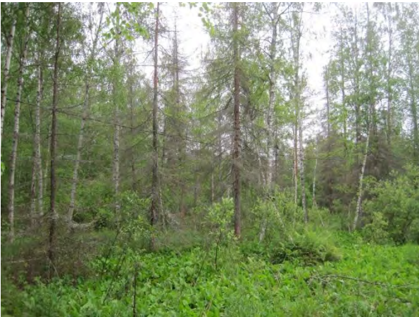
Kuva 89. Kakaravaaran lammen tulvametsää