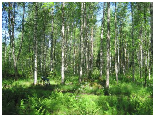
Kuva 29. Vehmasta koivikkoa Hamperinjoen varressa