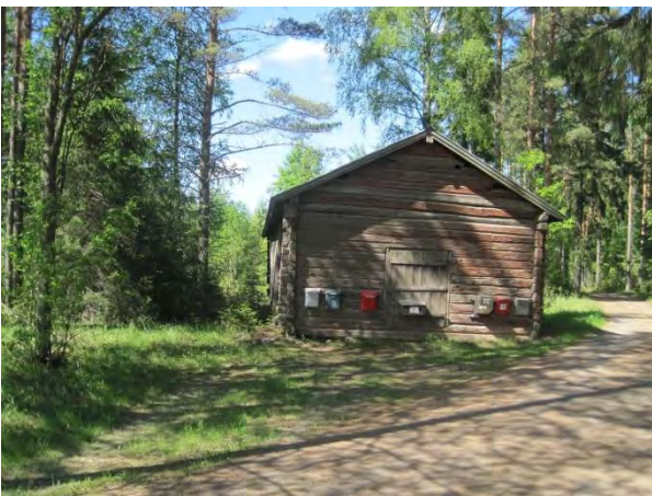
Kuva 18. Idyllinen ulkorakennus, Salokas