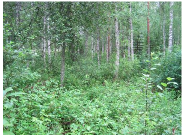
Kuva 90. Kakaravaaran vehmasta puustikkoa

Taajaman itäpuolella Paikkalanvuoren juurella louhikkoisessa Vanhan pappilan puro varressa on vanhempaa puustoa: mäntyjä, koivuja, tervaleppää Alnus glutinosa ja haapoja. Pensas- ja