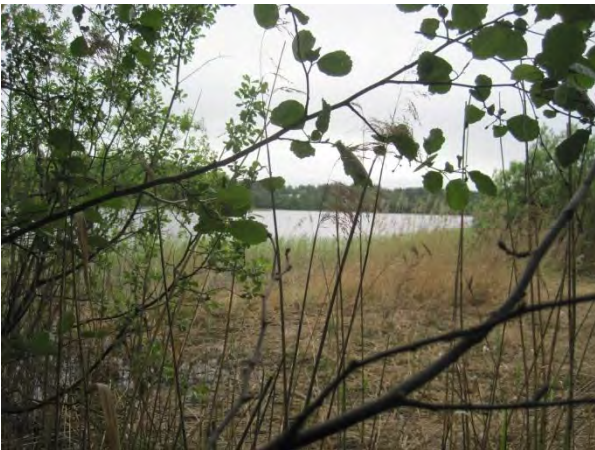
Kuva 59. Saarisen länsirannan ruovikkoa