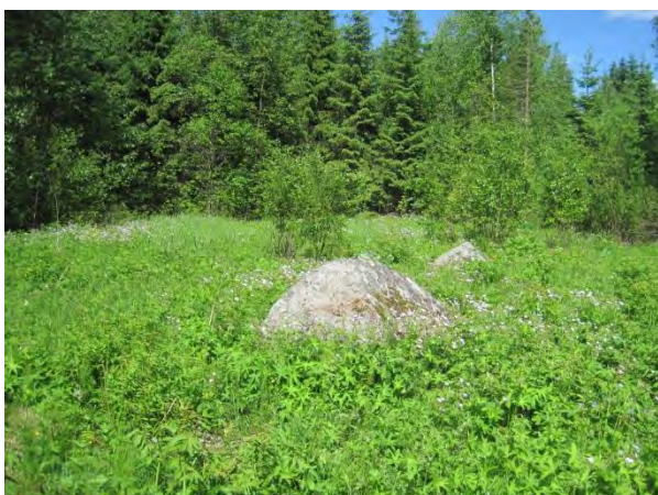
Kuva 30. Karilehdon kivikkoista niittyä