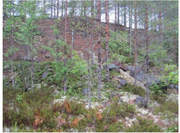
Kuva 104. Kärmevuoren maantieverren soramonttu

Torvilehto ja Oinaskangas ovat vaihtelevanikäistä tuoreempaa ja rehevämpää kuusivoittoista metsäaluetta. Metsästä löytyi pienialainen liito-oravaesiintymä (liito10) 19.6.2014. Metsän läpi menevän polun varressa on myös lehtokorpimaista osuutta, jonka luontoarvot ovat muuttuneet hakkuun ja maanmuokkauksen myötä.