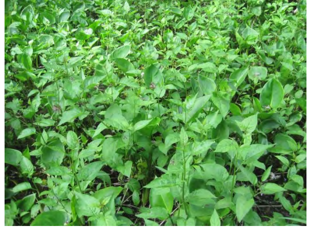
Kuva 66. Saarisen rannan punakoiso