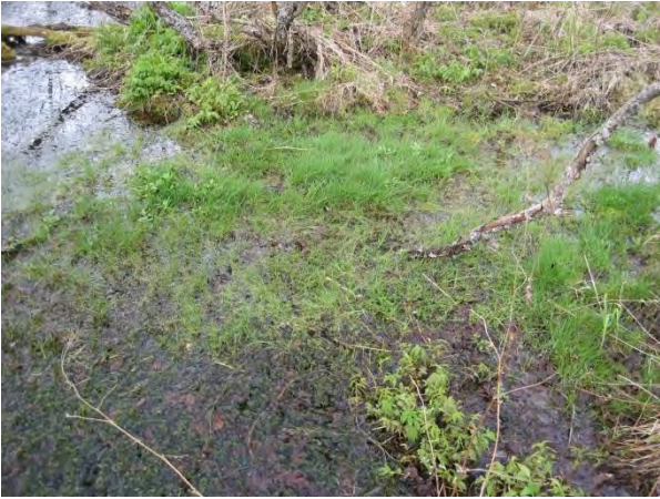
Kuva 53. Karvalin lähde