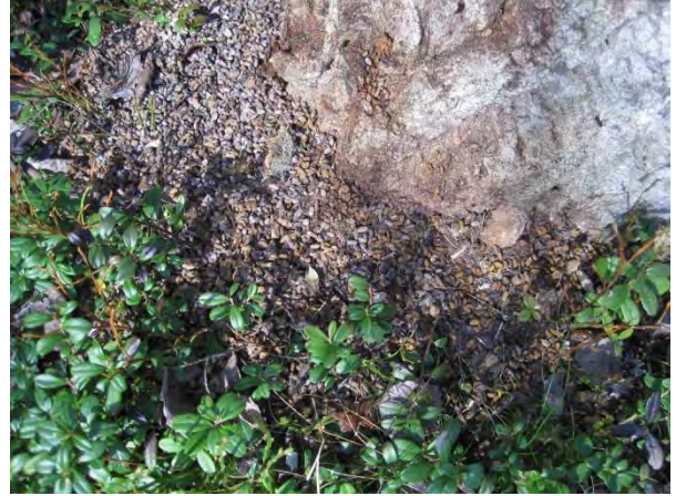
Kuva 46. Asutun pesäpuun alla on yleensä runsaasti papanoita, vanhaa (harmaat) ja uutta (kellertävä)