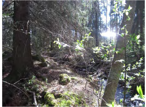
Kuva 52. Kouvolanoja Karvalin metsässä

Karvalintien varressa on pensaikon ympäröimä metsälain mukainen tärkeä elinympäristö lähde ja sen ympäristö , jossa on kasvillisuus hyvin rehevää. Lähteen ympärillä kasvaa muun muassa jokunen mänty ja koivu, pajuja, tuomi, soreahiirenporras, peltokierto Convolvulus arvensis , lehtohorsma Epilobium montanum , leskenlehti, luhtamatara Galium uliginosum , mesiangervo, suo-ohdake Cirsium palustre , huopa-ohdake, polvipuntarpää Alopecurus geniculatus sekä kastikoita että muita tavanomaisia heinälajeja. Lähteessä kasvaa runsaasti isonäkinsammalta ja tien pohjoispuolella on joskus kaivettu vesiallas, joka on täynnä isonäkinsammalta. Lähteelle on tehty ”pitkospuita”. Lähialueelle peltojen keskellä lähteen ympäristössä on myös suurempaa puustoa, koivua ja kuusia. Lähteen itäpuolella ennen Karvalia on mökkipihapiiri, jonka ympärillä on laikku isompaa puustoa, puoliavointa pensaikkoa, suuria kuusia ja istutusmetsää: koivua ja kuusta.