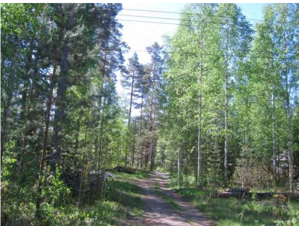
Kuva 11. Havulaan menevä pikkutie

Särkänkangas sijaitsee Saarisen rannassa Havulankankaan lounaispuolella. Särkänkankaalla on kanerva-puolukka-mustikkatyypin lisäksi heinäistä koivikkoa ja istutuskuusikkoa peltojen laidalla. Koivikossa kasvaa pensas- ja aluskasvillisuudessa ainakin pihlaja Sorpus aucuparia , kataja Juniperus communis , vadelma, metsäruusu Rosa majalis , ahomansikka Fragaria vesca , aho-orvokki Viola canina , lillukka Rubus saxatilis , kielo Convallaria majalis ja metsäkastikka Calamagrostis arundinacea . Koivikossa kasvaa myös haapaa ja harmaaleppää Alnus incana .