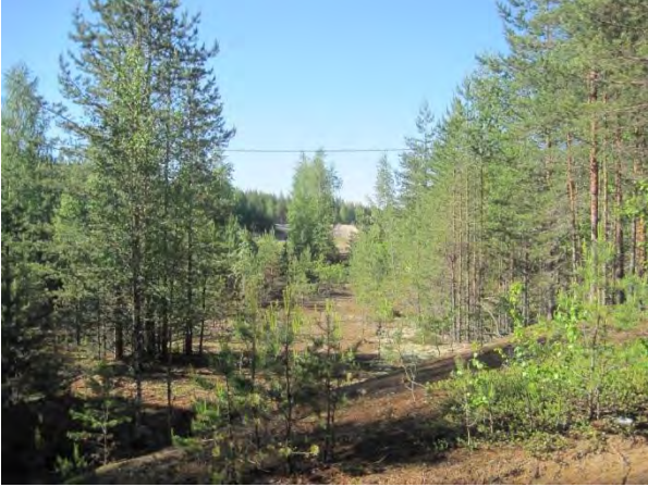
Kuva 9. Metsittyvää entistä soranottoaluetta