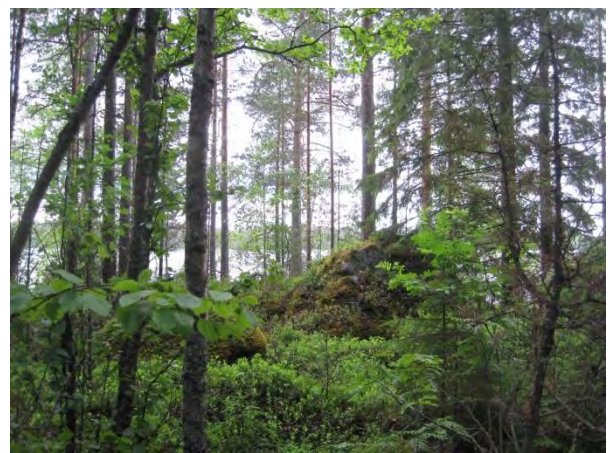
Kuva 25. Saarisen louhikkoista rakentamatonta etelärantaa

Tämän kaavan koillislaidassa kulkee Hamperinjoki (alle 2 km), joka laskee Maunosesta Aittojärveen . Joenvarsi on harvaan rakennettu: joitakin kesämökkejä, jokunen asuintalo sekä vanha mylly ja Toivakan puutarhat. Joen yli kulkee kolme tietä pienten siltojen kautta: Pihtiniityntie, Myllykankaantie ja Jokelantie .