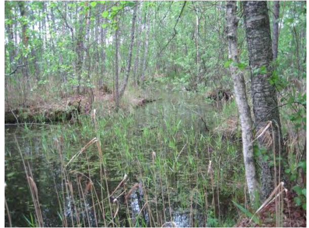
Kuva 58. Saarisen rantametsän vesiallikko