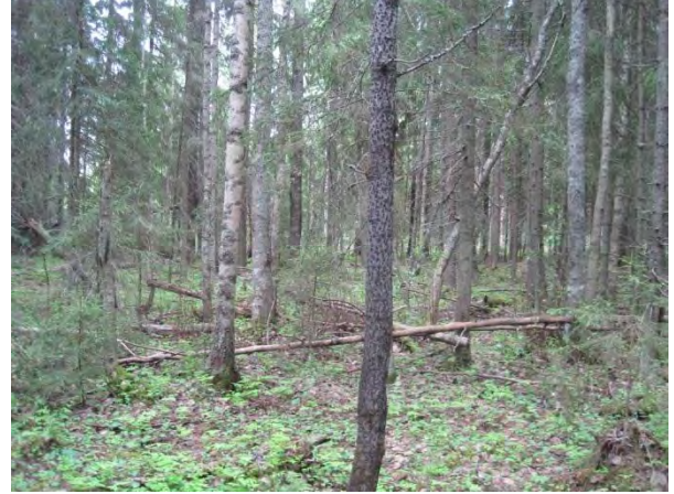
Kuva 5. Pirttilän ja Kallioperän välistä vanhempaa metsää

Kallioperän itäpuolella on puoliavoimia ojanvarsipensaikkoja ja kuusitaimikko, josta löytyy muun muassa maitohorsma, mesiangervo Filipendula ulmaria , karhunputki Angelica sylvestris , huopaohdake Cirsium helenioides ja vadelma Rubus idaeus . Kallioperän ympärillä ja pohjoispuolella Piukunnorossa on puolukka-(CT) ja mustikkatyypin (VT) havupuultaista metsää, harvennusta ja pieniä uudistusaloja. Paikoin löytyy myös koivua ja haapaa Populus tremula kasvavaa käekaali-oravanmarjametsätyyppiä (OMT) ja lahopuuta. Metsä on monirakenteista ja metsätyytit menevät limittäin, joten selkeiden rajojen tekeminen on vaikeaa.