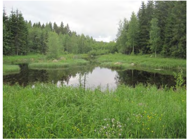
Kuva 96. Vehmaan vesilintulammikko

Pohjoonlahden itärannassa on reheviä metsiä. Osa metsistä on lehtomaista oravanmarjäkänkaalityypin kuusikkoa ja osa lehtipuuvältaista sekä lisäksi on myös haaparyhmiä, harmaalepikkoa ja pensaikkoja. Etenkin rakentamattomista osista rantaa löytyy runsasta pajukkoa ennen rannan saraa kasvavaa luhtaa ja vedessä kasvavaa järviruovikkoa. Metsiköiden kasvillisuudesta löytyy joukosta isoja haapoja, pihlajaa, ahomansikka, metsäruusu, sudenmarja, metsäorvokki, nuokkuhelmikkä ja metsäalvejuuri. Rantaluhdassa kasvaa ainakin luhtalemmikki, luhtasara, pullosara, jokapaikansara ja viiltosara.