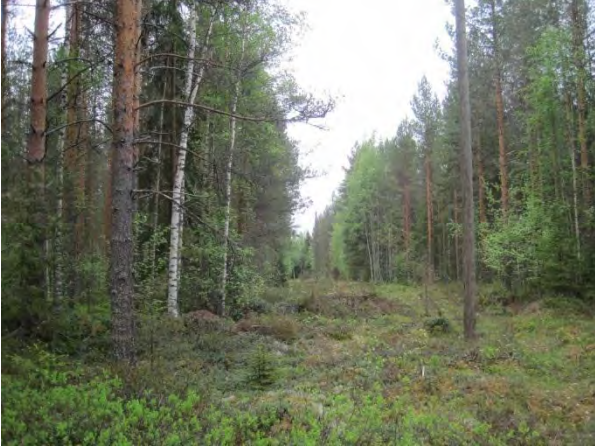
Kuva 4. Piukunnoron mäntyvaltaista sekapuustoa