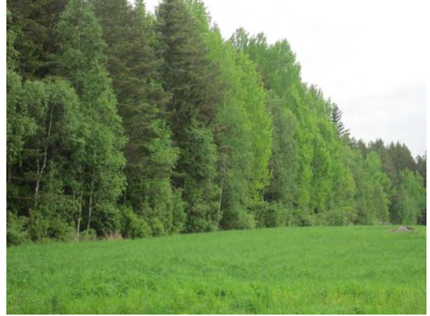
Kuva 21. Liito-oravametsäniemeke Vuojärven koillispuolella

Läheisellä Harjulan pellolla oli ruisrääkkä Crex crex ja laidunsi yksinäinen laulujoutsen Cygnus cygnus . Pohjoisempana koivukummun pellolla lauloi pensastasku Saxicola rubetra .