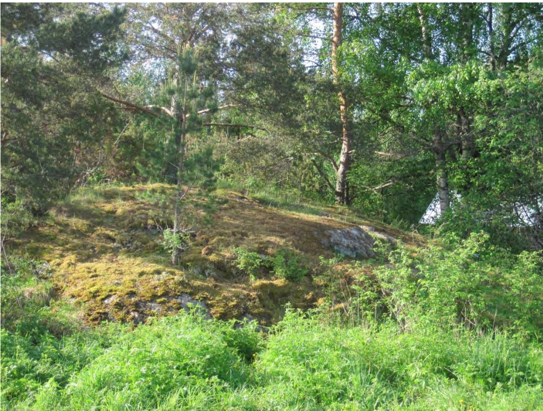
Kuva 73. Läsän rehevöitynyt kallioketo

Läsä on peltojen ympäröimä tila Saarisen eteläpuolella. Tilan yhteydessä on pieni metsäsaareke, jonka reunoilla on myös omakotitaloja. Läsän ulkorakennusten luona on kalliokumpare, jossa on ketomaista ympäristöä. Lajisto on tavanomaista ja sen perusteella on havaittavissa rehevöitymistä. Kalliolla kasvaa sammalten lisäksi tuomi, poimulehti Alchemilla sp. , metsäkurjenpolvi, ahomansikka, nurmitädyke, niittyleinikki, herukka, vadelma, mesiangervo ja koiranputki. Pienellä hoidolla kedosta saisi edustavamman.