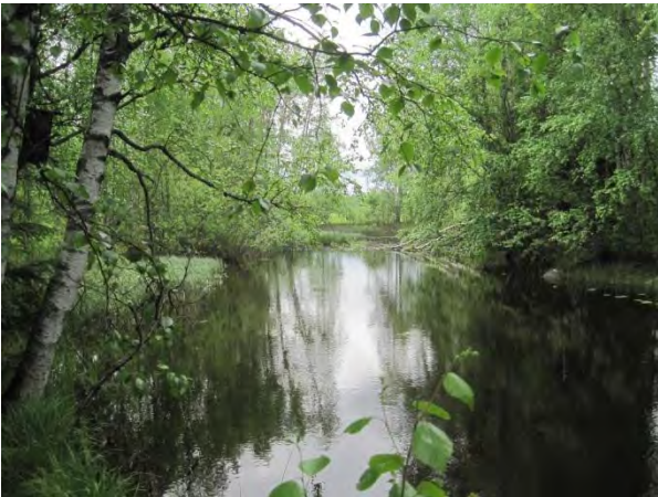
Kuva 55. Sahijoki

Sahijoen eteläpuolella on Särkän tilan peltoja; kapea puusto- tai pensaikkovyöhyke erottaa vesiuoman pelloista. Alajuoksulle mennessä Sahijoen varressa on nuorta metsää ja ihan joen varressa suurempia puita ja taimikon keskellä suuria haapoja.