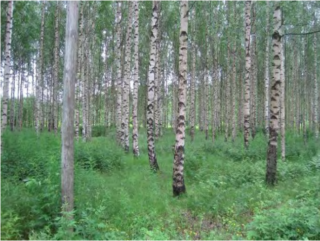
Kuva 71. Janholan pellonreunakoivikko