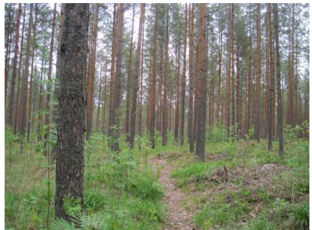
Kuva 12. Särkänkangas