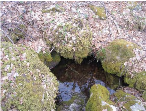
Kuva 97. Paikkalanvuoren lähde

Paikkalanvuori on vaihtelevasti poronjäkälä-, kanerva-, puolukka-, mustikkatyypin havumetsää. Pururadan varresta löytyy myös mäntytaimikkoa. Muuta louhikkoisen kankaan kasvillisuutta on muun muassa kataja, sianpuolukka, metsätähti, vanamo, metsäalvejuuri, rohtotädyke, oravanmarja ja polkusara Carex brunnescens . Paikkalanvuorella on kaksi huippua, joista eteläisempi on kalliojyrkänteinen ( luo1 ). Huipun puusto on männikköä. Rinteen alla polkujen varressa on kuusivaltaista metsää ja rehevämpää. Paikkalanvuoren lounaispuolella on taimikkoa.