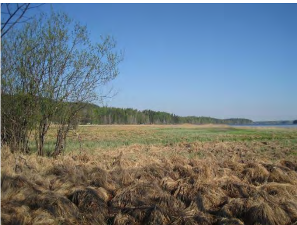
Kuva 107. Pohjoonlahden pohjan laaja rantakosteikko