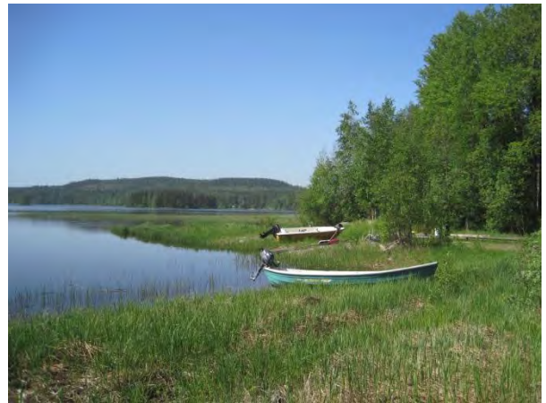
Kuva 80. Nikkarinlahden venesatama

Sikoviidan lähteen ympäristöstä ( luo1 ) on aiemmin tehty merkittäviä kasvi- ja sammallöytöjä. Lähteen ympärille on rakennettu huopakattoinen kaivokoppi ja pitkospuut. Nyt pitkospuut olivat hieman lahot. Ylempänä rinteessä kaakkoon on myös lähteisyyttä ja hieman sammalpeitteistä kivilouhikkoa. Lähteen ympärillä on rehevä kasvillisuus muun muassa ojakellukkaa, soreahiirenporrasta. Hieman kauempana rinteessä haapojen alla kasvaa rauhoitettua valkolehdokkia Platanthera bifolia ja kevätlinnunhernettä. Lähteen ja venesataman välissä on pienialainen lehtomainen sammalkivikkoinen metsäsaareke. Ympäröivä voimakas metsänhakuu on vähentänyt alueen luonnontilaisuutta. Aukolla on kolohaapoja, jossa pesi nyt käpytikka ja tervapääsky Apus apus .