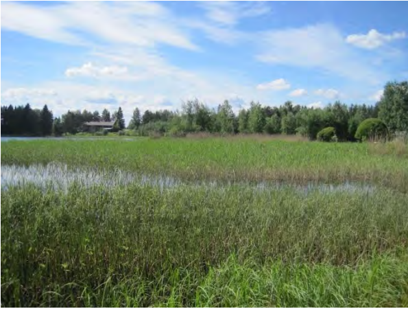
Kuva 36. Aittojärven pohjoispää