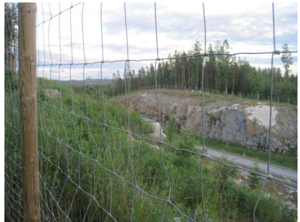
Kuva 118. Paasivuoren eteläosa, johon on louhittu valtatie 4.