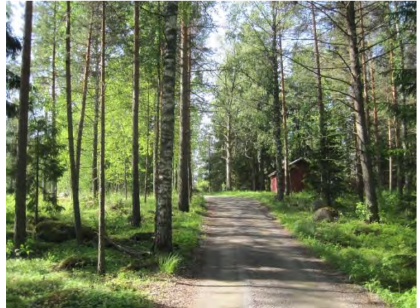
Kuva 78. Pihatie Leppävedenrannassa