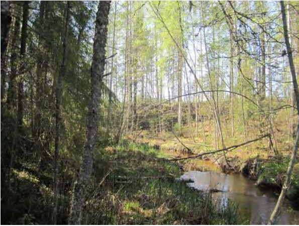
Kuva 109. Hietakosken puron läheinen hakkuu on hieman muuttanut puron varren pienilmastoa.