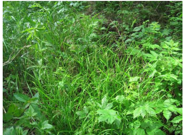
Kuva 35. Korpisorsimo Kominojan kosteikolla