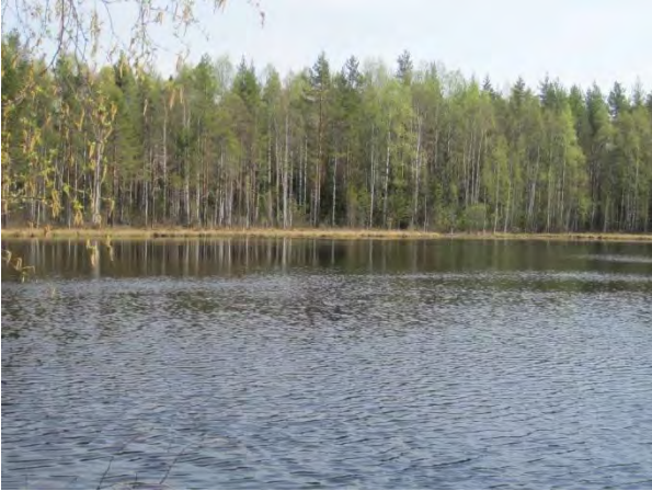
Kuva 40. Lamminsuonlampi

Lampea ympäröivät laajat nuorten metsien (kuusi, koivu) alueet. Itäpuolella on ojitettua rämemetsää.