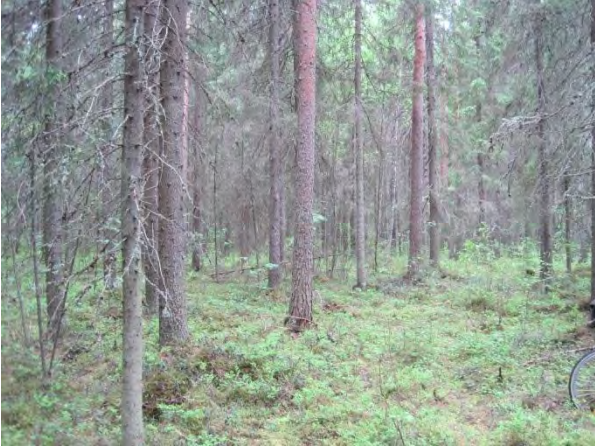
Kuva 20. Kuoppalan ympäristön metsää