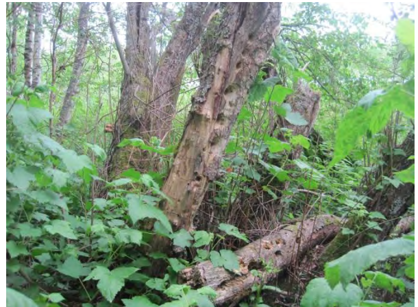
Kuva 68. Betonitehtaan rantapensaikko