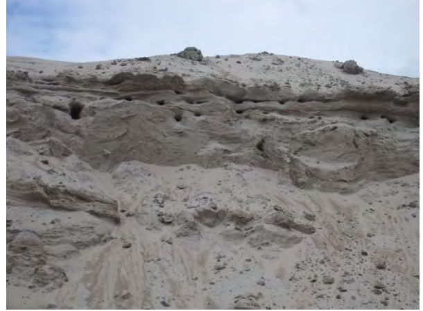
Kuva 10. Pieni törmäpääskykolonia soranottoalueella

Havulankankaan pohjoisosassa Huikontien länsipuolella on Havulankankaan pieni teollisuusalue , joka sijaitsee I luokan pohjavesialueella . Lähialueilla liikkuesssa teollisuusalueen toiminnan äänet kuuluivat ympäriinsä tämän kaavan pohjoisosassa, mikä on hyvä ottaa huomioon muun muassa asutusta suunniteltaessa. Havulankankaalla sijaitsee jonkin verran omakotitaloja ja muun muassa Havulan tila Mustalammen itäpuolella. Talot sijaitsevat kanerva-puolukka-mustikkatyypin mäntykankaalla.