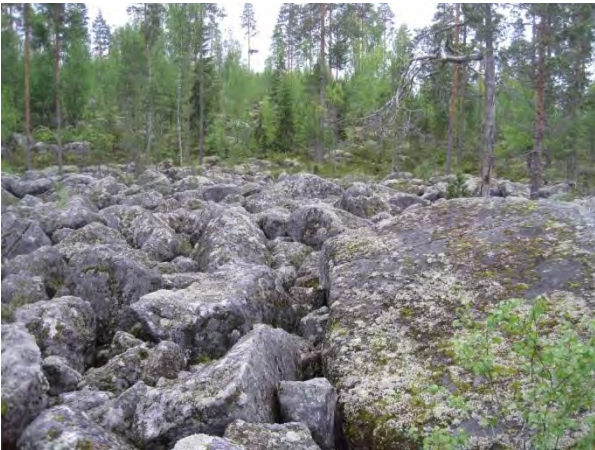
Kuva 123. Kylkissuon läheistä ”pirunpeltoa”