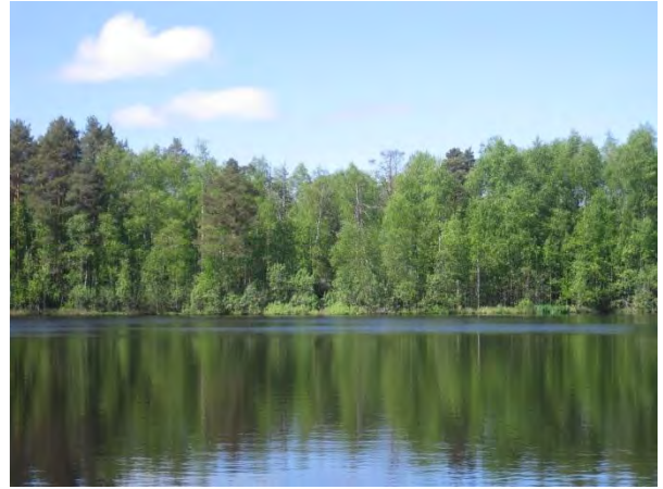
Kuva 14. Mustalampi ja taustalla länsirannan tulvametsä