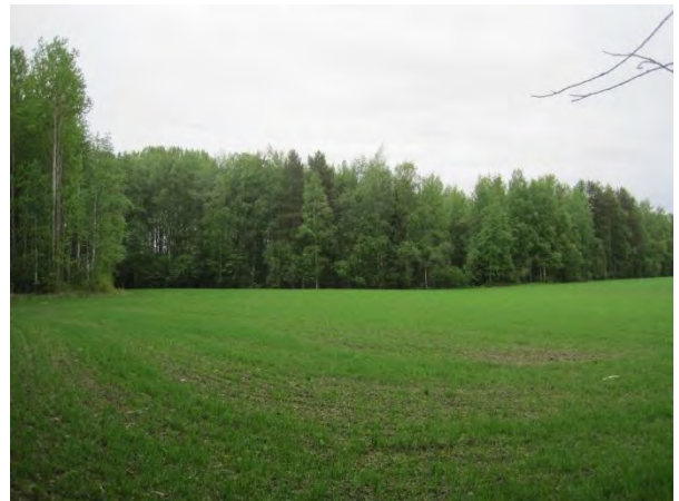
Kuva 60. Saarisen rannan rantametsää

Metsän linnustoon kuuluvat ainakin nuolihaukka Falco subbuteo , räkättirastas, punakylkirastas, mustarastas, lehtokerttu ja pajulintu.