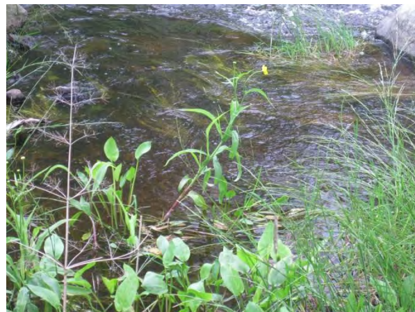
Kuva 27. Hamperinjoen varren kukkiva jokileinikki