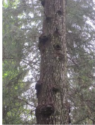
Kuva 7. Liito-oravan kolopuu