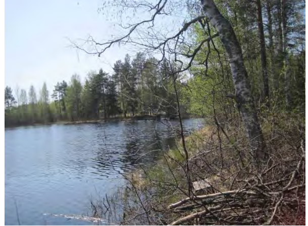
Kuva 41. Lamminsuonlampi, taustalla näkyy myös rantapeltoa

Tämän työn selvitysalue rajautuu idässä maisemallisesti hienoon Konttikallioon .