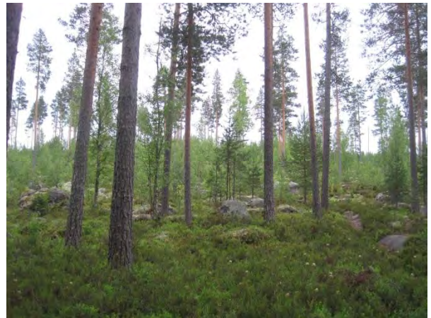
Kuva 124. Iso Kylkilammen itäpuolen karua ja kivikkoista männikköä

Tämän kaava-alueen lounaisraja on Kylkisojan kohdalla, joka laskee vetensä Iso Kylkislampeen. Kylkisojan varsi on louhikkoinen puro, jonka varressa kasvaa kivillä muun muassa haisukurjenpolvea Geranium robertianum ja lehtoarhoa. Puron varressa on liito-oravaesiintymä (23.5.2014). Papanoita löytyi usean kuusen tyveltä ( liito14 ). Aiemmin liito-oravaa on havaittu samalta alueelta ja Kylkisniitun laidasta.