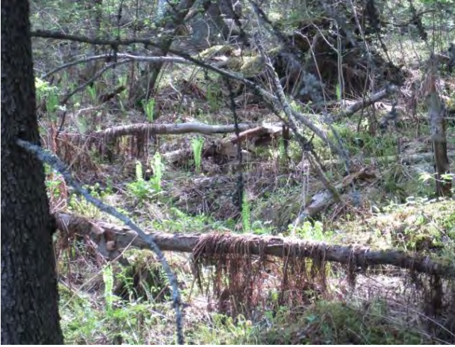
Kuva 113. Sivinmatinmutkan puron varren versovat kotkansiivet