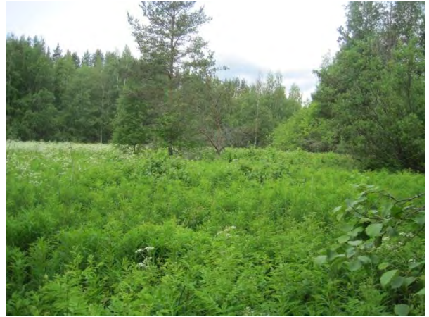
Kuva33. Harjun ja Kominojan välistä niittyä