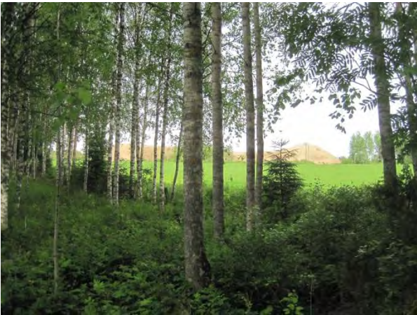
Kuva 34. Syrjäharjun sorakasat peltomaisemassa