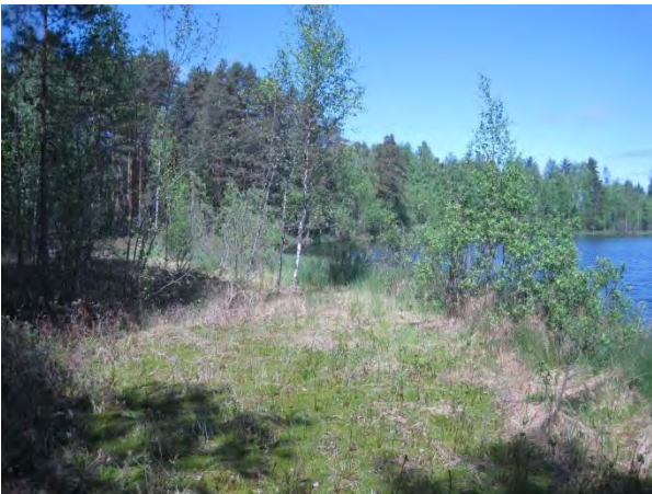
Kuva 15. Mustalammen lounaiskulman rantanevaa

Salokas ja Harjula -tilojen ympäristö on maatalousympäristöä, josta löytyy vanhoja ulkorakennuksia, laidunmaata ja peltoa sekä lehtomaisia ja tuoreita kangasmetsiä. Räkättirastas Turdus pilaris -yhdyskunnan lisäksi metsissä kuului ainakin mustapääkerttu Sylvia atricapilla , seudulla harvalukuinen kultarinta Hippolais icterina , punarinta, puukiipijä ja sepelkyyhky.