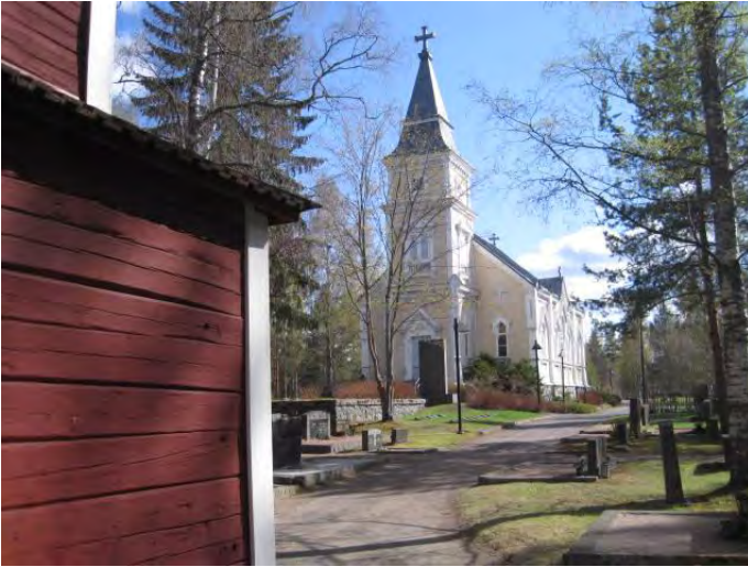
Kuva 1. Toivakan kirkko kellotapulin vierestä kuvattuna

Valtakunnallisesti arvokas rakennettu kulttuuriympäristö Toivakan puukirkko on kirkonkylän Syrjänharjulle valmistunut 1882 ja kellotapuli 1871, joita ympäröi hautausmaa.