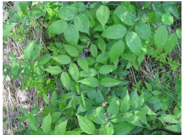
Kuva 84. Kevätlinnunherne

Sikoviidan rantamökeistä itään on mäntyvaltaista metsää, joka sisempänä muuttuu kuusivaltaisemmaksi, josta ojan varresta löytyi liito-oravan elinpiiri (liito6) 5.6.2014. Paikoin löytyi runsaasti papanoita haapojen ja kuusten juurelta. Lisäksi rannan lintulajistosta mainittakoon rantamäntyjen yläpuolella varoitteluva nuolihaukka.