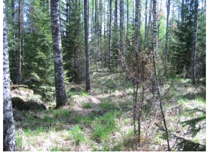
Kuva 114. Rajamäen valoisa metsäsaareke

Rajamäen ympärillä olevien peltojen väliin jää monipuolisia osin hakamaisia metsäsaarekkeita, joissa osassa pääpuuna on koivu ja osassa mänty tai kuusi. Rajamäen tilan pihapiirin ympäriltä löytyi myös liito-oravan papanoita suuren kuusen alta 22.5.2014 ( liito17 ). Rajamäen ja Kujalan pihapiireistä olisi ehkä saattanut löytyä lisää merkkejä liito-oravasta. Pihoja ei tutkittu.