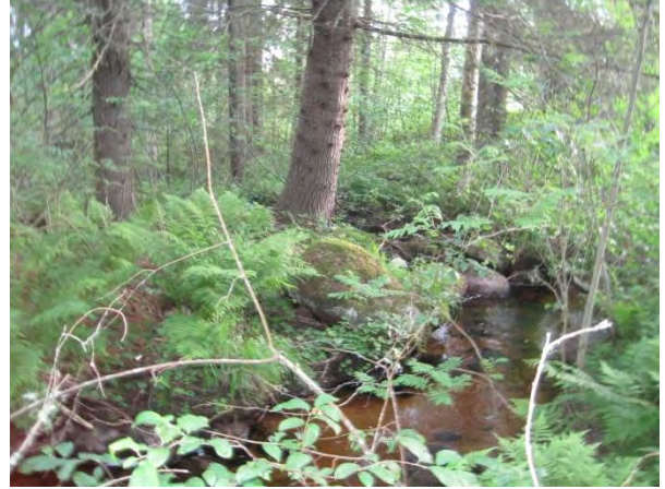
Kuva 116. Laskukallion ohi kulkeva kirkasvetinen puro, joka muuttuu etempänä Hietakosken puroksi

Paasivuori kuuluu vain eteläosaltaan tähän osayleiskaava-alueeseen. Paasivuori on pääosin havupuuvaltaista metsäaluetta, joka kohoaa korkeimmillaan yli 166 metrin korkeuteen merenpinnan yläpuolelle ympäröivää maisemaa hallitsevasti etenkin Leppävedenrannasta päin katsottuna. Paasivuori sijaitsee vanhan Jyväskylätien (644) ja uuden valtatie 4. (E75) välissä, jonne uuden tien liikenteen melu kuuluu selvästi. Vuoren laelle kulkee metsäautotie ja rinteillä on laajalti tehty hakkuita. Vuoren eteläosa on havupuuvaltaisen puolukka-mustikkatyyppin metsän peitossa, jossa joukossa kasvaa myös lehtipuuta. Alempana rinteillä on rehevämpää käenkaali-oravanmarjatyyppin kuusikkoa. Pellon laidoissa ja tienvarsilla on enemmän lehtipuuta. Itärinteessä on karumpaa kanerva- ja poronjäkälatyyppin männikköä. Yleensäkin Paasivuori on hyvin louhikkoista ja rinteistä löytyy näyttäviä siirtolohkareita. Metsäautotien penkassa kasvoi yksittäinen valkolehdokki ja muualla metsässä kasvaa mm. metsävirnaa. Uusi valtatie 4 on louhittu Paasivuoren etelärinteeseen ja tie on varustettu riista-aidalla.