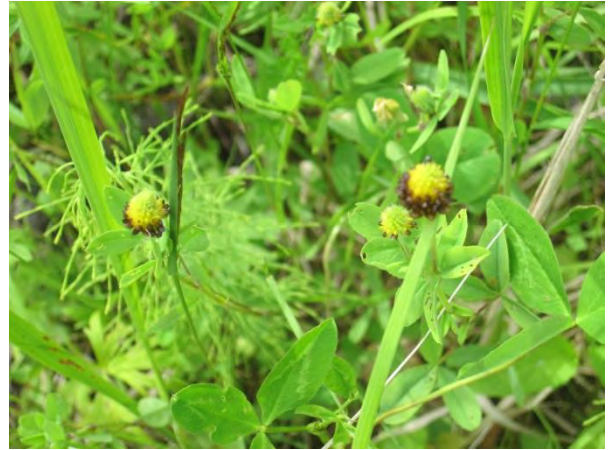
Kuva 62. Silmälläpidettävä musta-apila