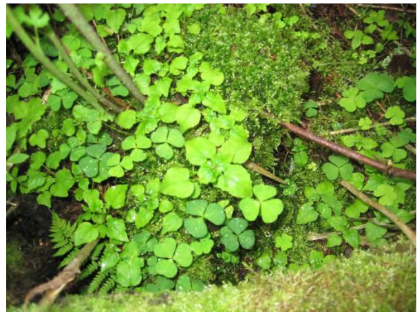
Kuva 92. Velholehti käenkaalin joukossa