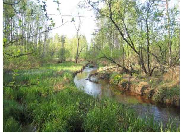
Kuva 106. Pohjoonlahden virtaava leveä puro