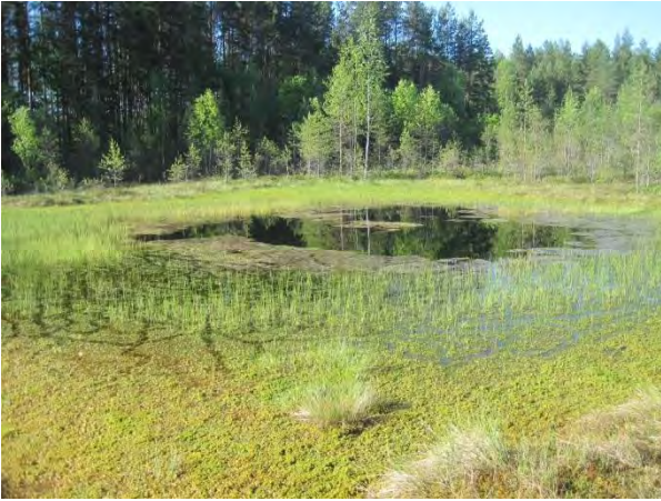
Kuva 2. Maunosensuon umpeenkasvava lampare ja oikealla taustalla rämettä.