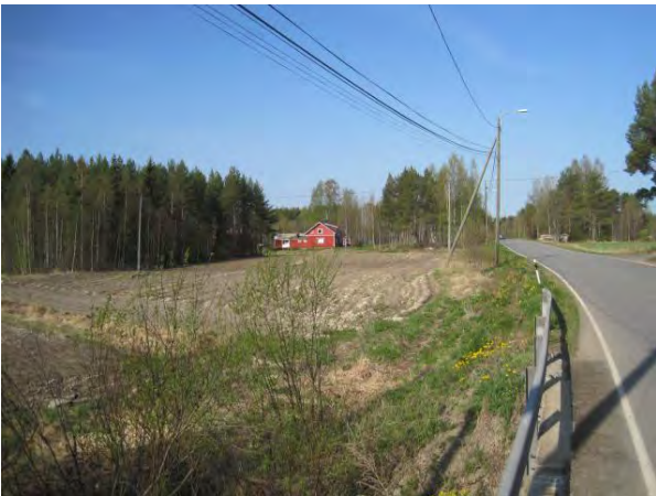
Kuva 49. Koivulehdon tila Varikontien varressa