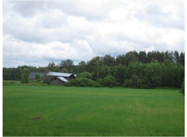
Kuva 72. Läsän ulkorakennuksia, peltoa ja takametsää

Läsä on peltojen ympäröimä tila Saarisen eteläpuolella. Tilan yhteydessä on pieni metsäsaareke, jonka reunoilla on myös omakotitaloja. Läsän ulkorakennusten luona on kalliokumpare, jossa on ketomaista ympäristöä. Lajisto on tavanomaista ja sen perusteella on havaittavissa rehevöitymistä. Kalliolla kasvaa sammalten lisäksi tuomi, poimulehti Alchemilla sp. , metsäkurjenpolvi, ahomansikka, nurmitädyke, niittyleinikki, herukka, vadelma, mesiangervo ja koiranputki. Pienellä hoidolla kedosta saisi edustavamman.