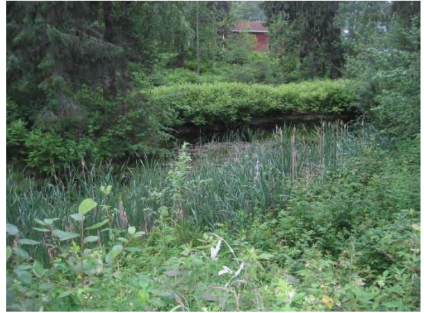
Kuva 94. Vanhan pappilan lammikko

Malviharjun tien ja Viisarinmäentien (618) kulmaan jää varttuneiden puiden metsäsaareke, jossa kasvaa rauhoitettua valkolehdokkia yli kymmenen yksilöä. Valitettavasti esiintymää uhkaa tienvarteen kasatut maakasat ja juurakot ( luo1 ).