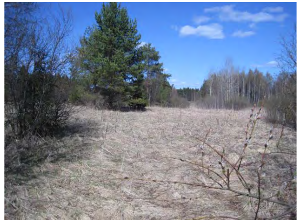
Kuva 50. Koivulehdon niittyä toukokuussa

Karvalin metsän läpi virtaa metsälain mukainen kohde , kivikossa loriseva Kouvolanoja , joka Karvalin kohdalla luo monimuotoisuutta metsäalueeseen, ja jota reunustavat suuret kuuset. Tämä pienvesi on ilmeisesti aikoinaan pengerrytetty ja peltojen kohdalla se virtaa hyvin ojamaisena.