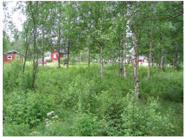
Kuva 88. Kakaravaaran asuntoalueen puronvarsikoivikko