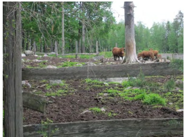
Kuva 19. Karjaa aitauksessaan, Salokas

Kuoppalan ja Vuojärven itäpuolella läheisestä OMT -tyypin kuusivaltaisesta metsästä sekä pellon sekametsäniemekkeestä löytyi liito-oravan lisääntymis- ja levähdyspaikka 3.6.2014. Tästä olivat merkinä lukuisat papanarykelmät haapojen ja kuusten juurella. Rajauksessa on myös kolohaapoja. Esiintymä on rajattu karttaan ( liito2, kaksi osa-aluetta ja kulkuyhteys ).