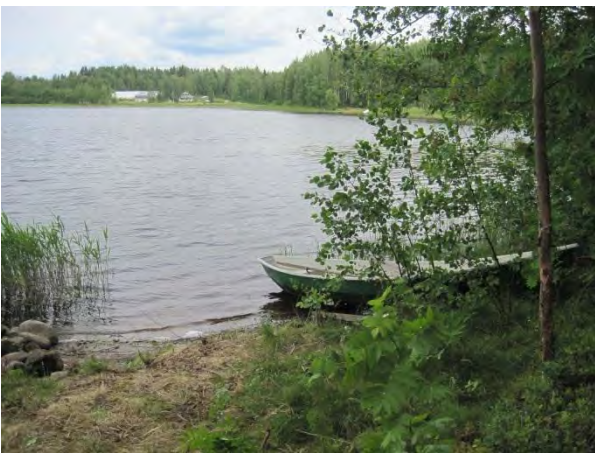
Kuva 38. Aittojärvi Harjun kärjestä kuvattuna