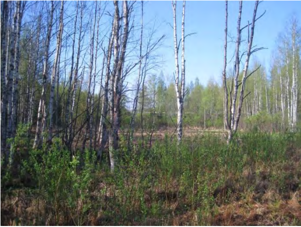
Kuva 105. Maanteiden välinen kosteikko-osa