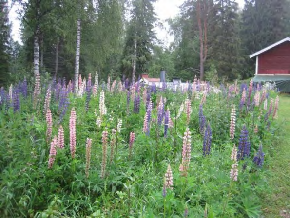
Kuva 93. Komealupiini valtaa alaa