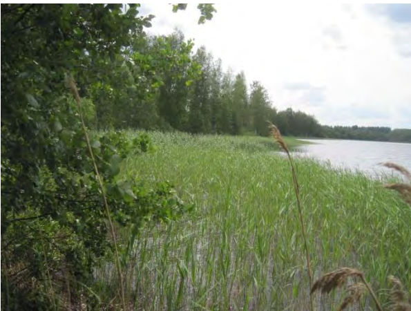
Kuva 67. Saarinen kirkonkylän uimarannasta etelään