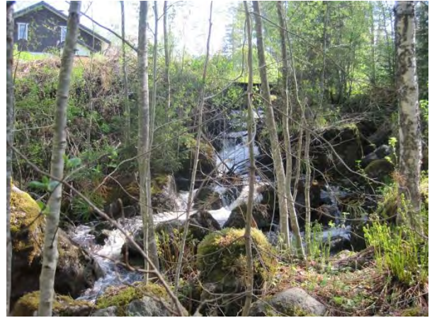
Kuva 110. Hietakoskenpuron koskimainen osuus

Hietakosken puron varressa on suurta puustoa: kuusta, koivua, haapoja ja mäntyjä. Harjupuron eteläpuolella on tuore hakkuu, johon on jätetty siemenpuuksi mäntyä. Hietakoski-puron varresta löytyy runsas ja paikallisesti merkittävä kasvilajisto: velholehti, korpisorsimo , kotkansiipi, metsäkorte, kangaskorte, lehtotesma, korpi-imarre, käenkaali, soreahiirenporras, mesiangervo, suo-orvokki ja kielo. Puronotkon reunoilla kasvaa suuria kuusia, mäntyjä sekä lehtipuuta – joukossa myös kolo- ja lahoppuuta. Paikoin puronvarsi on varsin pensaikkoista ja hankalakulkuista. Puronvarteen on uhkaavasti leviämässä pihoista jättipalsami ja pihlaja-angervo, jotka ovat uhka muun muassa korpisorsimon säilymiselle alueella. Puron ylittää rantamökeille menevän tien silta, jonka länsipuolella on koskimainen puro-osuus. Puron meanderimaisessa mutkassa on myös vehkaa kasvava lammikko.