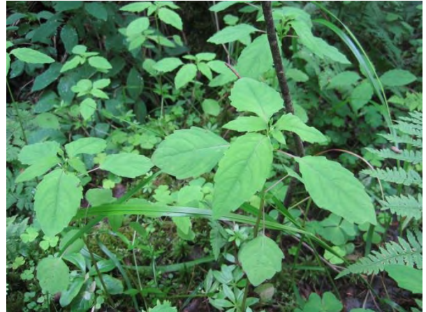
Kuva 128. Lehtopalsami