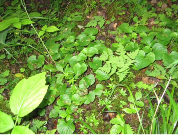
Kuva 129. Lehtomatara ja -orvokki