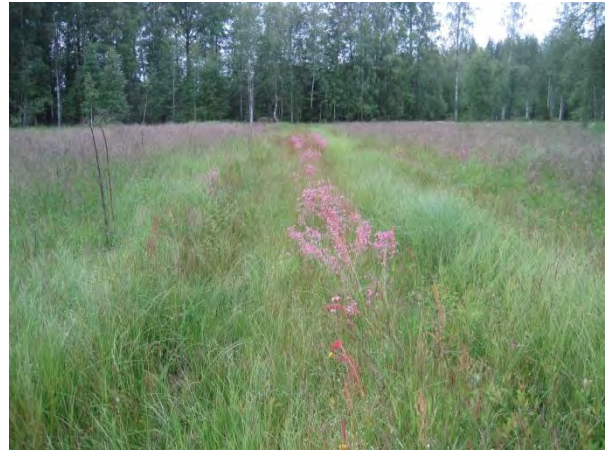
Kuva 122. Väliniityn ojan varressa kukki punaisena käenkukkaa