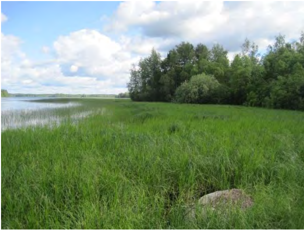
Kuva 95. Pohjoonlahden ranta Vehmaan kohdalla

Lähempänä rantaa löytyy liito-oravan papanoita kuusten juurelta läheltä rantamökkiä 19.6.2014 ( liito9 ).