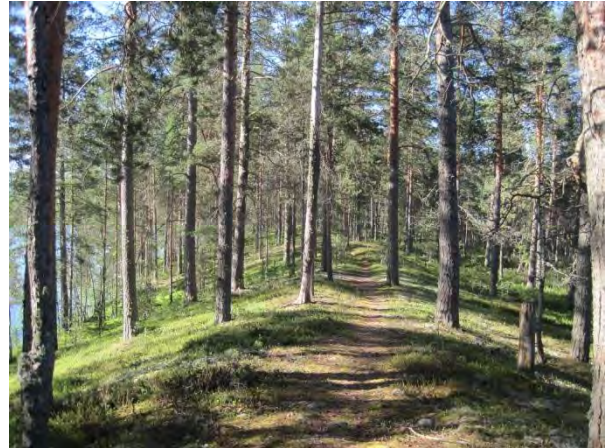
Kuva 3. Maunosen ja -suon välinen maisemakannas