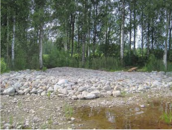
Kuva 65. Saarisen rannan pitkospuut ja tuleva venepaikka

vulgaris ja pieni esiintymä lehto-orvokkia Viola mirabilis . Ajan kanssa rannasta saattaisi tehdä mielenkiintoisia sammal- ja kääpälyttöjä. Elinympäristönä paikka sopii satakielelle Luscinia luscinia ja muille pensaikkolinnuille. Nyt nähtiin vain parvi naakkoja Corvus monedula ja sinisorsapoikue.