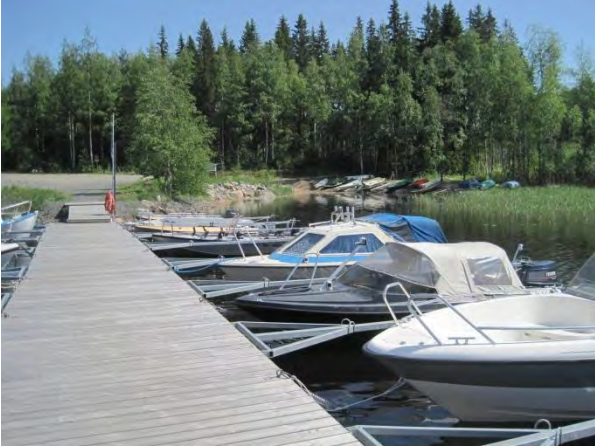
Kuva 81. Sikoviidan venesatama