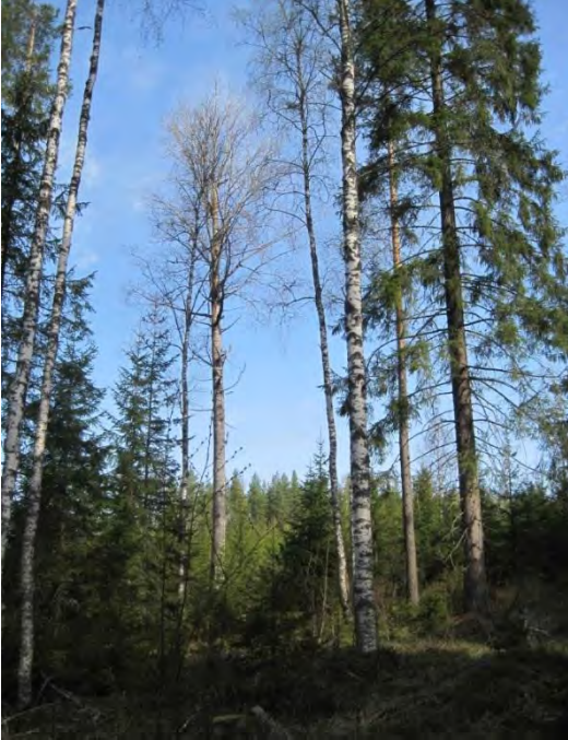
Kuva 45. Harvapuinen liito-oravan pesäpaikka

Lamminsuontien varresta molemmin puolin Kuuselan ja Suonpään väliseltä metsäalueelta löytyy liito-oravaesiintymä , jossa selkeä lisääntymispaikka haavan kolossa aivan taimikon laidassa 19.5.2014 (liito3).