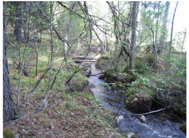
Kuva 113. Sivinmatinmutkan puro, joka muuttuu matkalla Hietakoskeksi