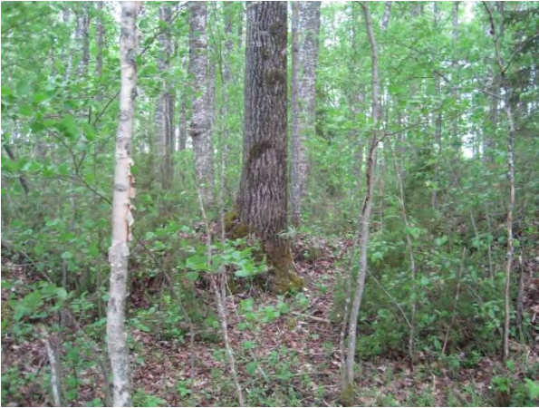
Kuva 57. Saarisen länsirannan metsikkö