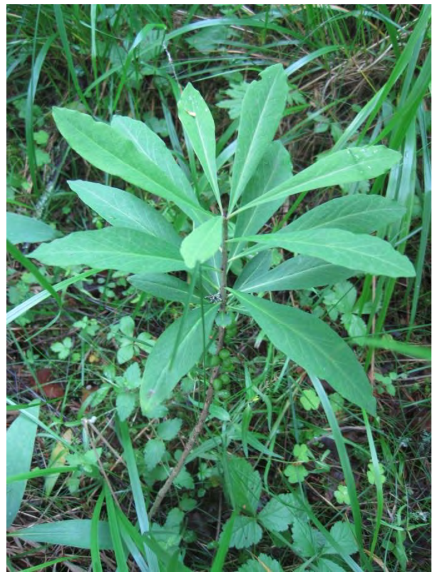
Kuva 70. Näsiä