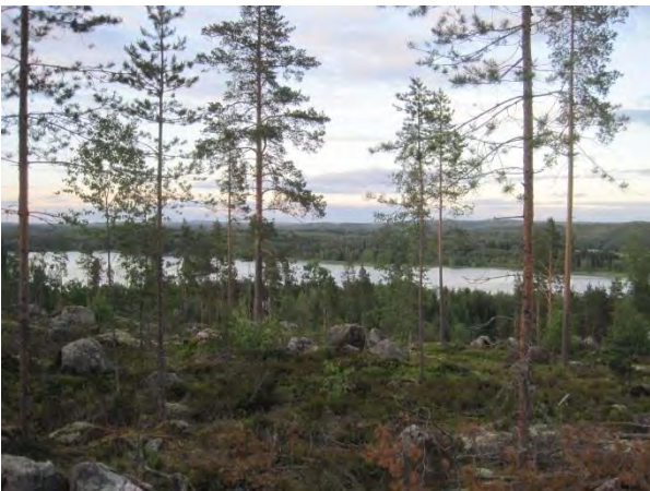
Kuva 117. Näkymä harvennetulta Paasivuorelta

Paasivuori kuuluu vain eteläosaltaan tähän osayleiskaava-alueeseen. Paasivuori on pääosin havupuuvaltaista metsäaluetta, joka kohoaa korkeimmillaan yli 166 metrin korkeuteen merenpinnan yläpuolelle ympäröivää maisemaa hallitsevasti etenkin Leppävedenrannasta päin katsottuna. Paasivuori sijaitsee vanhan Jyväskylätien (644) ja uuden valtatie 4. (E75) välissä, jonne uuden tien liikenteen melu kuuluu selvästi. Vuoren laelle kulkee metsäautotie ja rinteillä on laajalti tehty hakkuita. Vuoren eteläosa on havupuuvaltaisen puolukka-mustikkatyyppin metsän peitossa, jossa joukossa kasvaa myös lehtipuuta. Alempana rinteillä on rehevämpää käenkaali-oravanmarjatyyppin kuusikkoa. Pellon laidoissa ja tienvarsilla on enemmän lehtipuuta. Itärinteessä on karumpaa kanerva- ja poronjäkälatyyppin männikköä. Yleensäkin Paasivuori on hyvin louhikkoista ja rinteistä löytyy näyttäviä siirtolohkareita. Metsäautotien penkassa kasvoi yksittäinen valkolehdokki ja muualla metsässä kasvaa mm. metsävirnaa. Uusi valtatie 4 on louhittu Paasivuoren etelärinteeseen ja tie on varustettu riista-aidalla.