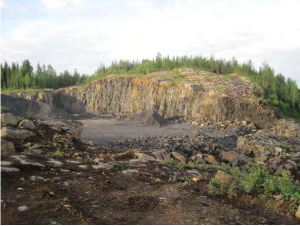
Kuva 115. Laskukallion avolouhos