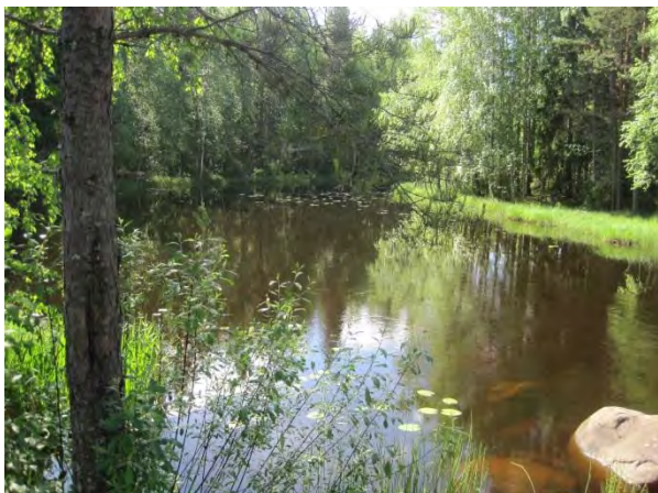
Kuva 26. Hamperinjoen alkupäätä