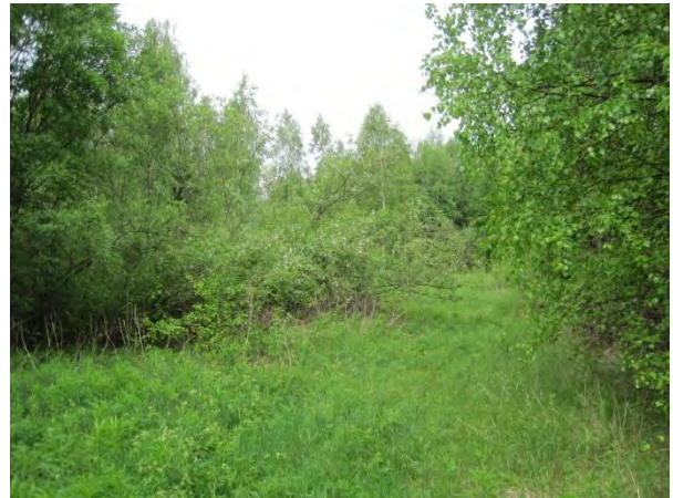
Kuva 56. Sahijoen itäpuolen pensaikkaa lähellä Vuojärveä.

Särkätien varressa tilalle päin mentäessä on pienialainen OMT- sekametsäsaareke, jonka reunaosissa on viljelyalueen reunoille tyypillistä harmaalepikkoa, jossa kasvaa ainakin nokkonen, metsäimarre, metsäalvejuuri ja vadelma.