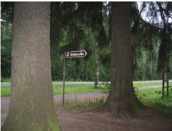
Kuva 91. Vanhan pappilan komeat kuuset

Puron varren linnustoon kuuluvat mustapääkerttu, lehtokerttu, pajulintu, punarinta, peippo, viherpeippo Carduelis chloris ja punatulku Pyrrhyla pyrrhyla .