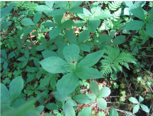
Kuva 83. Eräs yleinen lehdonilmentäjälaji: sudenmarja