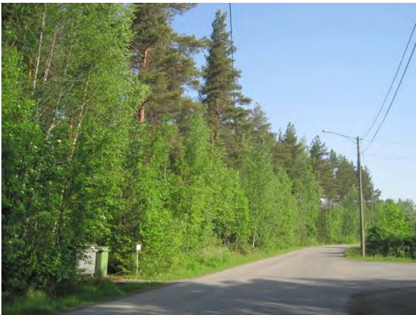
Kuva 74. Metsää Ahokkaan asuinalueen pohjoislaidassa

Raivionmäen itäpuolella pellon keskellä on oravanmarja-mustikkatyypin metsäsaareke, jossa kasvaa sekä havu- että lehtipuuta. Raivionmäellä on myös laajoja taimikkoja ja aivan uusia hakkuita. Raivionmäen länsipuolella pellon laidassa on istutuskoivikko, jonka pohjoisosassa on pala puoliavointa pensaikkaa ja luhtakoivikko, jossa on runsas mesiangervo- ja maitohorsmakasvusto. Koivikon laidassa Nikkarinlahteen laskee pieni vaatimaton ojamainen puro Ajakanoja . Itäpuolella peltoa voimalinjan alla on kostea pensaikka, jossa viihtyi muun muassa pensaskerttu, lehtokerttu ja metsäkirvinen Anthus trivialis . Tuulensuun pellolla pesi ainakin töyhtöhyppä Vanellus vanellus ja Ahokkaan pohjoispuolella sirisi pellolla pensassirkkalintu Locustella naevia 5.6.2014. Raivionmäen linnusto on melko harvaa: tiltalti, laulurastas, hernekerttu ja peippo.