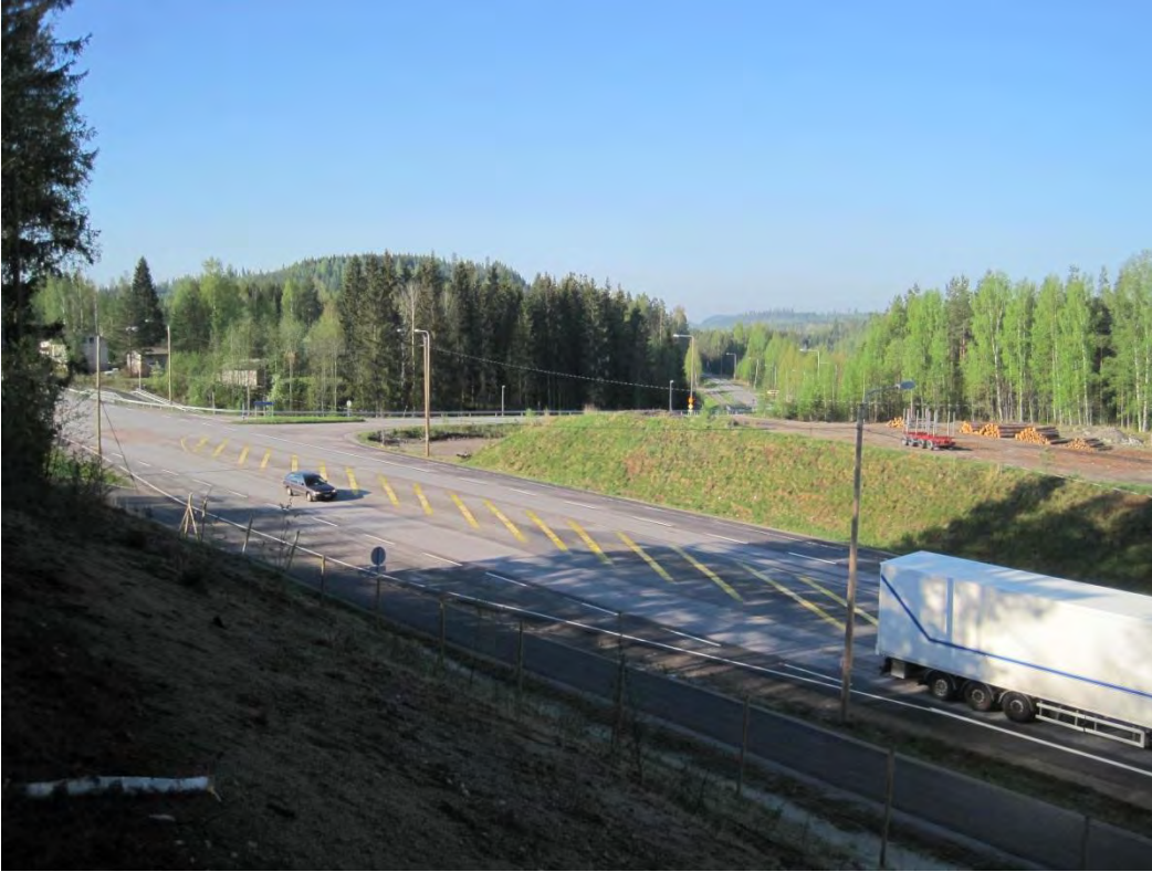
Kuva 131. Rutalahdentien risteys ja vilkas valtatie 4. Taustalla liito-oravareviiri ja sen takana vuori

Koulu sijaitsee mäellä Rutalahdentien ja uuden valtatie 4 risteysalueen eteläpuolella Baijerin laakson itälaidalla. Koulun lähetyvillä on haja-asutusta: omakotitaloja, pienialaisia metsiköitä (lähinnä nuorehkoja koivikoita) ja peltoja. Koulun läheisyydessä tieristeysalueen metsikkörinteessä on liito-oravan lisääntymis- ja levähdyspaikka (1.7.2014)( liito16, Kuva 131 ). Tästä on myös aiempia havaintoja (Pylvänäinen 2011).