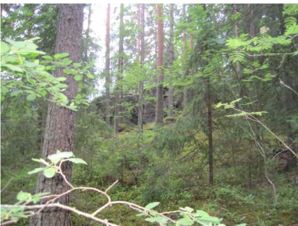
Kuva 101. Kärmevuoren pieni männikköjyrkäne

Kärmevuoren länsilaidassa Viisarinmäentien varressa on syvä vanha soramonttu, jossa kasvaa nyt tiheästi harmaaleppää. Montun reunoilla kasvaa kanervaa, poronjäkälää ja keltatalvikkia Pyrola chlorantha