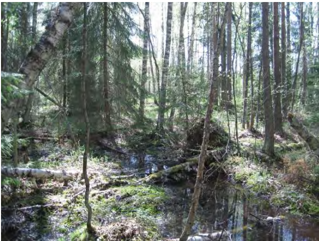
Kuva111. Hokkalan monimuotoista metsää

Reheväkasvuisten purojen väliin jää tuoretta mustikka-käenkaalityypin metsää. Tällä metsäalueella on paikoin myös nuorehkoa istutuskuusikkoa ja koillisosassa puron pohjoispuolella pieni hakkuu-aukeakin. Länsipuolen puron läheisyyteen on rakennetta kaksi uutta omakotitaloa. Lisäksi puustoa on hakattu kivikkoisen puron varresta. Tähän metsäalueeseen kuuluu myös Poikaraiskansuo .