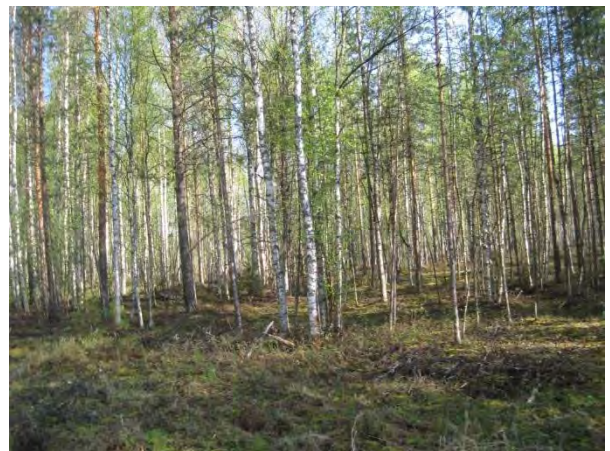
Kuva 108. Pohjoonlahden turvekangas