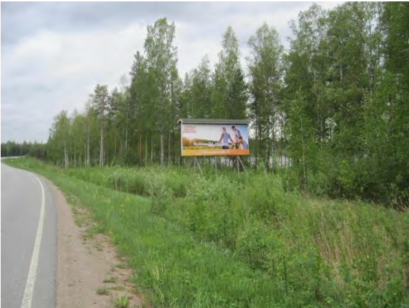
Kuva 63. Tervetulotoivotus Huikon suunnasta, taustalla Saarinen: Paikallisesti merkittävä harvinaisten kasvien kasvupaikka.