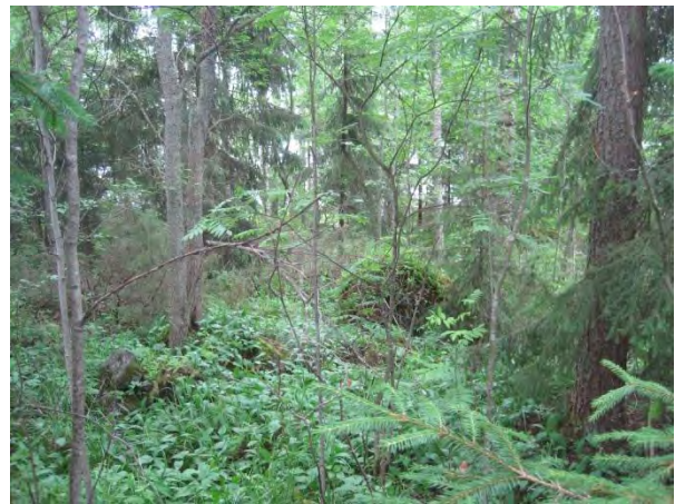
Kuva 120. Louhikkoista Pohjoonlahden rantametsää

Paasivuoresta Valtatie 4:n lounaispuolella on laajat metsäalueet ilman asutusta. Seudulta löytyy myös kolme erillistä pienalaista peltoa: Väliniitty , Järvisuon pohjoispään niitty ja Kylkisniitty . Järvisuon pohjoispään niityllä on tyypillistä kostean niityn kasvillisuutta. Heinien lisäksi sieltä löytyy yleisiä saroja, metsäalvejuuri, suo-ohdake, käenkukka ja mesiangervo. Väliniityllä on keskellä peltoa, kivikkoja ja siirtolohkareita, joiden ympärillä kasvaa muun muassa joitakin nuorehkoja koivuja ja katajaa ja päällä poronjäkäliä, sammalia, heiniä ja metsäalvejuurta. Väliniityn länsi- ja lounaispuolella on pala saniaiskorpea, jossa kasvaa suuria haapoja ja koivikkoa. Koivikossa kasvaa myös jokunen tervaleppä. Osa saniaiskorvesta on hakattu ja ojitettu. Taivaanvuohi tuntui viihtyvän tässä avoimessa ympäristössä.