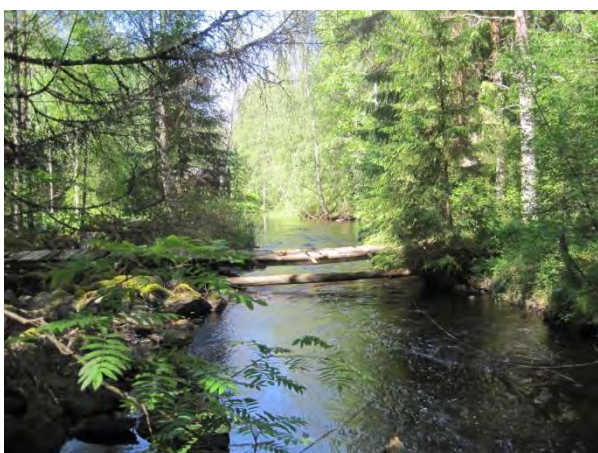
Kuva 28. Puinen pikkusilta Hamperinjoella