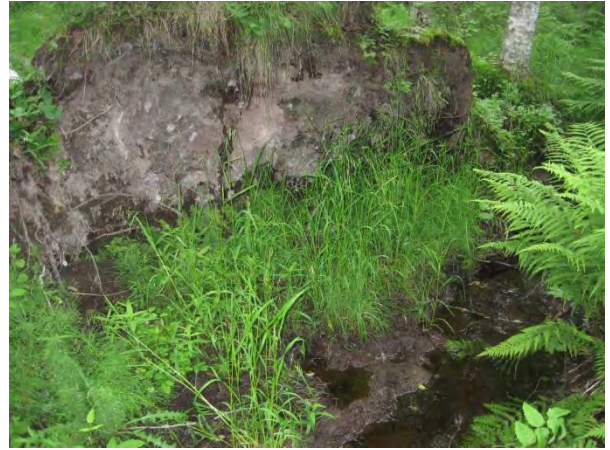
Kuva 130. Juurakon suojissa kasvava korpisorsimo

Uutelan ja Tapiolan välissä on rehevä luonnon monimuotoisuuden kannalta tärkeä puronvarsi ( luo1 ). Puro alkaa Järvi- ja Vaarinsuon ojista ja se laskee kohti Pohjoonlahtea menevää puroa. Puron varressa lähellä Kylkipirtintietä on varttunutta koivikkoa, jossa kasvaa muun muassa maakunnallisesti uhanalainen korpisorsimo, lehtotesma, soreahiirenporras ja salokeltano Hieracium sp. ( luo1 ).