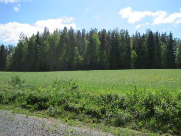
Kuva 16. Sekametsäsaareke