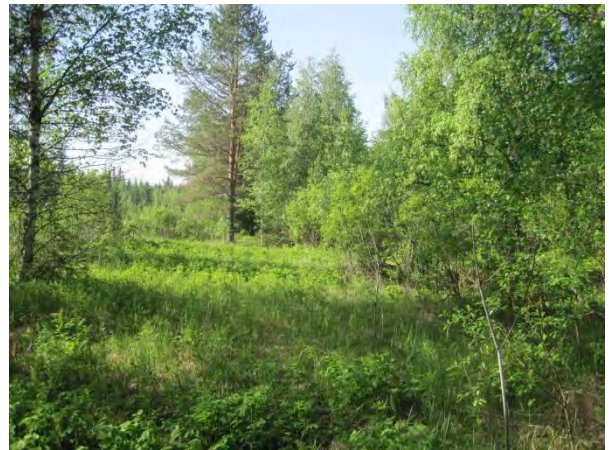
Kuva 75. Luhtaista pensaikkaa Ajakanojan varressa