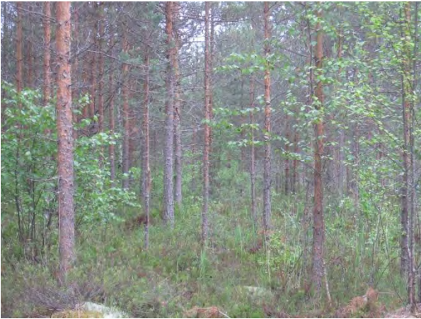
Kuva 121. Järvisuon rämettä

laulurastas ja kulorastas. Kylkisniitulla havaittiin pellolla rupikonna Bufo bufo 23.5.2014. Kylkisniitulla kukki jonkin verran mesimarja. Komealupiinikin oli leviämässä metsätien varressa.