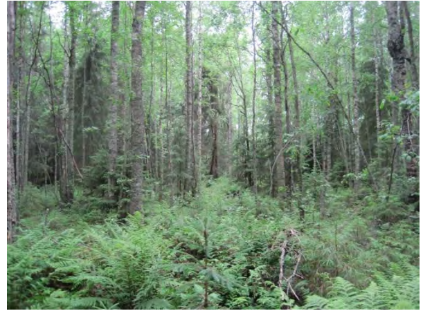
Kuva 23. Ojitettua saniaiskorpea