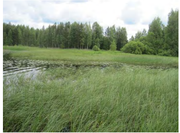
Kuva 37. Aittojärvi Kominiojan suu