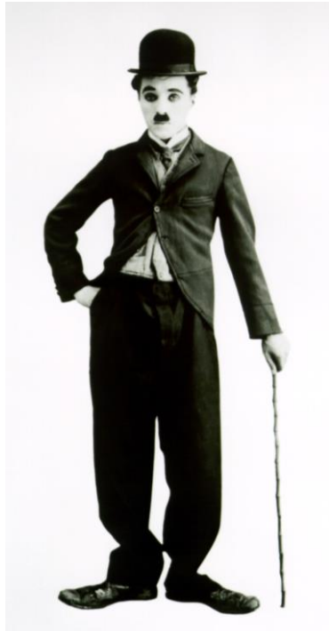
Kuva 4. Charles Chaplin Pikku Kulkurina. (Alf Wiki s.a.)

mykkäelokuvissaan (Mikkola 2014). Miimisyys linkittää Chaplinin commedia dell'arten, sillä vanhoissa näytelmissä miimisyys oli tärkeä elementti ja arvostettu taito. Mustavalkoisuuden takia elokuvan hahmoja ei voinut nostaa puvustuksen värivalinnoilla esille, joten tärkeämmiksi elementeiksi nousivat vaatteiden siluetit, mittasuhteet sekä istuvuus. Hahmojen merkitystä ei voinut korostaa puheilla, joten muun muassa aseman täytyi näkyä vaatetuksessa. Elokuvien päähenkilö eli Pikku Kulkuri on helppo erottaa muista tunnusomaisen ulkonäkönsä ansiosta.