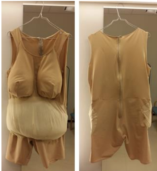
Kuva 28. Angela Brosin alushaalari.