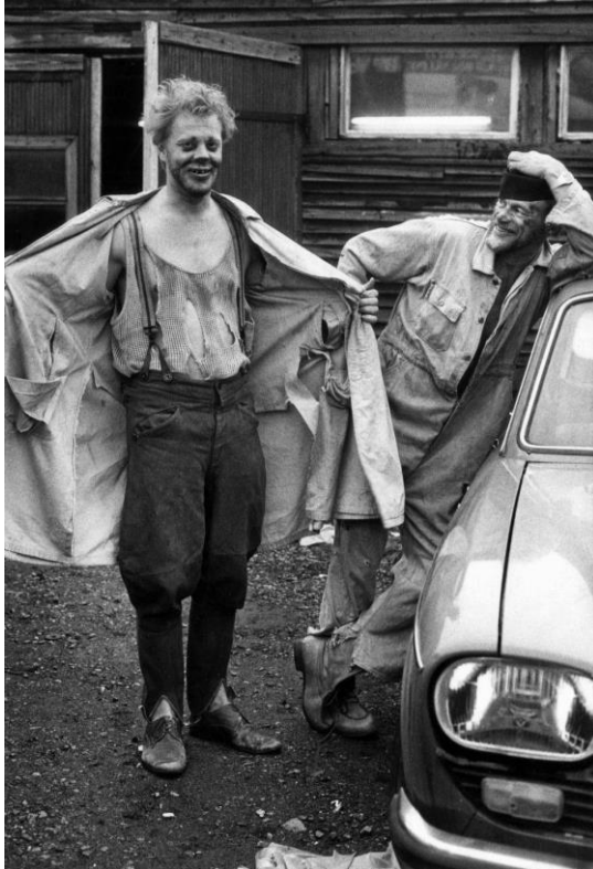
Kuva 9. Vesa-Matti Loiri Uuno Turhapurona ja Pertti Pasanen Härski Hartikaisena