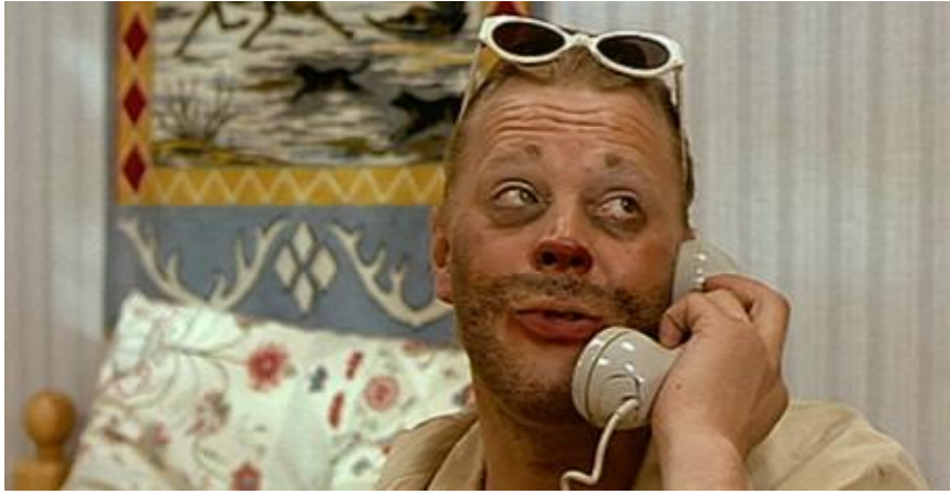
Kuva 10. Uuno lepertelee naiselle. (Episodi s.a.)