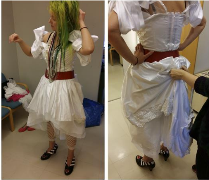
Kuva 25. Alli Kaattorin lopullisen mekon sommittelua.

Alli Kaattorin uutta mekkoa sovitettiin myös Pikkuvanhasen puvun tapaan vielä erikseen. Alli Kaattorille sovitettiin nyt jo lyhennettyä morsiusmekkoa, jonka puhvihihoja oli korostettu (Kuva 28.). Hahmolle oli otettu mukaan myös muuta rekvisiittaa kuten pitkiä muovisia helmikaulakoruja sekä punainen vyö. Melkeinpä kaikki tämän hahmot osat löytyivät käytettyinä kirpputorilta. Kengät olivat myös itse maalatut, mutta eivät päätyneet lopulta lopulliseen hahmoon.