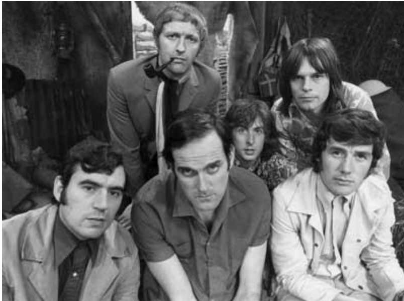
Kuva 5. Monty Pythonit vuonna 1969. (Jones 1969)

Alusta asti Monty Python tarjosi tekijöilleen vapauden tehdä mitä halusivat. Ajalleen erikoista Pythonissa oli sen välillä sisältämä tietynlainen väkivalta, vaikka Vietnamin sota oli yhä käynnissä ja yleinen mielipide oli väkivallan vastainen. Monty Python esitti ohjelmassaan parodioita muun muassa mainoksista, dokumenteista ja erilaisista haastatteluista, kuten moni muukin sketsiryhmä heidän jälkeensä. Suositua Lentävä Sirkus -ohjelmaa esitettiin 45 jakson verran, muuallakin kuin Isossa-Britanniassa, ja se voitti useita palkintoja. Show keräsi nopeasti vakiintuneen fanipohjan. Myöhemmin Pythonit tekivät vielä seitsemän elokuvaa sekä useita live-taliointeja. (BBC Comedy; Gent 2014; Chapman ym. 2008, 226.)