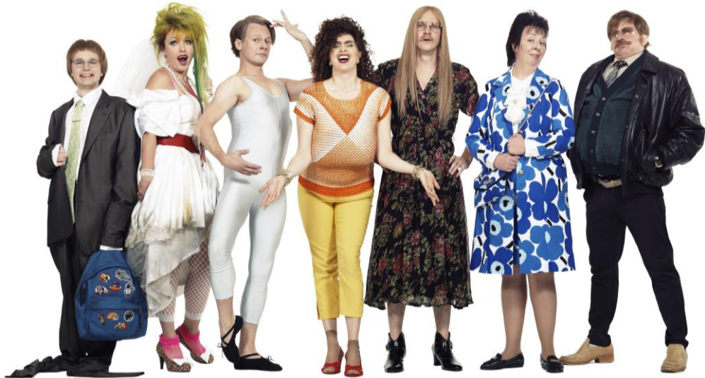
Kuva 17. Putouksen seitsemännän kauden sketsihahmot