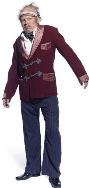
Kuva 37. Arvid Von Maksa