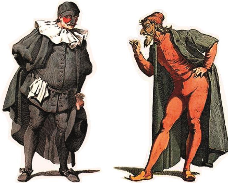
Kuva 1. Maurice Sandin tulkinta Il Dottoresta ja Pantalonestä (Sand s.a.)

Pantaloneille polvihousuissaan, sukissaan ja kalotissaan, jotka ovat kaikki mustia. Maski Il Dottorella peittää vain nenän ja otsan. (Schwartz s.a., 15-18; Rudlin 1994, 92-93, 100.)