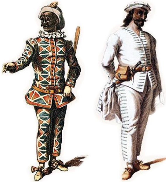
Kuva 3. Maurice Sandin tulkinta Harlekiinista ja Brighellasta. (Sand s.a.)