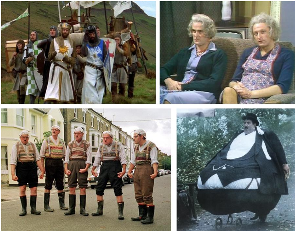
Kuva 6. Kollaasi Monty Python hahmoista.