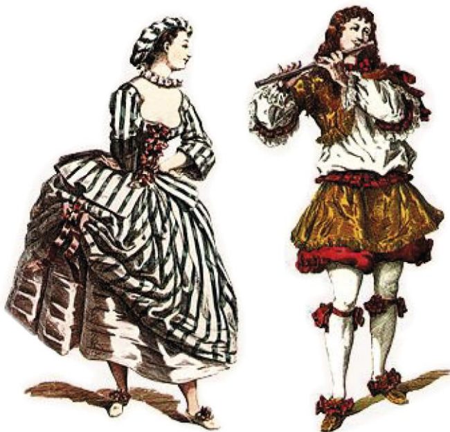
Kuva 2. Maurice Sandin tulkinta rakastavaisista. (Sand s.a.)

Seuraava kaksikko ovat rakastavaiset (Kuva 2.). Heidän asemansa on korkea ja Il Dottore on yleensä jommankumman isä. He ovat nuoria ja viehättäviä ja ovat pukeutuneet viimeisimmän muodin mukaan. Mies on yleensä pukeutunut sotilaaksi tai kadetiksi. Molemmat on meikattu raskaasti ja maskia ei ole. (Rudlin 1994, 106-108.)